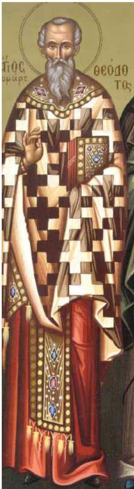
Άγιος Θεόδωτος ο εν Άγκυρα