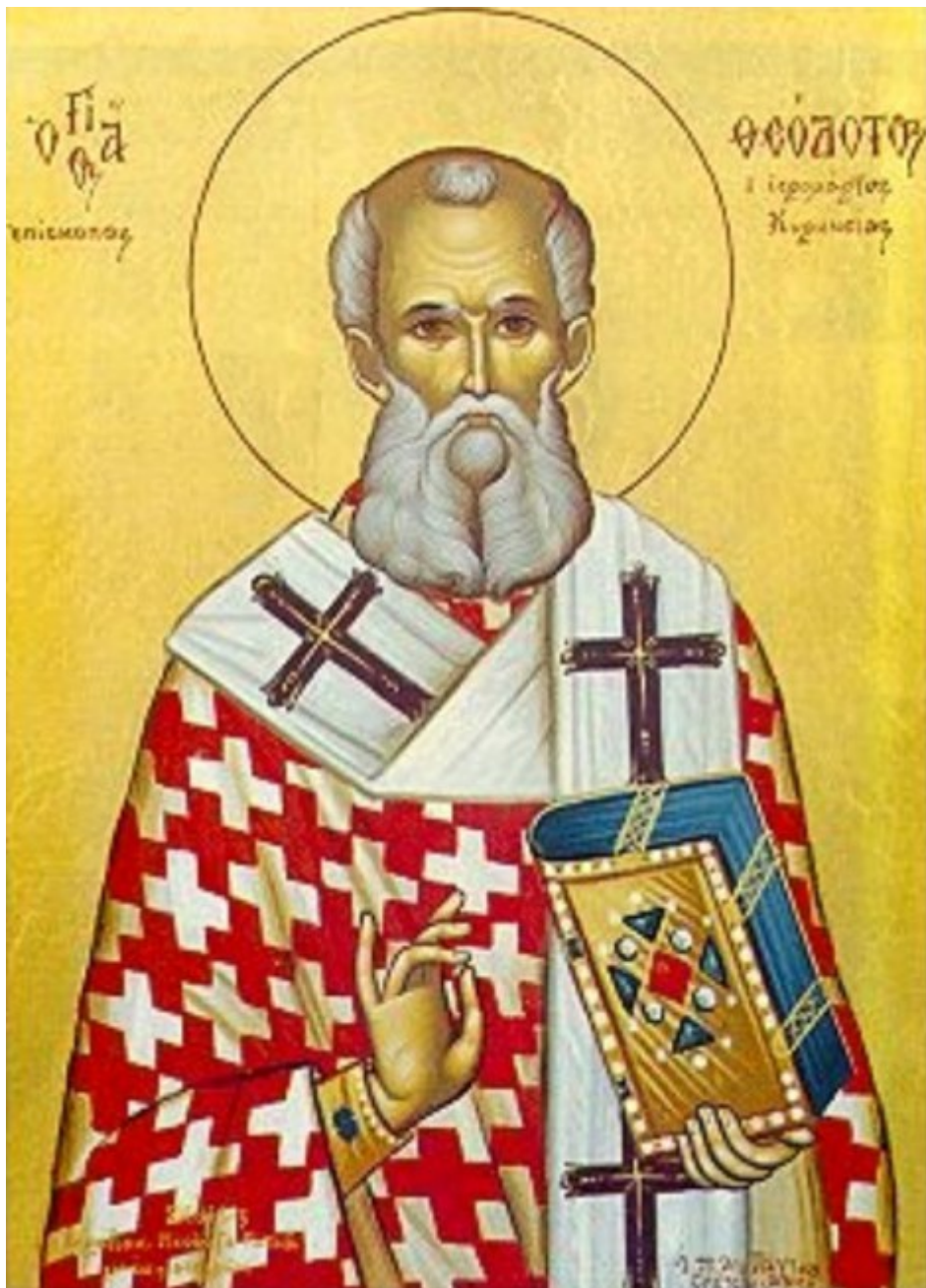
Άγιος Θεόδωτος ο εν Άγκυρα