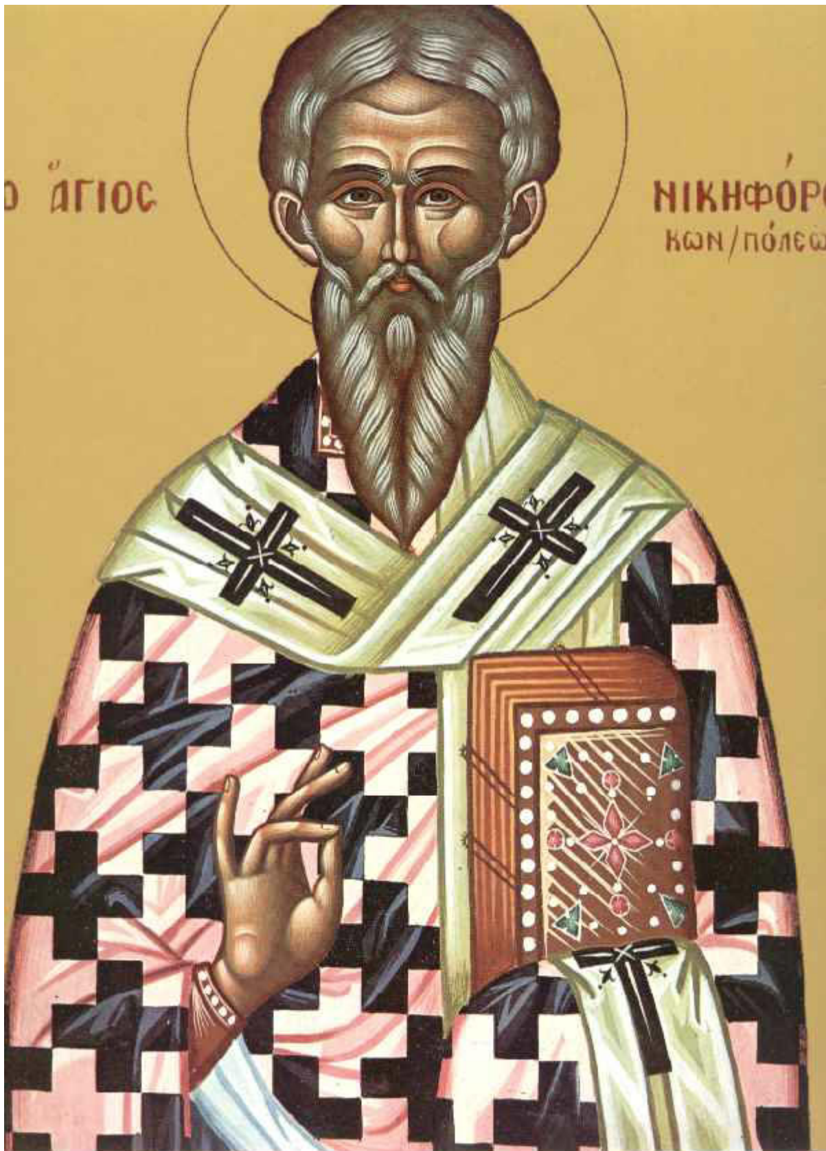
Άγιος Νικηφόρος ο Ομολογητής, Πατριάρχης Κωνσταντινουπόλεως