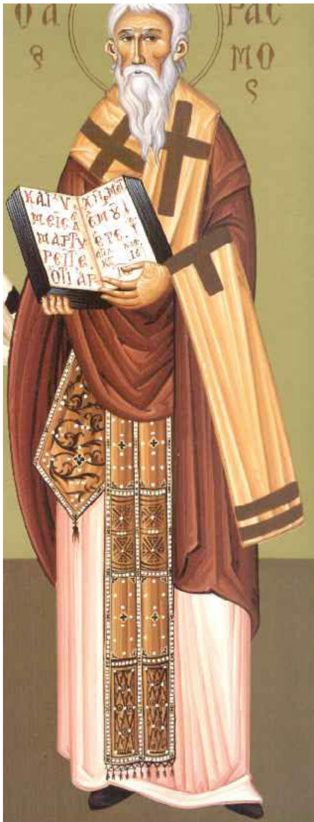
Όσιος Έρασμος ο Ιερομάρτυρας