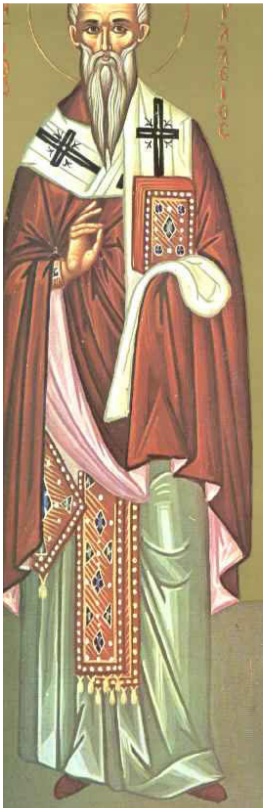
Όσιος Αχίλλιος Επίσκοπος Λαρίσης