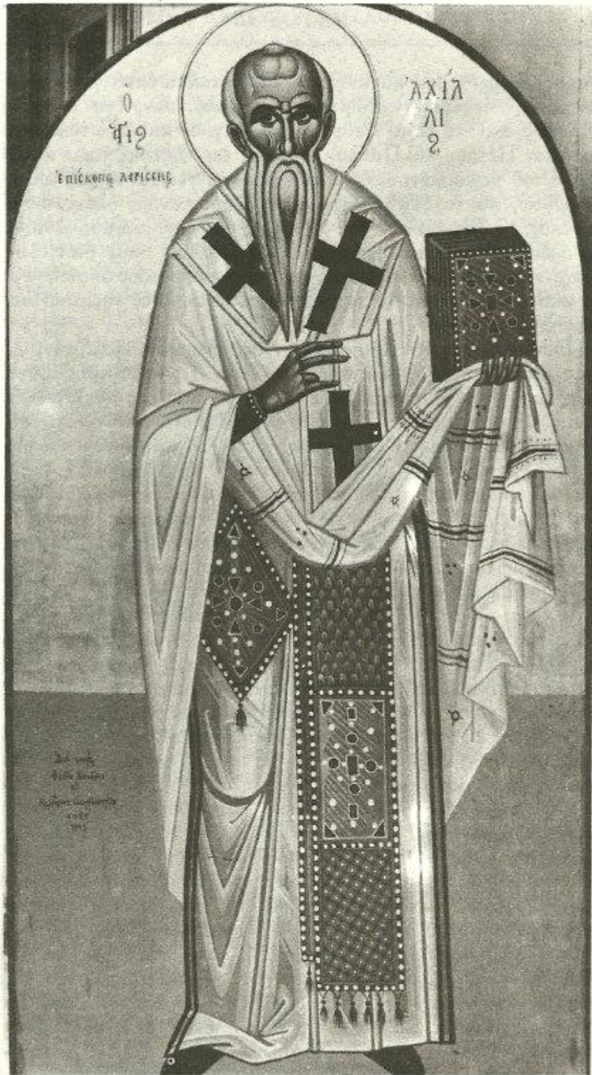
Όσιος Αχιλλίος Επίσκοπος Λαρίσης - Φώτης Κόντογλου