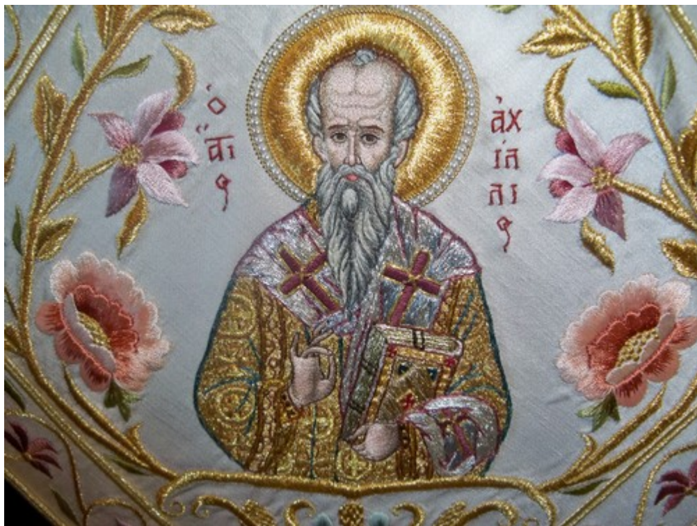
Όσιος Αχιλλίος Επίσκοπος Λαρίσης