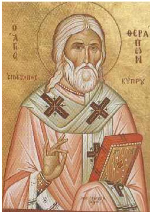
Άγιος Θεράπων επίσκοπος Κύπρου