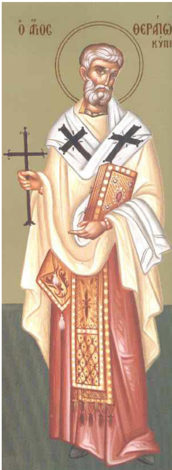
Άγιος Θεράπων επίσκοπος Κύπρου