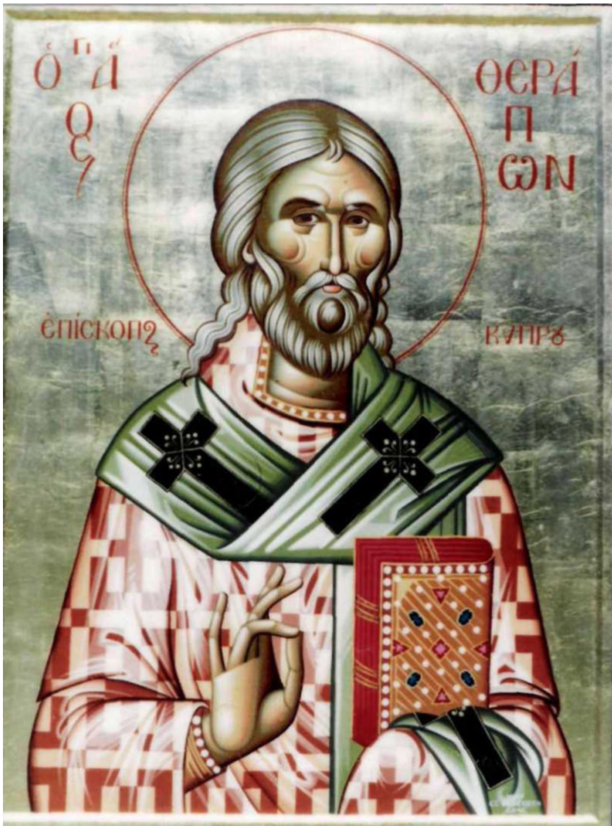
Άγιος Θεράπων επίσκοπος Κύπρου