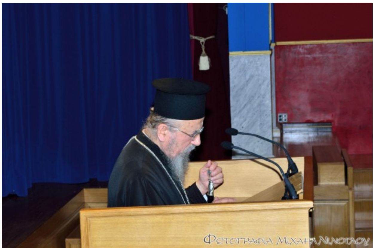
Εκ της Ιεράς Μονής