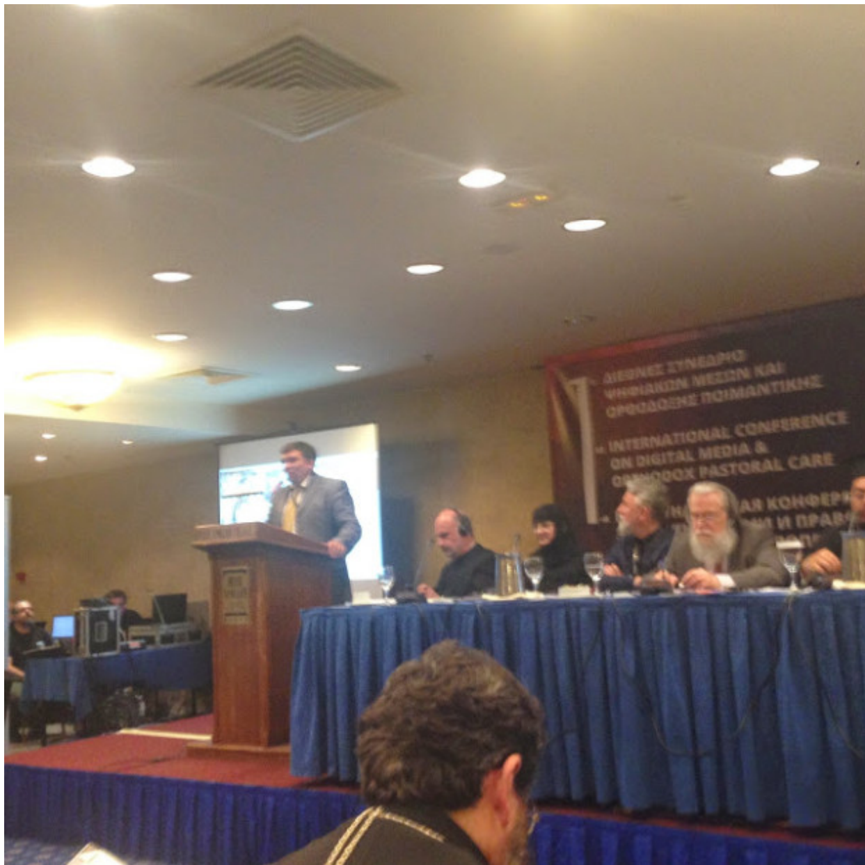
Ερωτήσεις - Συζήτηση