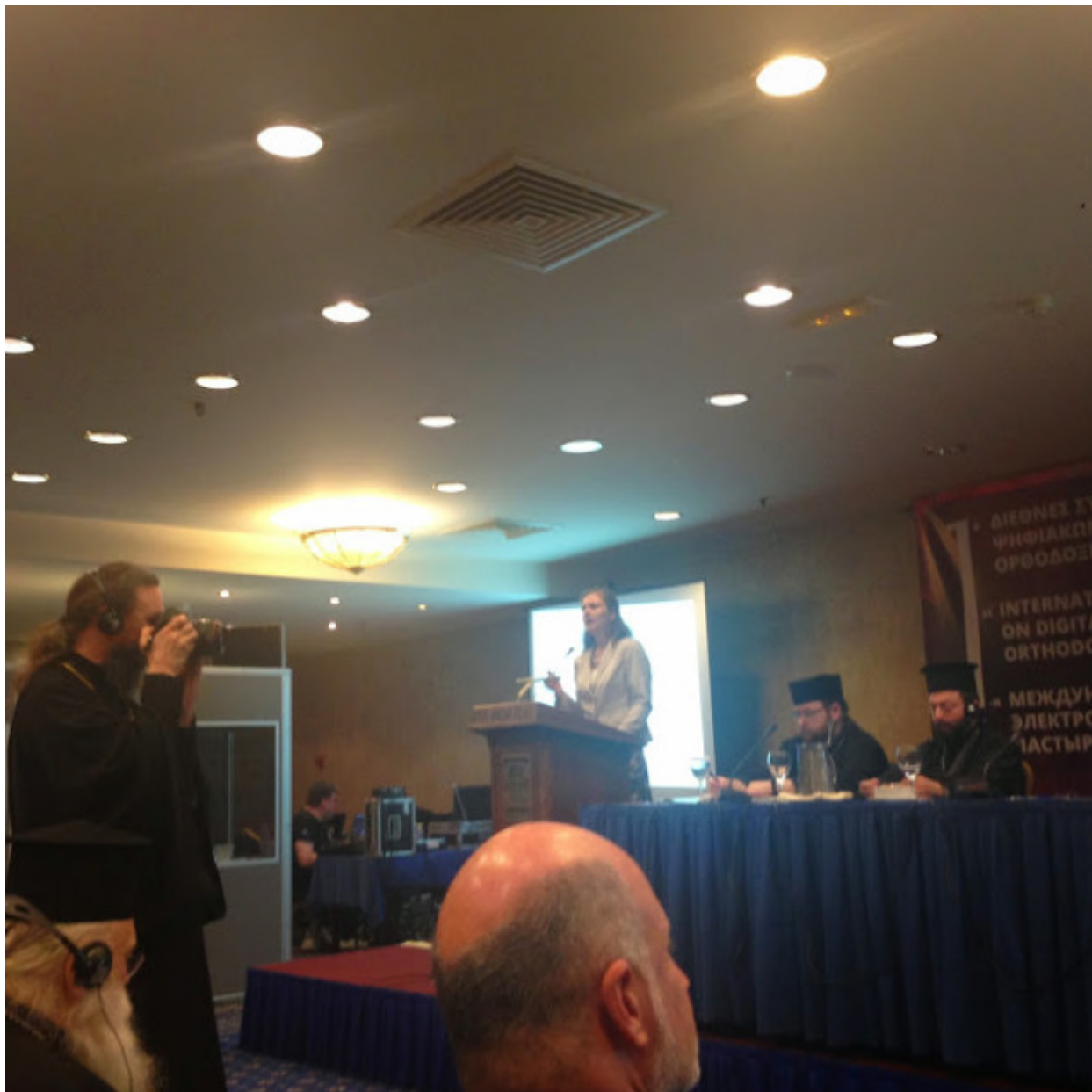
π. Μπασάμ Νασίφ “Διάκριση: Πνευματικά γυαλιά για τους χρήστες του διαδικτύου”