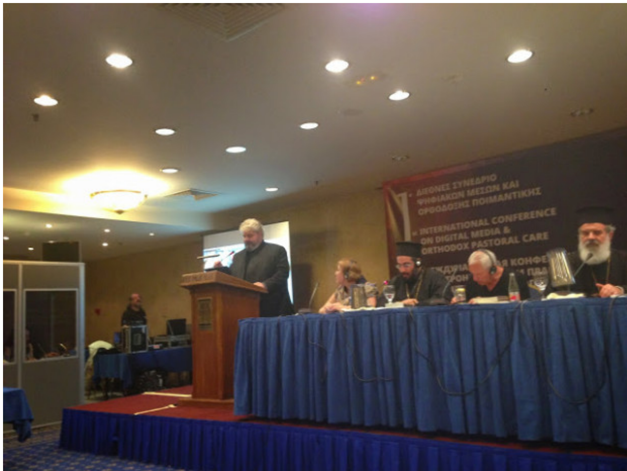
Κλάους Κέννεθ “Από την ψηφιακή κοιλάδα της απληστίας στον “Άρτο της Ζωής”.