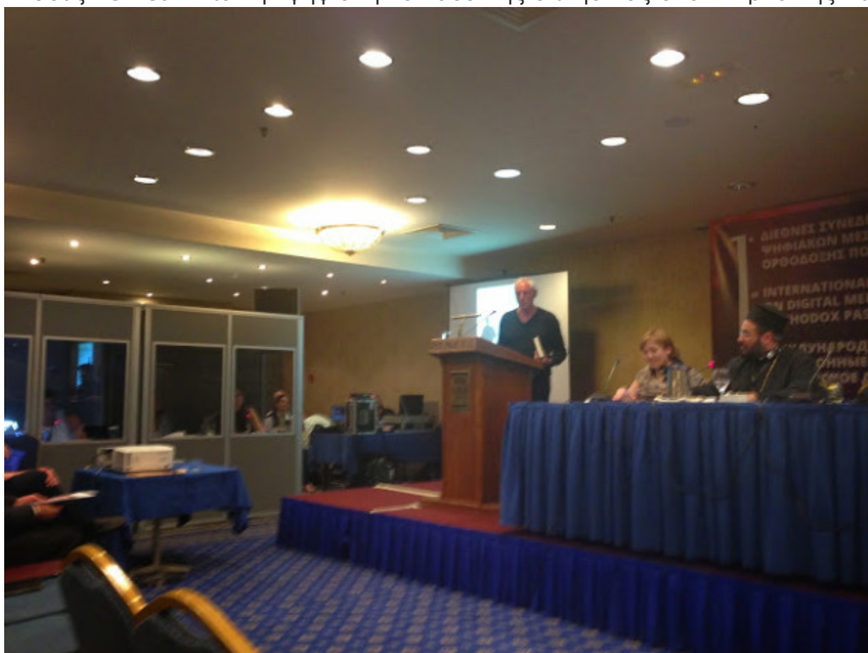
Ερωτήσεις - Συζήτηση