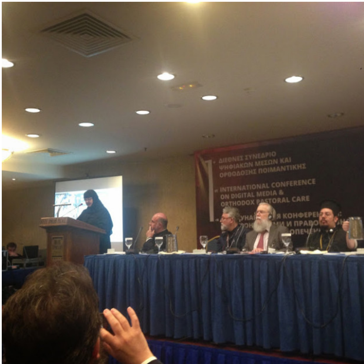
Ολέγκ Ποκρόφσκι “Το Crowd funding στα ορθόδοξα ΜΜΕ: μύθοι και πραγματικότητα”.