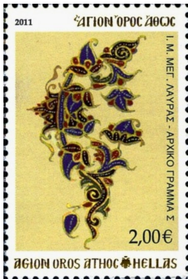
2011 Ιερά Μονή Μεγίστης Λαύρας Πρωτόγραμμα. Το γράμμα Σ