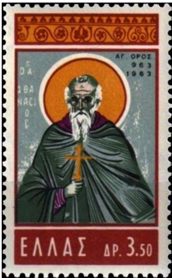
1963 Άγιος Αθανάσιος ο Αθωνίτης