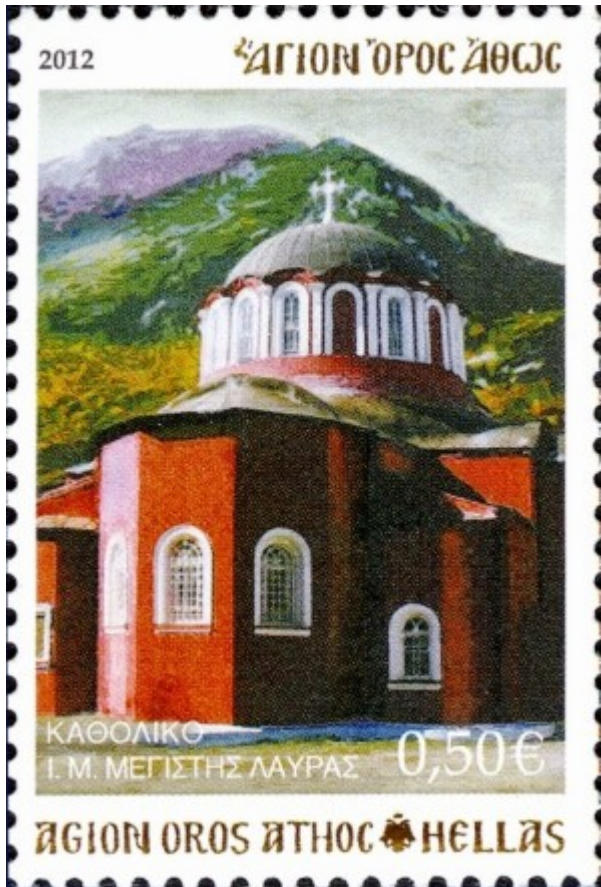
2012 Το καθολικό της Ιεράς Μονής Μεγίστης Λαύρας