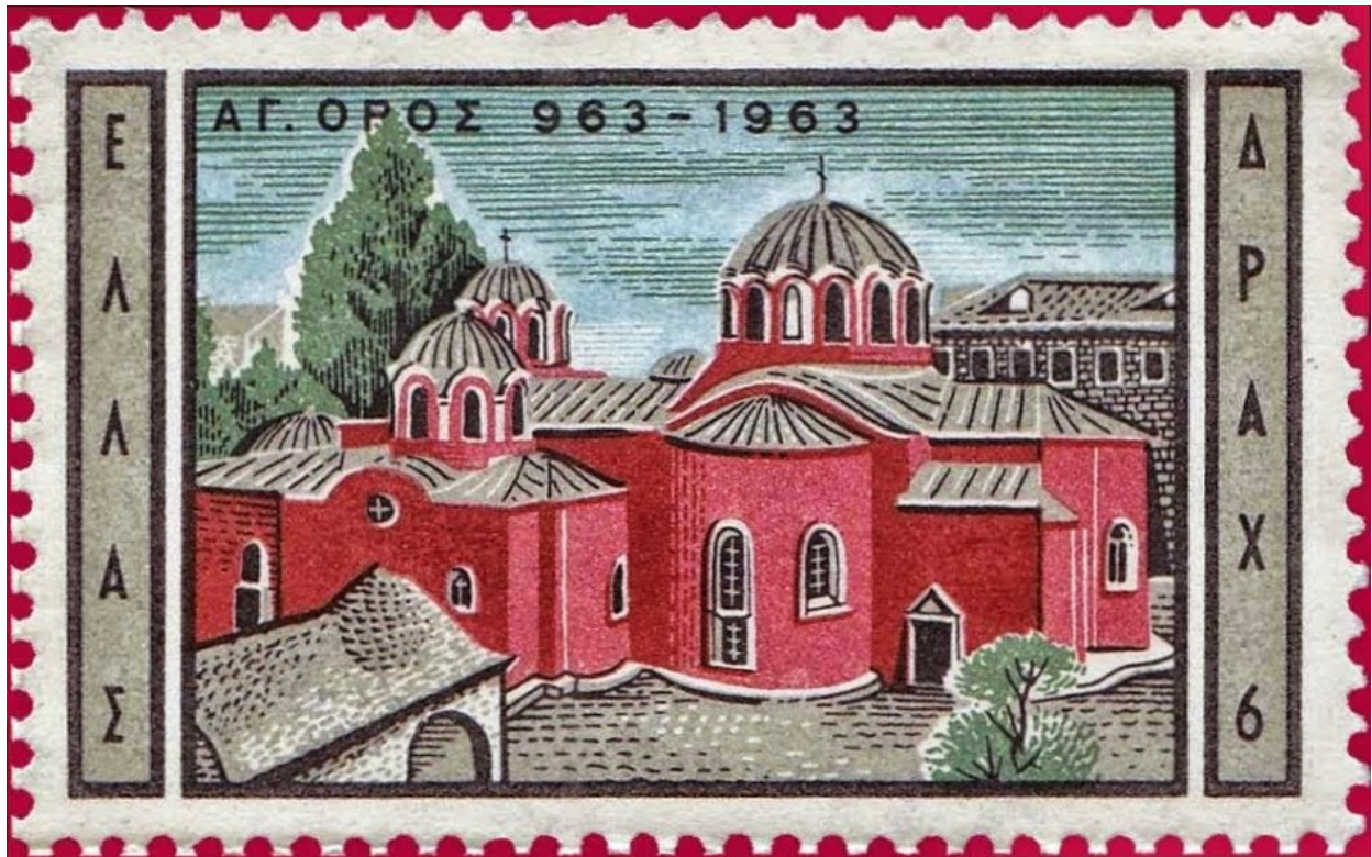
1963 Άγιο Όρος. Το Καθολικό της Μεγίστης Λαύρας