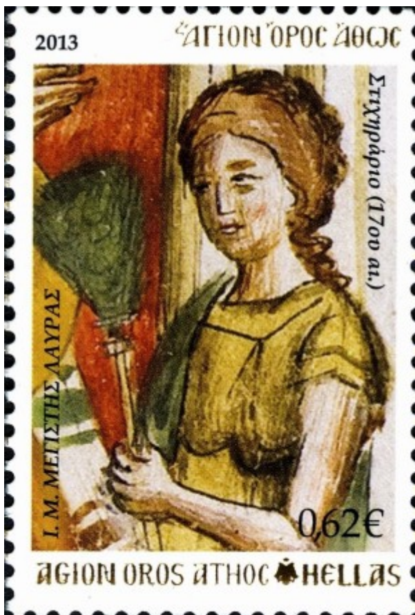
2013 Στιχηράριο (Μουσικό χειρόγραφο) 17ου