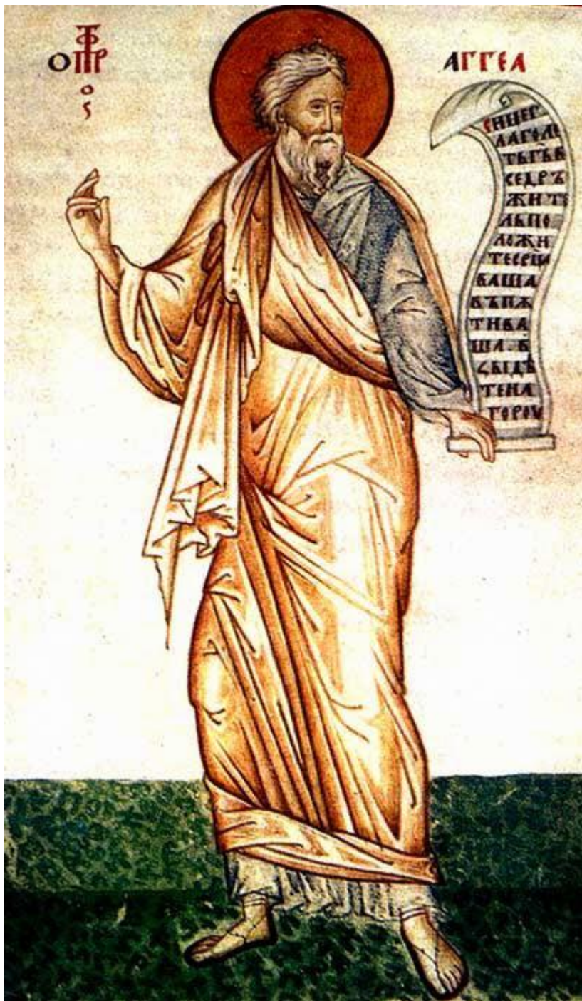
O Santo Profeta Ageu

profetizava em Judá, na época do rei persa Dario I (522-486 a. C). Naquele tempo, sob a liderança de Zorobabel, os judeus retornaram do cativeiro da Babilônia para Judá. O sumo sacerdote se chamava Josué. Dois anos depois do regresso, os judeus começaram a construir em Jerusalém um Templo no mesmo lugar em que, antes, se encontrava o antigo Templo de Salomão, destruído. Por causa de um desacordo com os samaritanos e outros opositores, a construção do templo foi interrompida