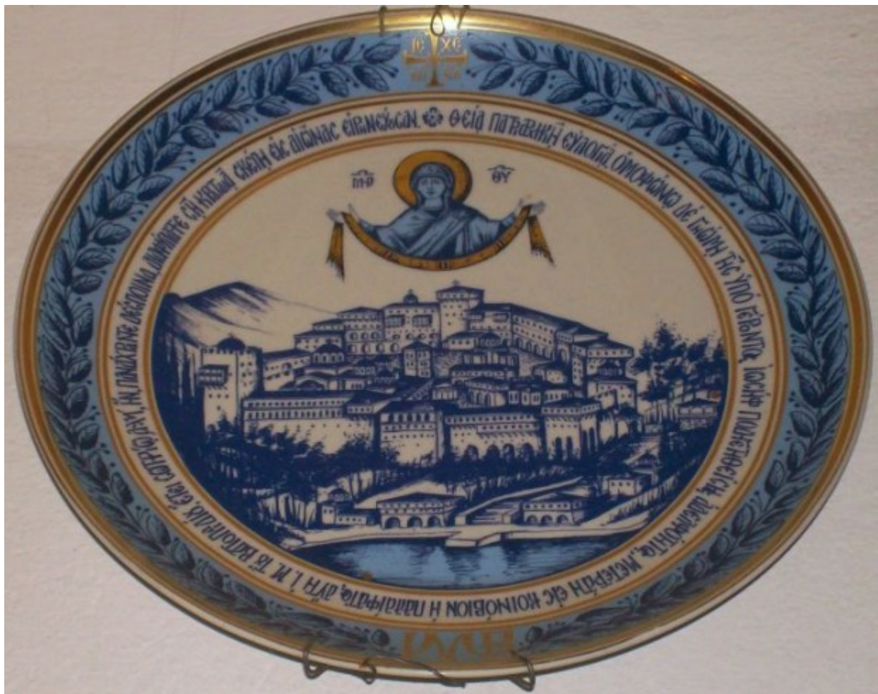
Πορσελάνινο πιάτο που εδόθη ως ευλογία, σε ανάμνηση της Κοινοβιοποίησης της Ιεράς Μονής Βατοπαιδίου το 1990