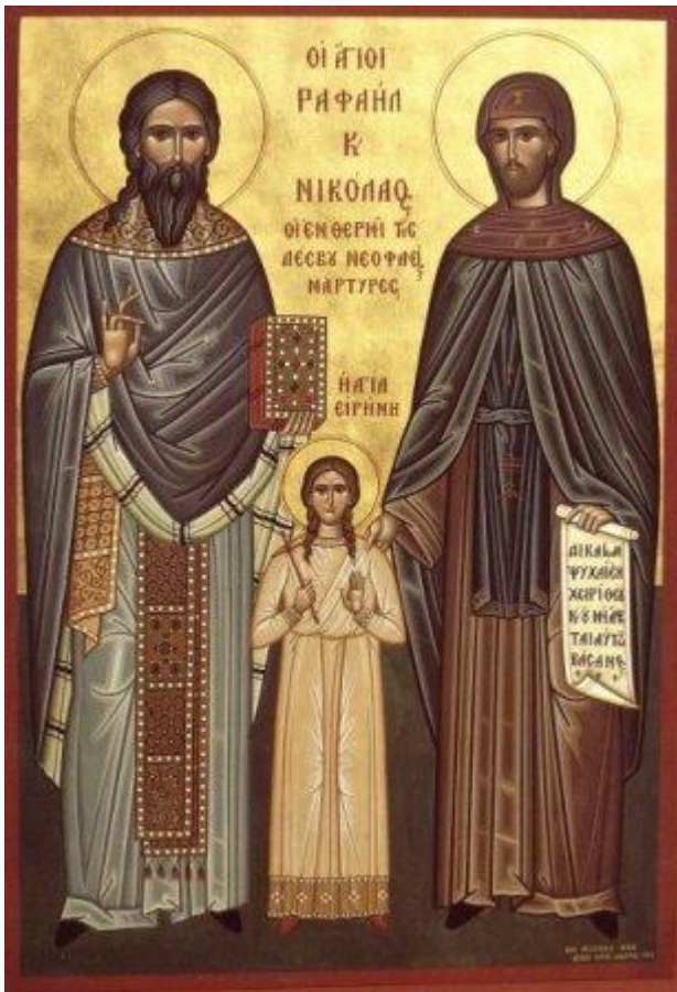
Άγιοι Ραφαήλ, Νικόλαος, Ειρήνη και οι συν αυτοίς

Επίσημος κατάταξη του Αγ. Ραφαήλ και των συν αυτώ, εις το Αγιολόγιον της Εκκλησίας