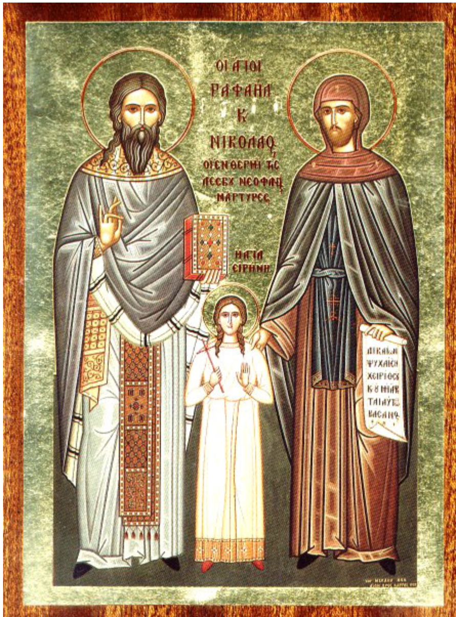
Άγιοι Ραφαήλ, Νικόλαος, Ειρήνη και οι συν αυτοίς

Ορθοδοξία και Ορθοπραξία / Συναξαριακές Μορφές