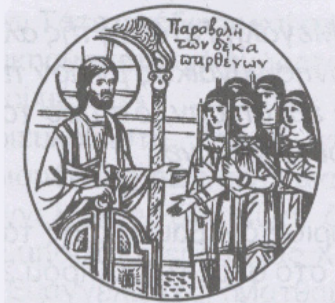
Μεγάλη Τρίτη - Των Δέκα Παρθένων