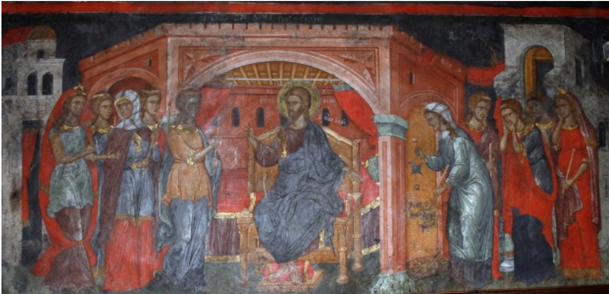
Μεγάλη Τρίτη - Των Δέκα Παρθένων

Ορθοδοξία και Ορθοπραξία / Συναξαριακές Μορφές