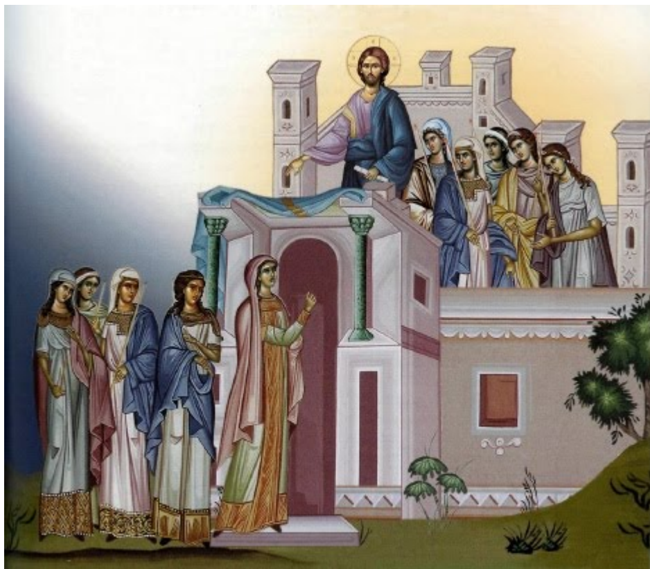
Μεγάλη Τρίτη - Των Δέκα Παρθένων