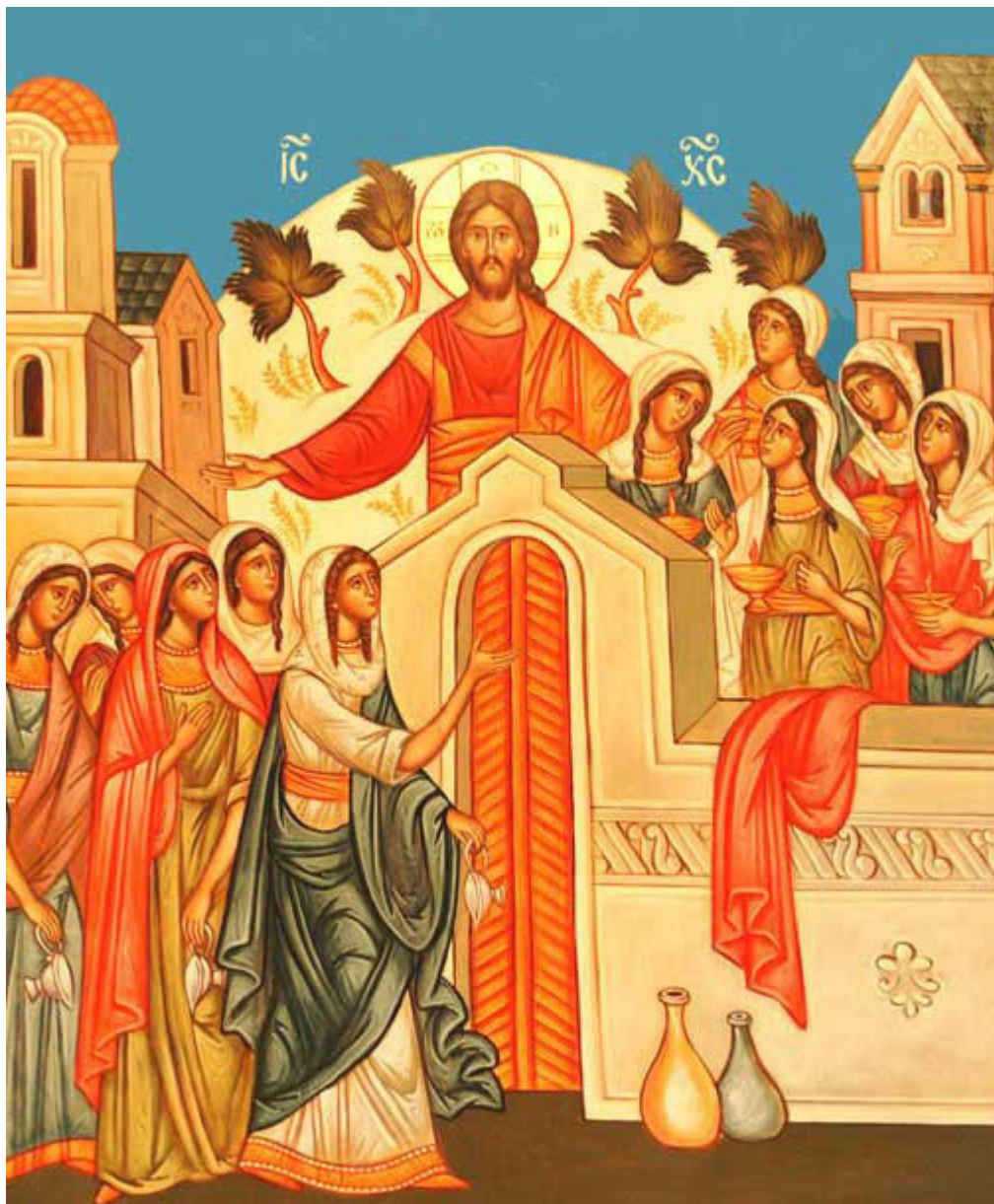
Μεγάλη Τρίτη - Των Δέκα Παρθένων