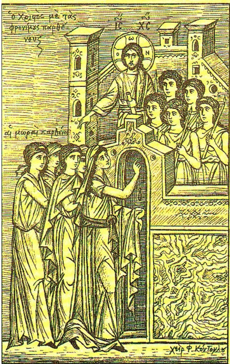
Μεγάλη Τρίτη - Των Δέκα Παρθένων