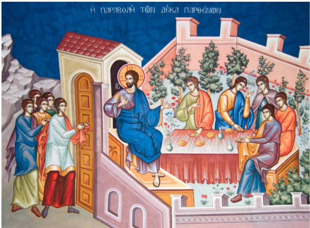
Μεγάλη Τρίτη - Των Δέκα Παρθένων