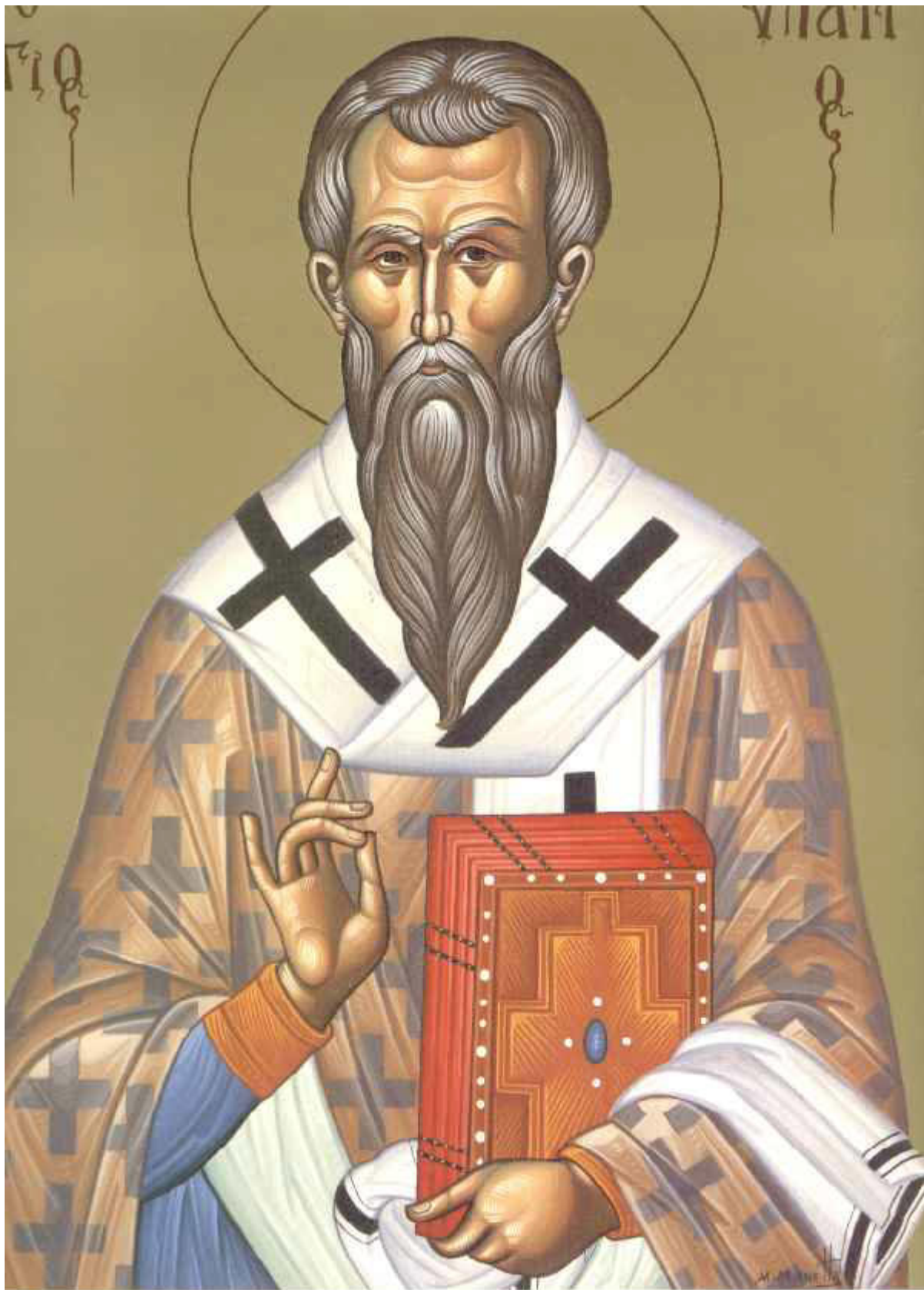
Άγιος Υπάτιος επίσκοπος Γαγγρών