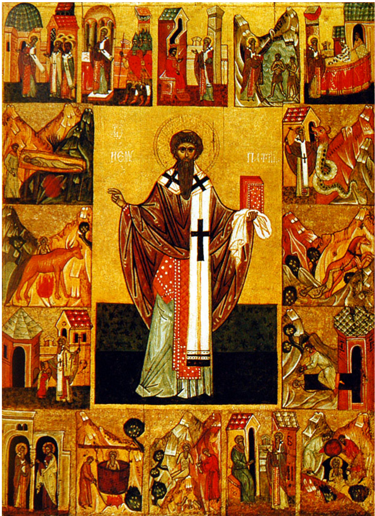
Άγιος Υπάτιος επίσκοπος Γαγγρών