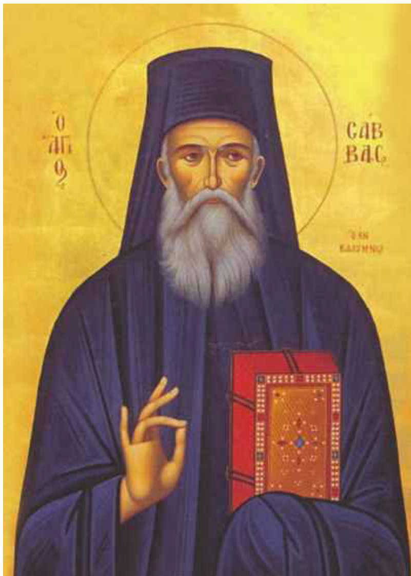
Όσιος Σάββας ο Νέος ο εν Καλύμνω