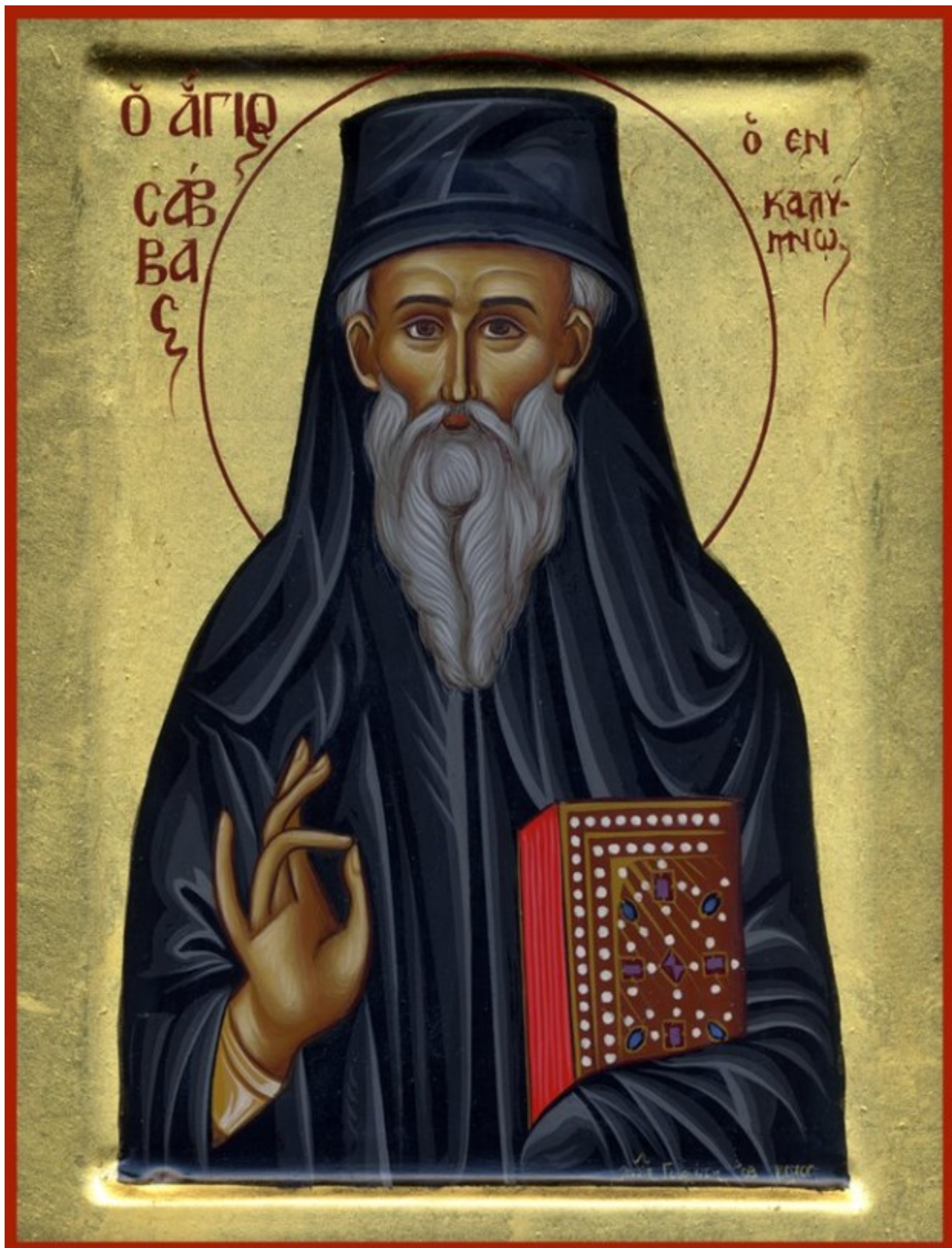
Όσιος Σάββας ο Νέος ο εν Καλύμνω - Λυδία Γουριώτη© ( http://lydiagourioti-iconography.blogspot.com )

Ο φωτεινός αυτός αστέρας της χορείας των Αγίων , ο Θεοφιλέστατος πατήρ , προστάτης της ευσεβούς νήσου Καλύμνου Σάββας ο νέος, γεννήθηκε το έτος 1862 στην Ηρακλείτσα της περιφέρειας Αβδίμ της Ανατολικής Θράκης, από πτωχούς και απλούς γονείς τον Κωνσταντίνο και τη Σμαραγδή και έλαβε το όνομα Βασίλειος.Ο