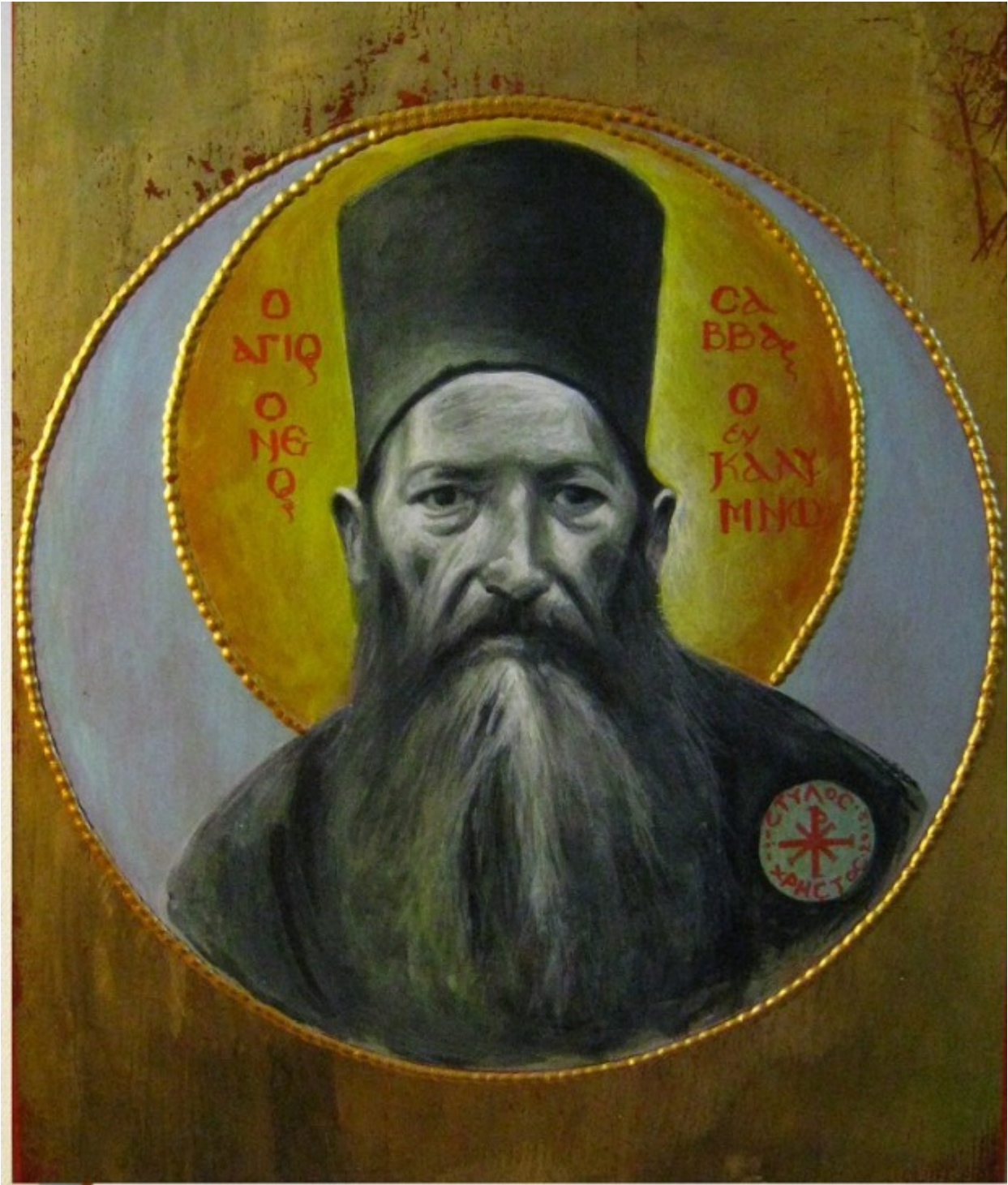
Όσιος Σάββας ο Νέος ο εν Καλύμνω