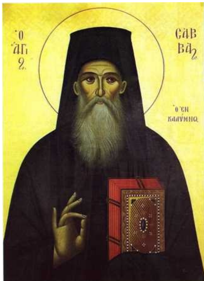
Όσιος Σάββας ο Νέος ο εν Καλύμνω