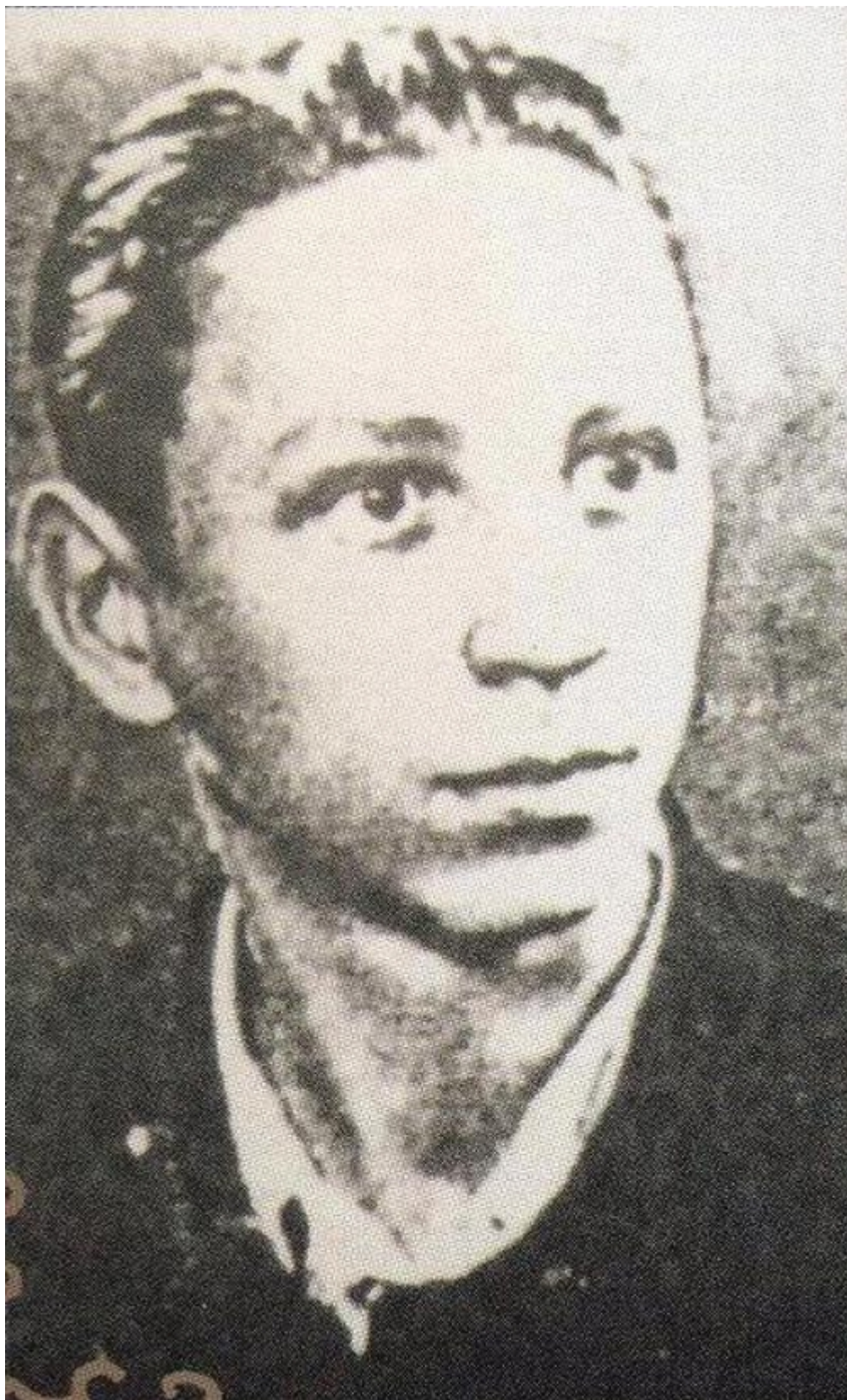
Ο πρωτομάρτυρας Κορνήλιος Νίτσα από την «Αναμόρφωση» στις φυλακές Πιτέστι