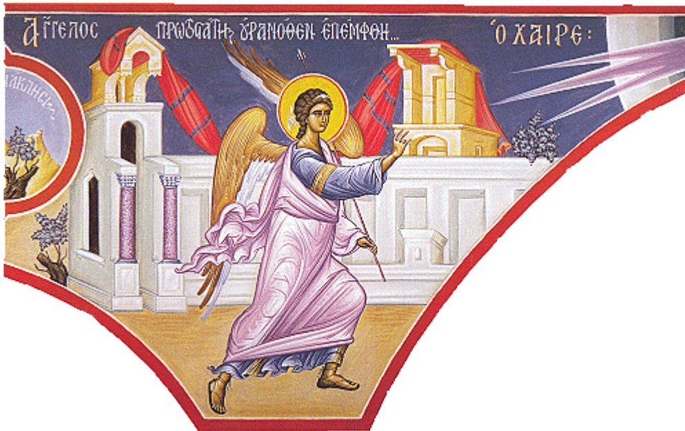
Ἄγγελος πρωτοστάτης, οὐρανόθεν ἐπέμφθη....