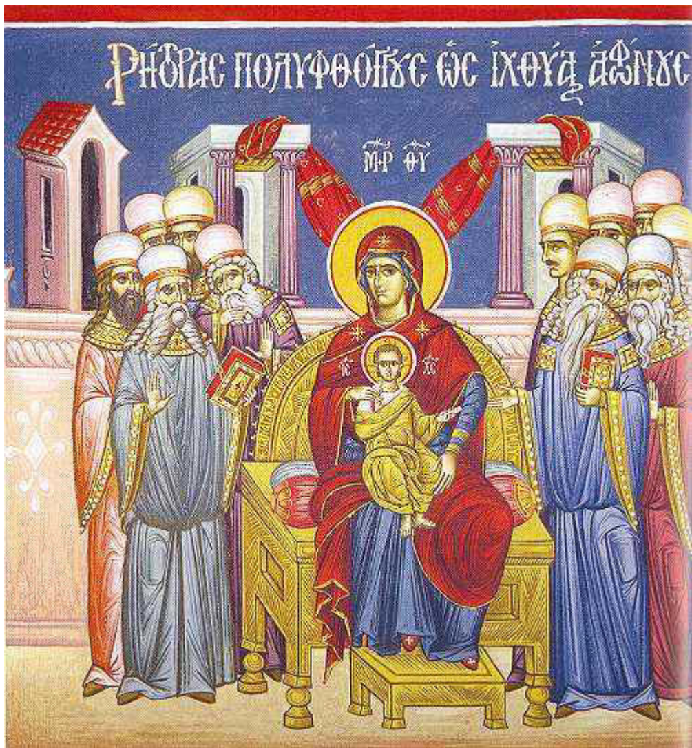
Ρήτορας πολυφθόγγους, ως ιχθύας άφώνους....