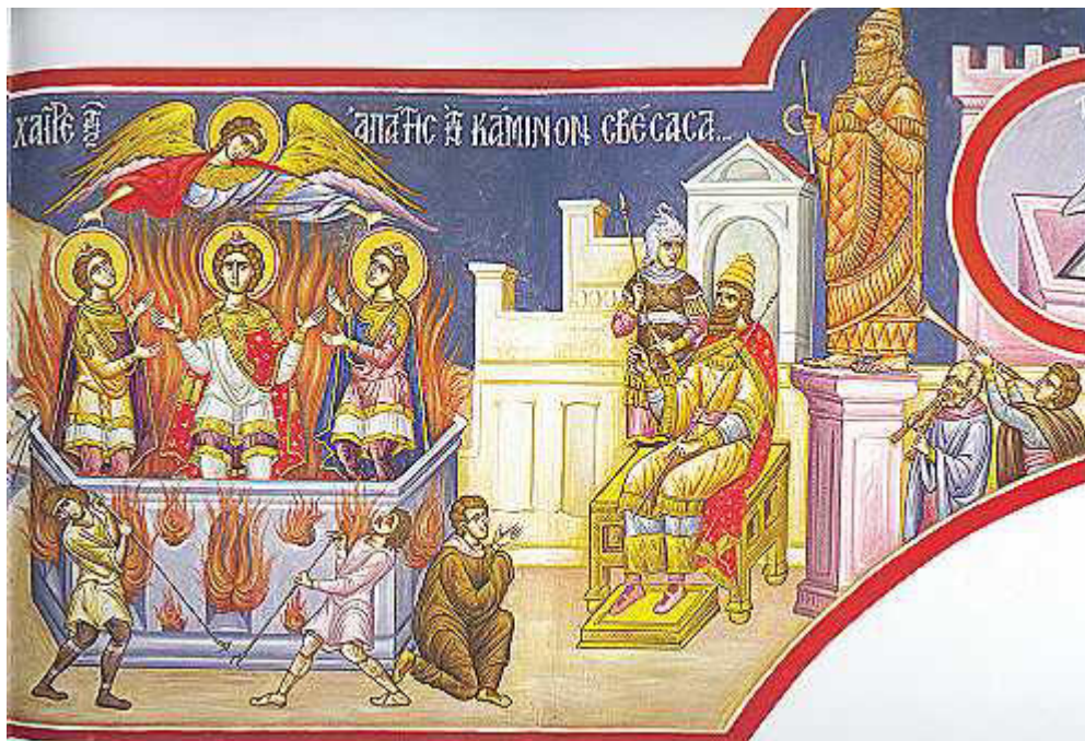
Χαίρε, τῆς ἀπάτης τὴν κάμινον σβέσασα....