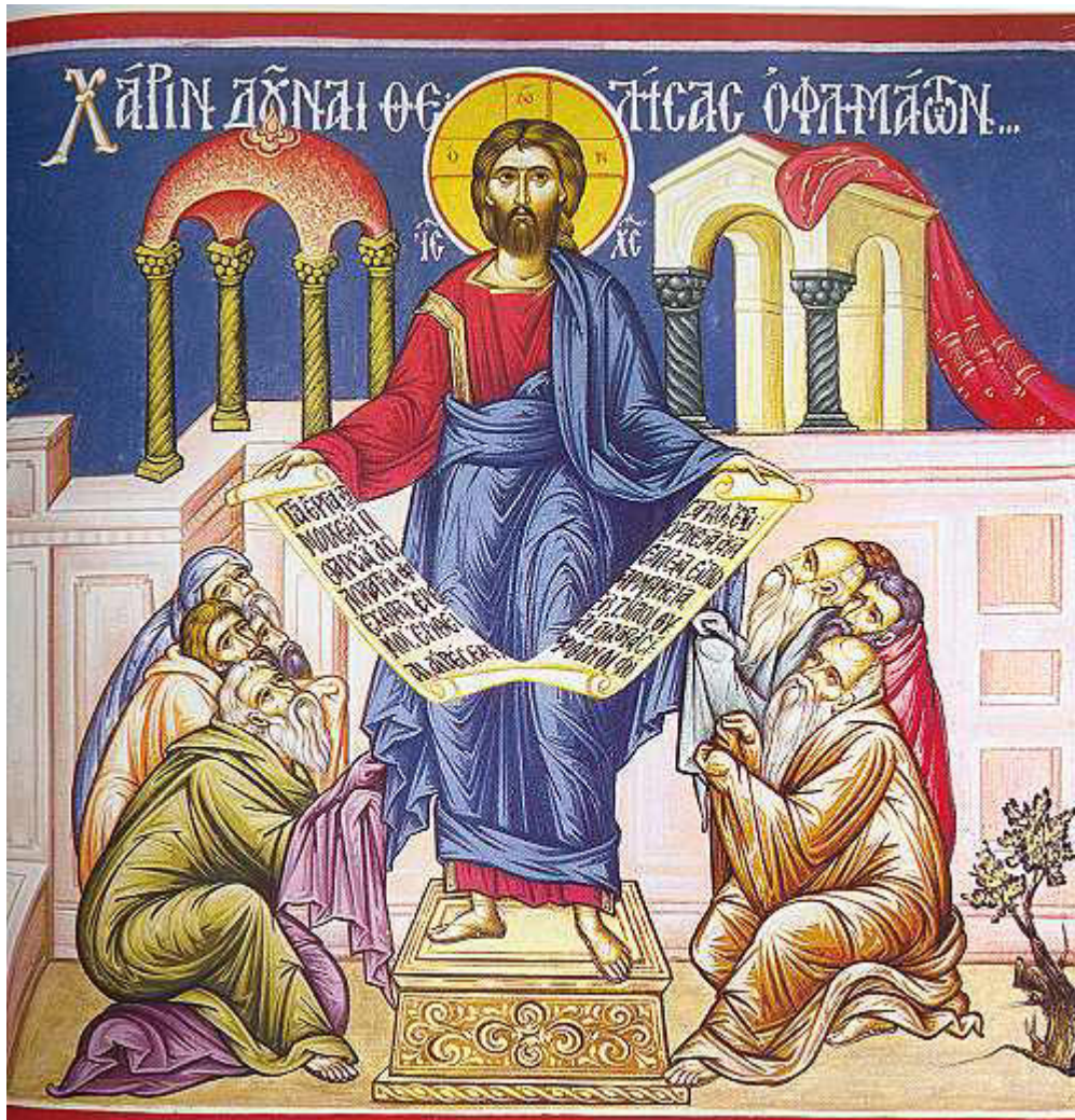
Χάριν δοῦναι θελήσας, ὀφλημάτων ἀρχαίων....