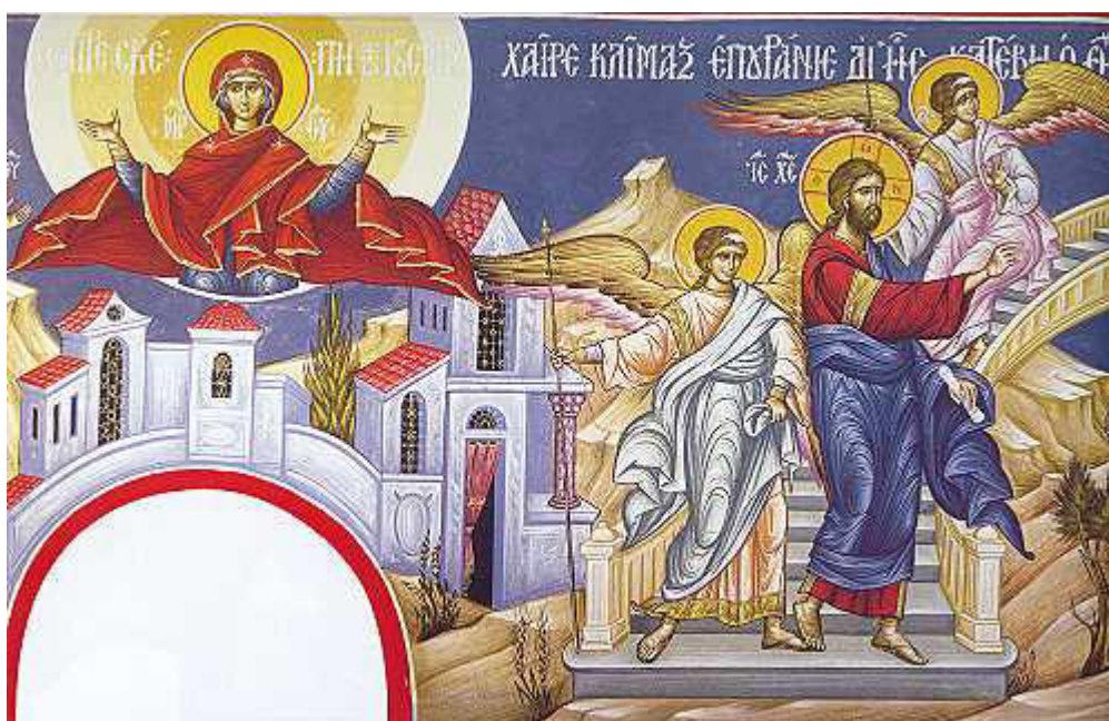
Χαῖρε, κλιμαξ ἐπουράνιε, δι' ἧς κατέβη ὁ Θεός....