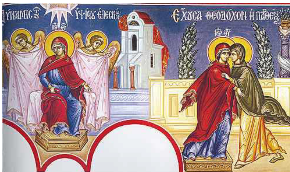
Δύναμις του Ύψιστου, έπεσκίασε τότε... / Έχουσα θεοδόχον, ή Παρθένος την μήτραν....