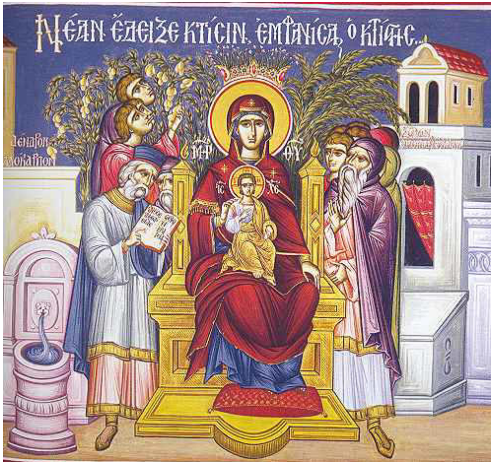
Μέλλον ἔδειξε κτίσιν, ἐμφανίσας ὁ κτίστης....