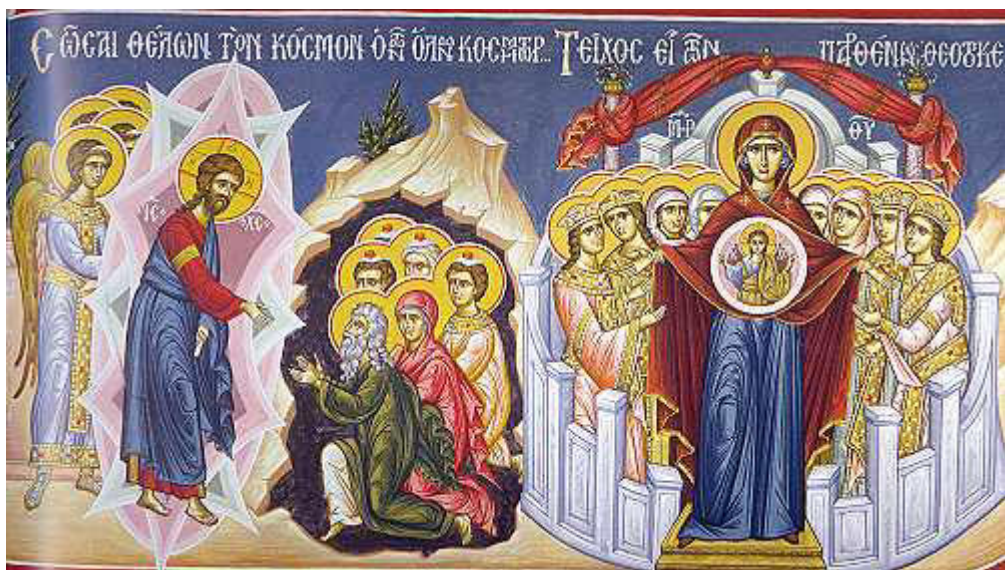
Σώσαι θέλων τὸν κόσμον, ὁ τῶν ὄλων κοσμητῶρ.... / Τείχος εἶ τῶν παρθένων,