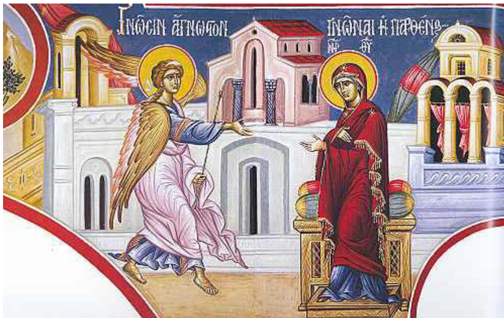
Γνώσιν άγνωστον γνώναι, ή Παρθένος ζητούσα....