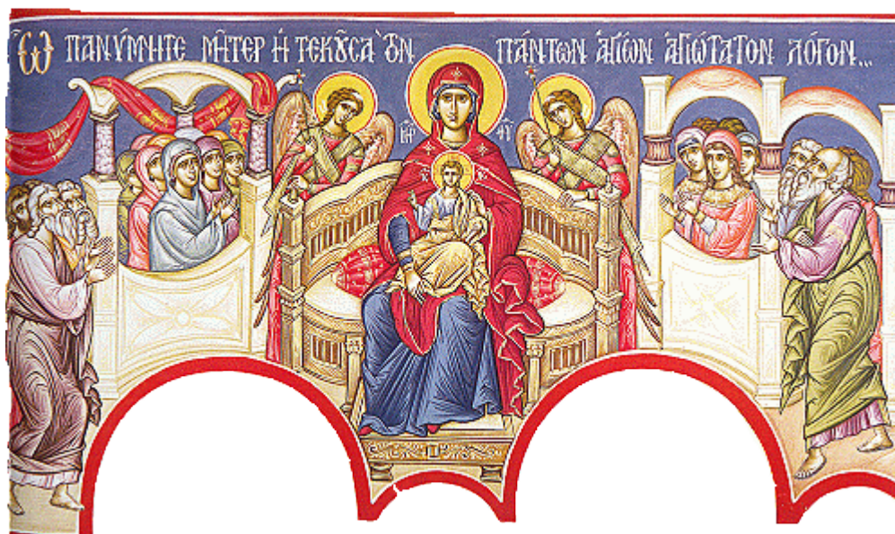
Ω πανύμνητε Μήτηρ, ἡ τεκοῦσα τὸν πάντων ἁγίων ἁγιώτατον Λόγον....