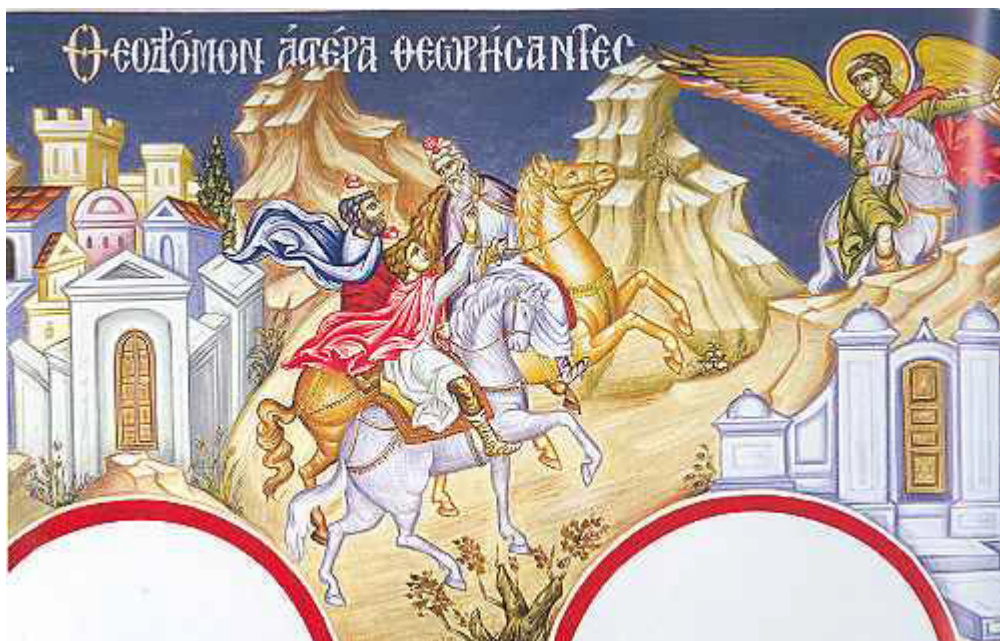
Θεοδόμον ἀστέρα, θεωρήσαντες Μάγοι....