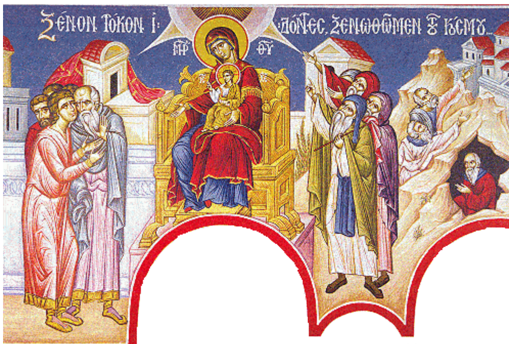
Ξένον τόκον ἰδόντες, ξενωθῶμεν τοῦ κόσμου....