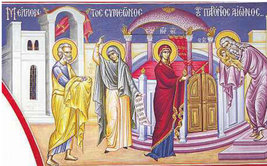
Μέλλοντος Συμεῶνος, τοῦ παρόντος αἰῶνος....