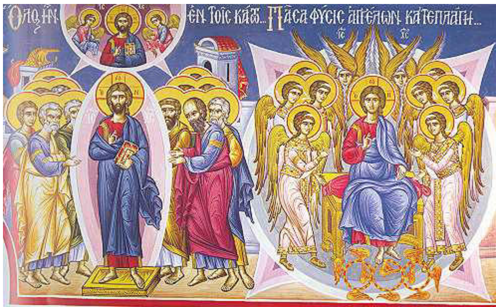
Ὅλων ἦν ἐν τοῖς κάτω... / Πᾶσα φύσις Ἀγγέλων, κατεπλάγη τὸ μέγα...