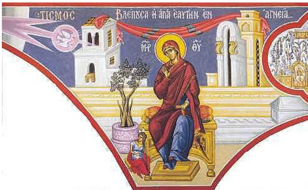
Βλέπουσα ἡ Ἁγία, ἑαυτὴν ἐν ἀγνεΐᾳ....