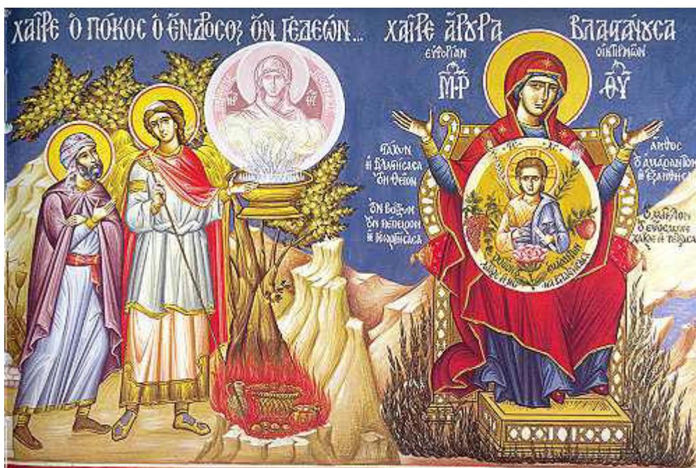
Χαῖρε, ἄρουρα βλαστάνουσα εὐφορίαν οἰκτιρμῶν...