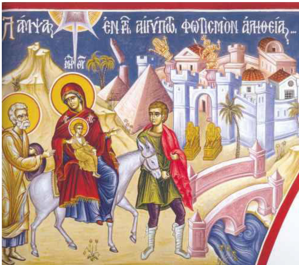
Λάμψας ἐν τῇ Αἰγύπτῳ, φωτισμὸν ἀληθείας ἐδίωξας....