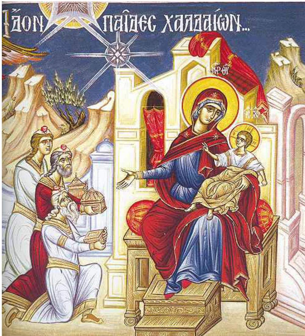
Ἴδον παῖδες Χαλδαίων....