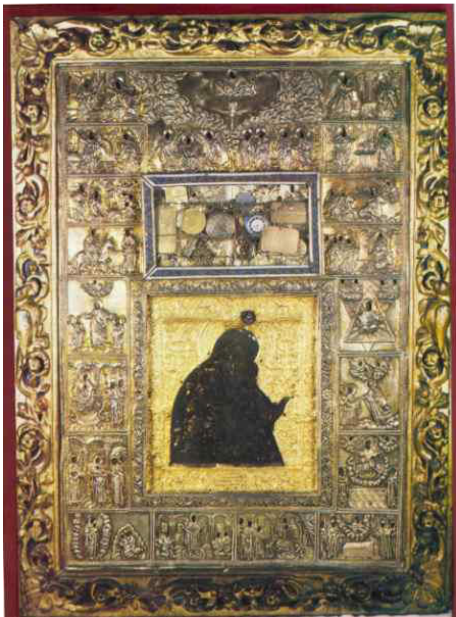
Ακάθιστος Ύμνος - Η εικόνα βρίσκεται στην Ι.Μ. Διονυσίου Αγίου Όρους