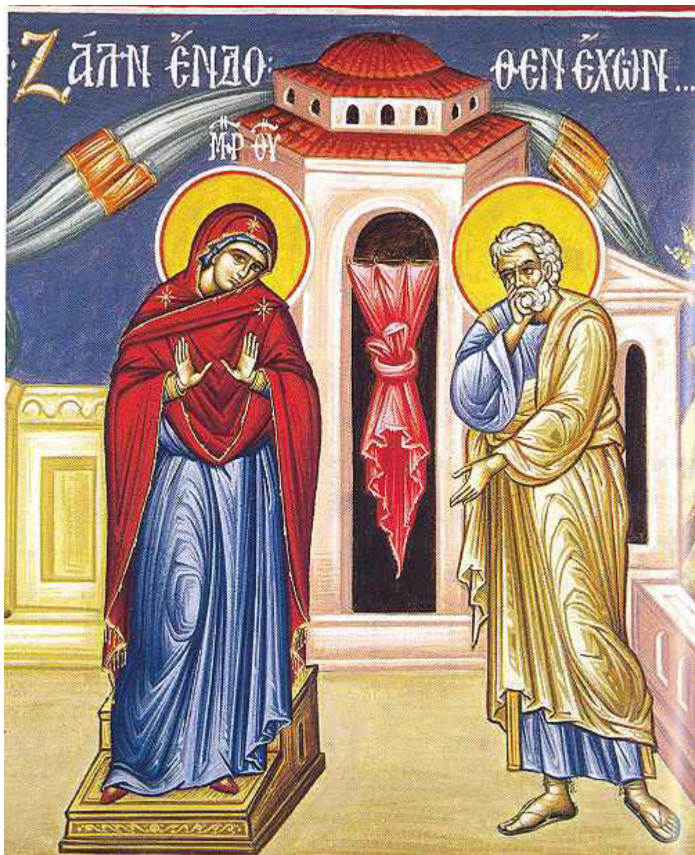
Ζάλην ἐνδοθεν ἔχων....