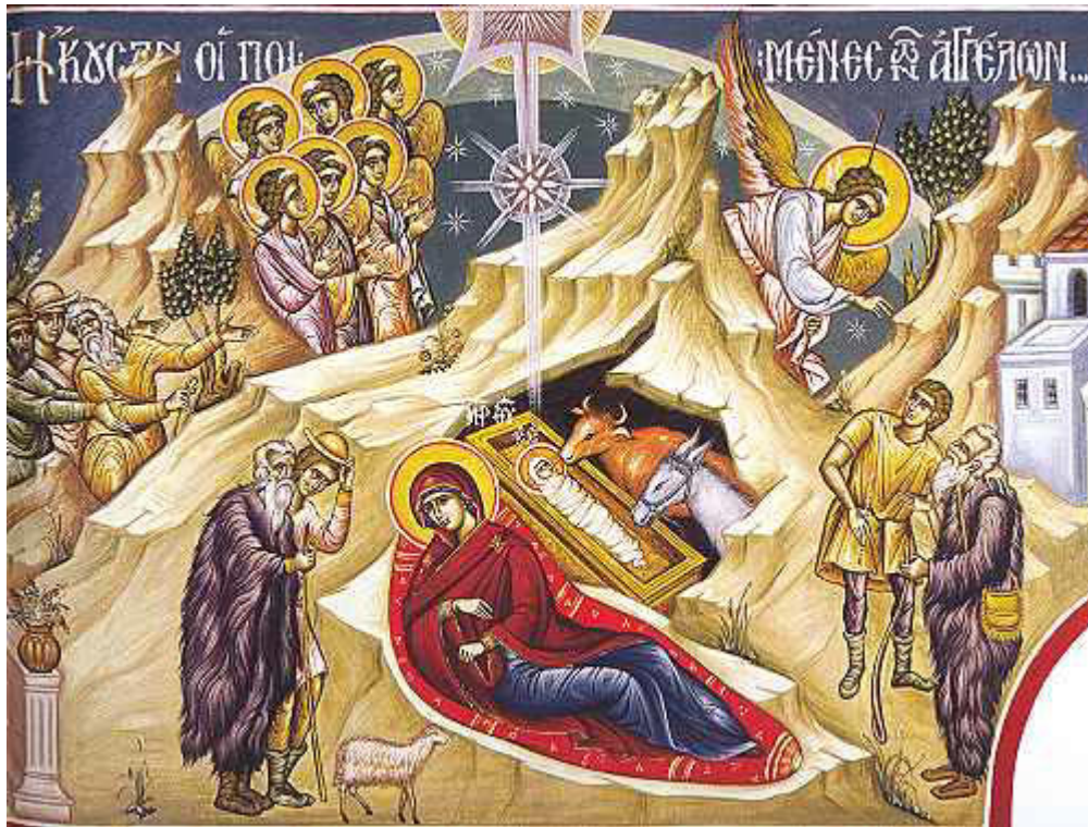
Ἦκουσαν οἱ ποιμένες, τῶν Ἀγγέλων ὑμνούντων...