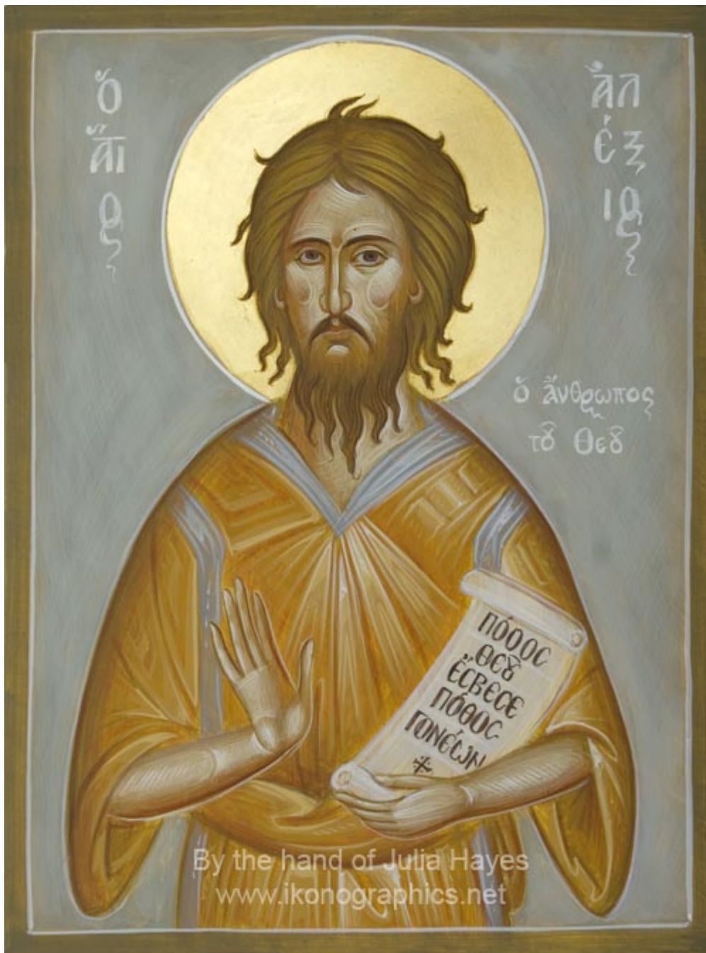
Ὁσιος Ἀλέξιος ὁ ἄνθρωπος τοῦ Θεοῦ - Julia Hayes© (www.ikonographics.net)