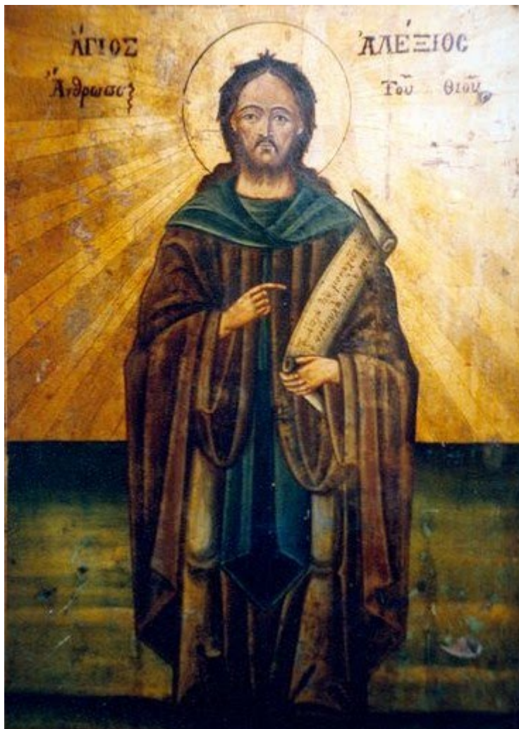
Όσιος Αλέξιος ο άνθρωπος του Θεού