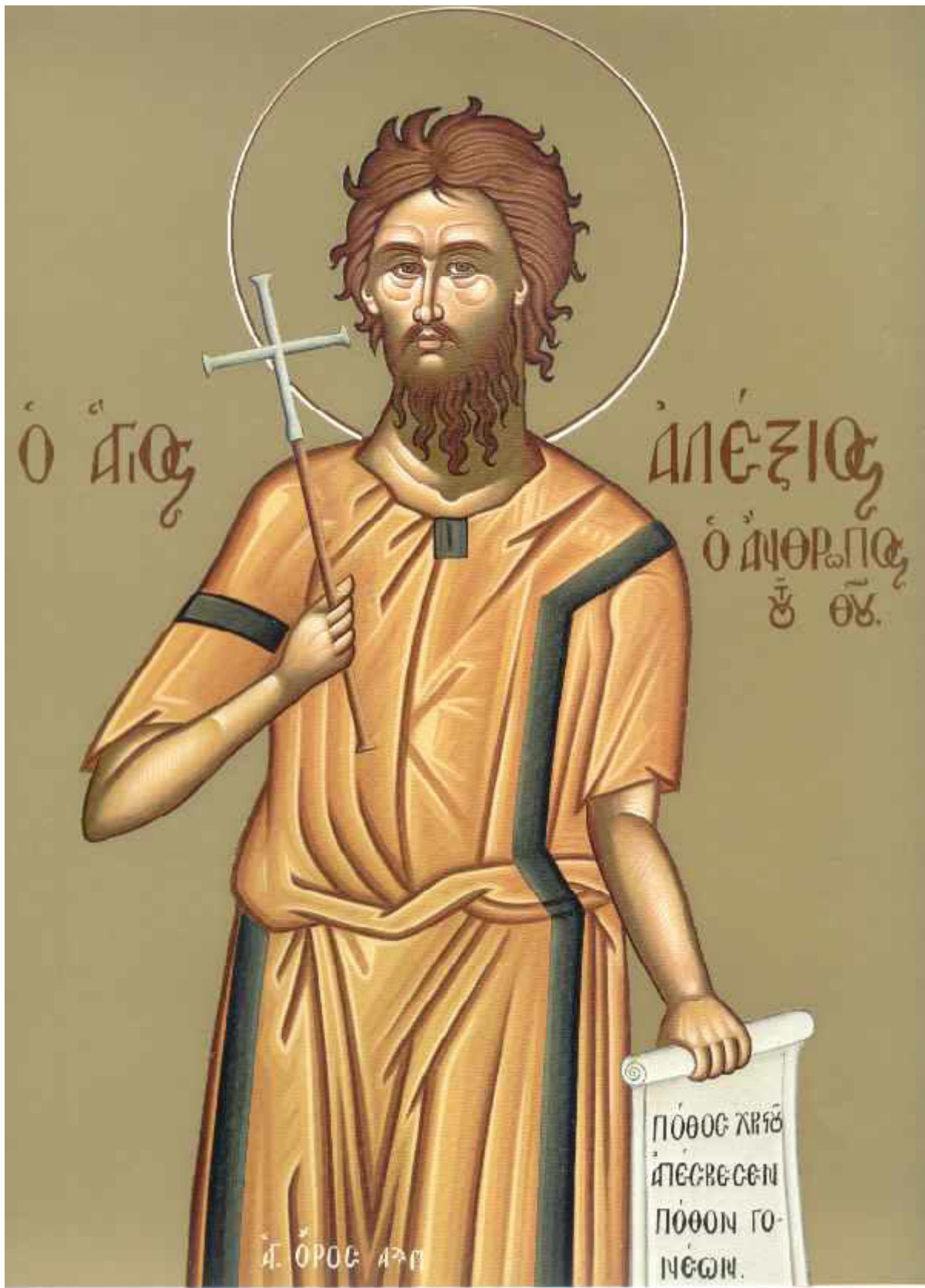
Όσιος Αλέξιος ο άνθρωπος του Θεού