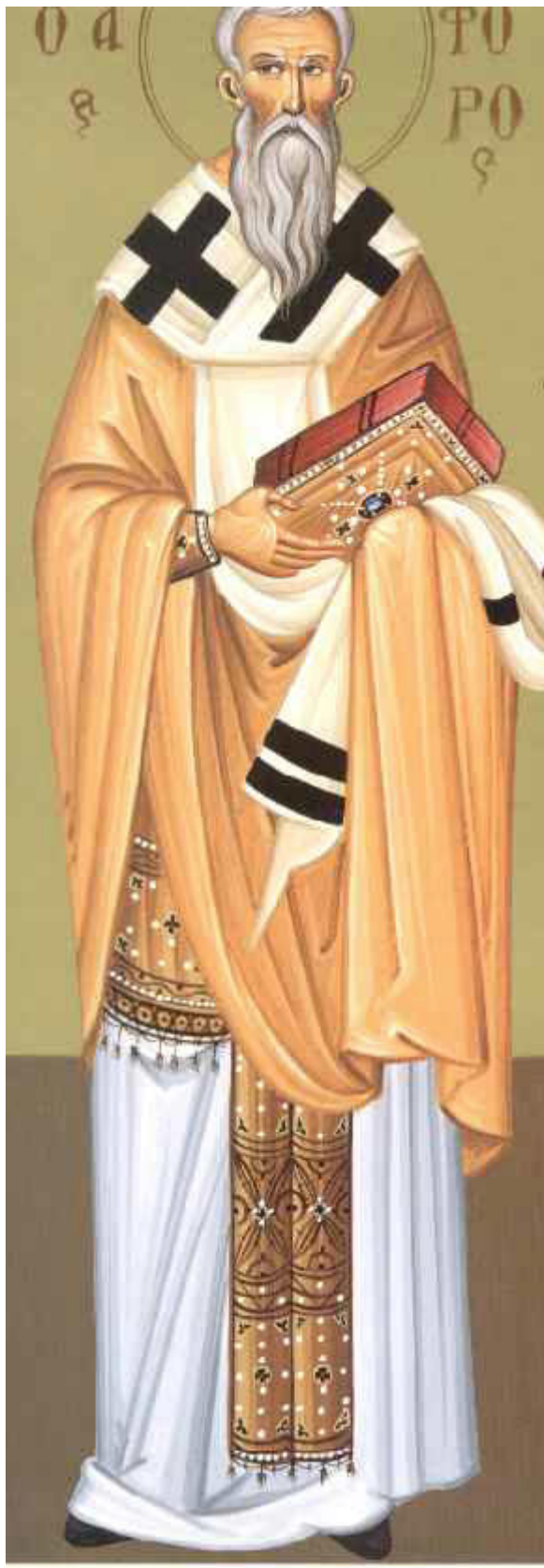
Άγιος Νικηφόρος ο Ομολογητής, Πατριάρχης Κωνσταντινουπόλεως