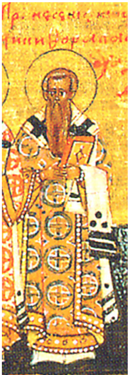
Άγιος Νικηφόρος ο Ομολογητής, Πατριάρχης Κωνσταντινουπόλεως