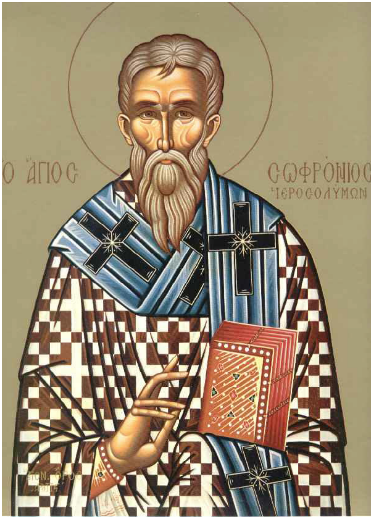
Άγιος Σωφρόνιος Πατριάρχης Ιεροσολύμων