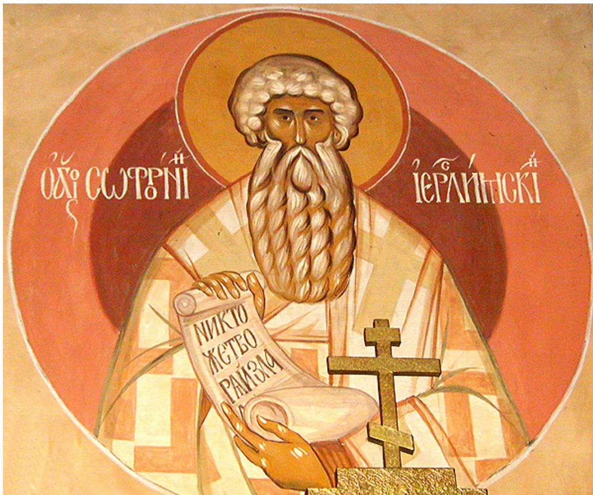
Άγιος Σωφρόνιος Πατριάρχης Ιεροσολύμων