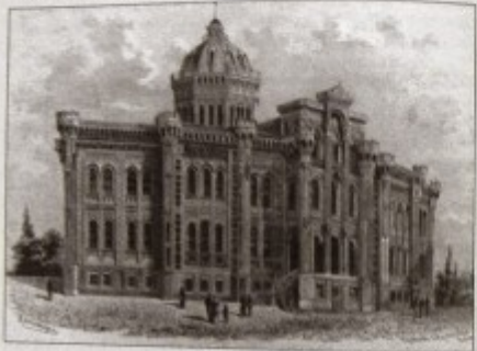
Σ. Η Μεγάλη τά Γένους Σχολή.

δοσ και την ιστορία της πατρίδας των, όστε να αίσθάνονται ζυγα- νό την άντλησ και την έβάρησι τους άπ' τις όλεις των προγόνων τους και να τους κόνουν να έχουν πάντοτε άνομμένη, σαν λαμπάδα άνο- μητή στην έσοδική, την έλπίδα του νό και την καρδιά τους για την άνάστασ του Γένους.