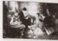
30. Το κρυφό σχολείο (Ν. Γαζής).

«Αυτό πάντως ήταν το άνεκμητο έργο των καλογέρων, των παιδιών και των μοναχικών. Αυτό εν τελευταία άναλύσει ήταν το όντως Κρυφού Σχολείου σε κάθε χωριό και σε κάθε γωνιά της σκλαβιμένης πατρίδος μας επί περικοκία τόσο χρόνια, που οι νεοέλληνες το γνωρίζουν διατηγός μόνο... ρωμαϊκής και, φοδοθμία, μόνο έπ' το ποιημάτων του μικρού παιδιού, που, όπως νομίζουν οι περισσότεροι, παρακάλει να είναι πάντοτε έσπαστά, για να φέγγη καλά το δρόμο του το φεγγαράκι, ώστε άποκρίεται προς το σχολείο να περιπατή.