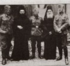
37. Γαμινιακή σπαρησία κατά τήν κατοχή (1941).

-Γέροντα, όρολογορη πως, άσα μας έβίβατε, μας ένδοσίσων. Δέν μας τα δίδαξον έτα οι φιλόλογοι, αλλά σότε και τα δσηθησά Ιστορικά μας δούδα άνοφρόρητα σε τέτοιες πτυχές, γι' αυτό και σός είνερωσιστομη για μά άκόμη φορά. Μά άσοα, που σός πρώτος άνω-σάσινα τήν προσοχή μας άπ' τις παρκαίσιες της Ιστορίας του 'Αγί-ου Όρος σκίλλες και ήλβατε στα νεώτερα γεγονάτα, σός παρησ-λομέ θερηά να μας σήε κέποια έπαρηρία σος ένέπικος προσηπική, που σπαζέτα με τήν γαμινιακή κατοχή της κηρίας μας και του 'Αγίου Όρος φουκό. Και για να γίνωμε πιο φανερο, σός λέμε έτα,