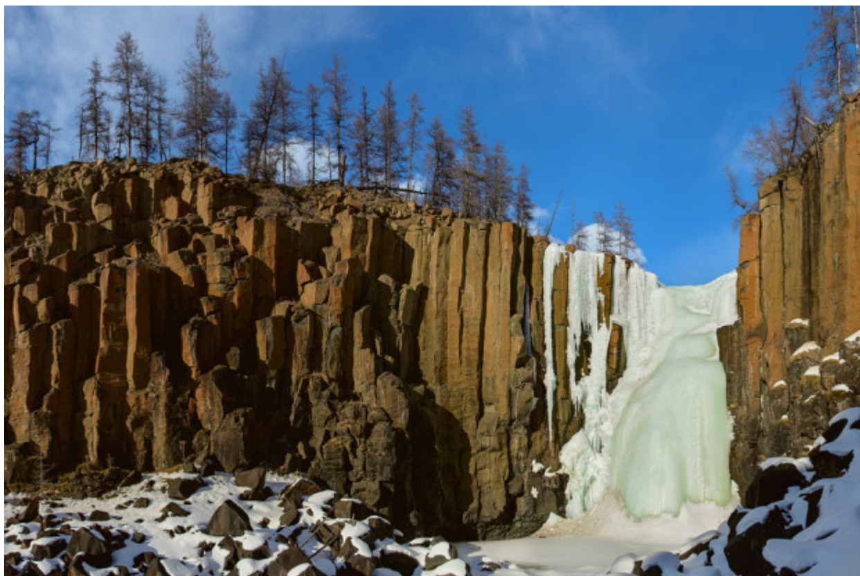
Εδώ βρίσκεται ο υψηλότερος καταρράκτης της Ρωσίας, άγρια ποτάμια μαγευτικής ομορφιάς και απότομα βραχώδη όρη.