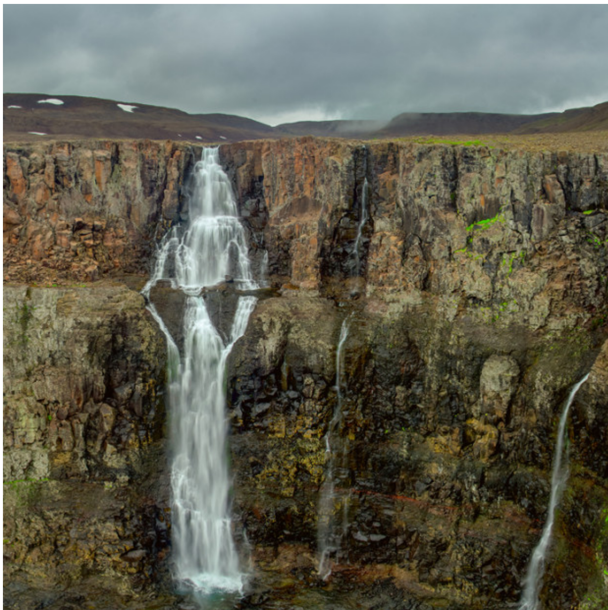
Οι καταρράκτες του Οροπεδίου Πουτοράνα.