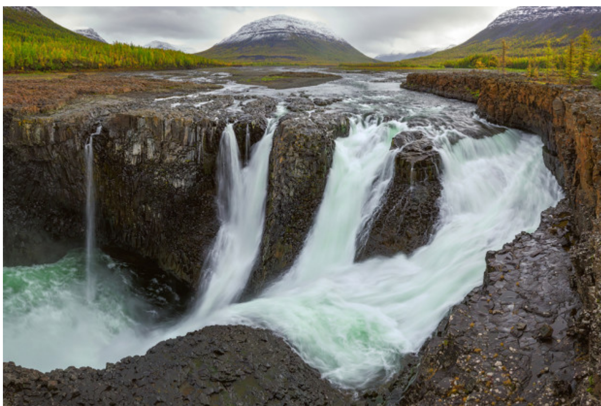
Οι καταρράκτες του Οροπεδίου Πουτοράνα.