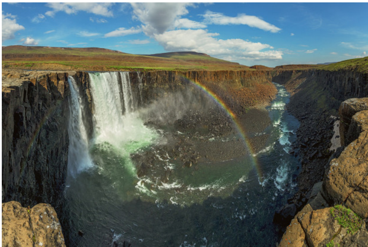
Οι καταρράκτες του Οροπεδίου Πουτοράνα.