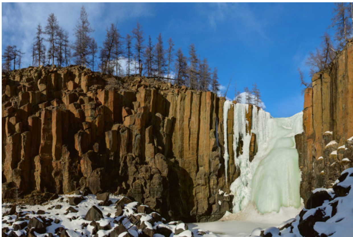
Εδώ βρίσκεται ο υψηλότερος καταρράκτης της Ρωσίας, άγρια ποτάμια μαγευτικής ομορφιάς και απότομα βραχώδη όρη.