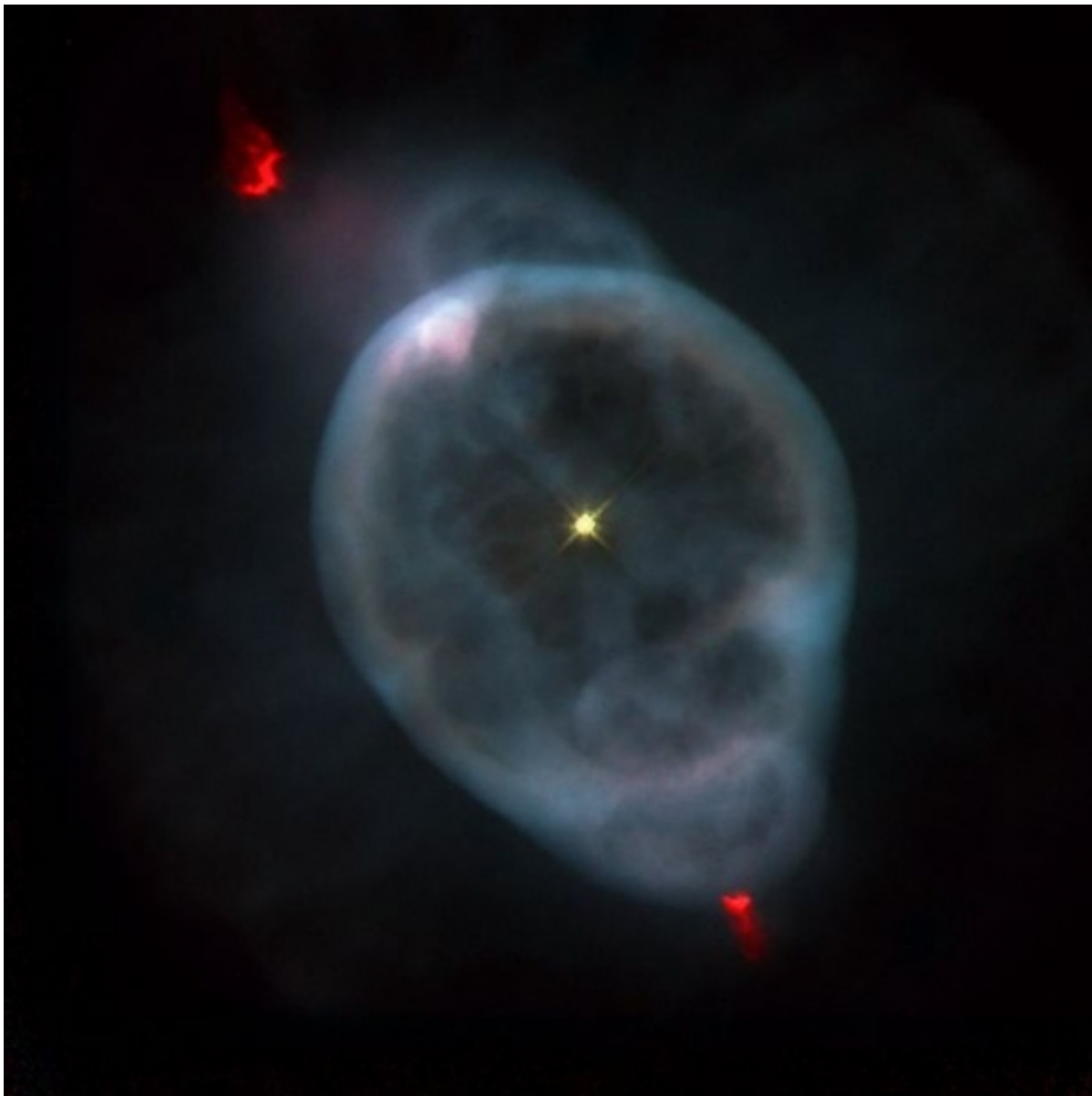
Το νεφέλωμα NGC 3242 μας δείχνει τον Ηλιο μετά από επτά δισ. έτη

Δόθηκε στη δημοσιότητα μια νέα εικόνα του νεφελώματος NGC 3242, ένα νεφέλωμα που βρίσκεται σε απόσταση τριών χιλιάδων ετών φωτός από εμάς στον αστερισμό της Υδρας. Το νεφέλωμα καλύπτει τον ίδιο χώρο με αυτόν που καλύπτει ο Δίας για αυτό οι επιστήμονες του έχουν ονομάσει «Το φάντασμα του Δία». Το νεφέλωμα αποτελεί συχνό στόχο παρατήρησης των αστρονόμων επειδή αποτελεί υπόλειμμα ενός άστρου σαν τον Ηλιο και έτσι βλέπουν την εξέλιξη που θα έχει το μητρικό μας άστρο όταν μετά από περίπου επτά δισ. έτη θα έχει καταναλώσει τα καύσιμα του.