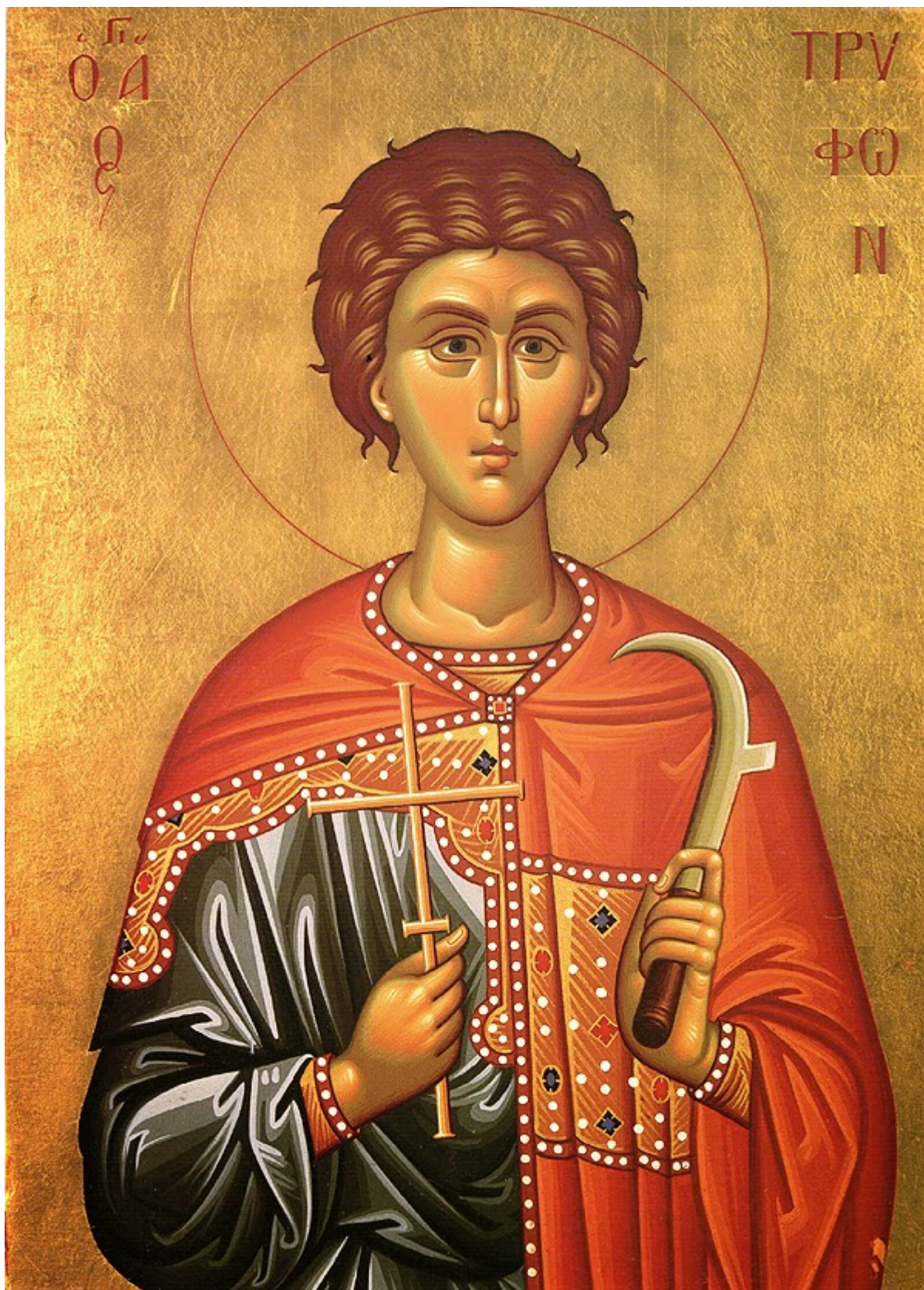
Άγιος Τρύφων ο Μάρτυρας