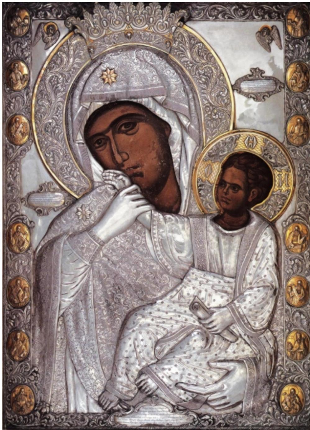
Η θαυματουργός εικόνα της Παναγίας της Παραμυθίας

Σήμερα 21 Ιανουαρίου εορτάζεται η Σύναξις της Παναγίας της Παραμυθίας και η μνήμη των Αγίων Μαξίμου του νέου Ομολογητού του Βατοπαιδινού του επιλεγμένου Γραϊκού του φωτιστού της Ρωσίας (για να διαβάσετε το σχετικό άρθρο πατήστε εδώ ) και Νεοφύτου του Προσμοναρίου της Παραμυθίας του Βατοπαιδινού.