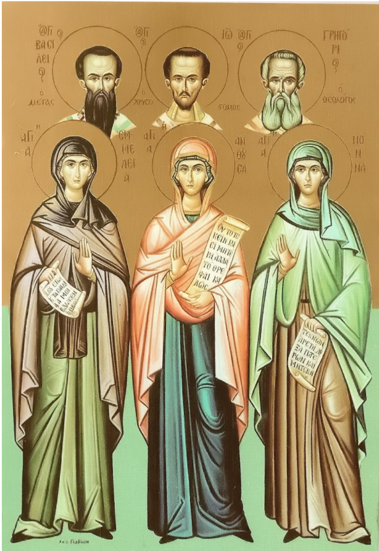
Αγίες Εμμελεία, Νόννα και Ανθούσα, οι μητέρες των Τριών Ιεραρχών