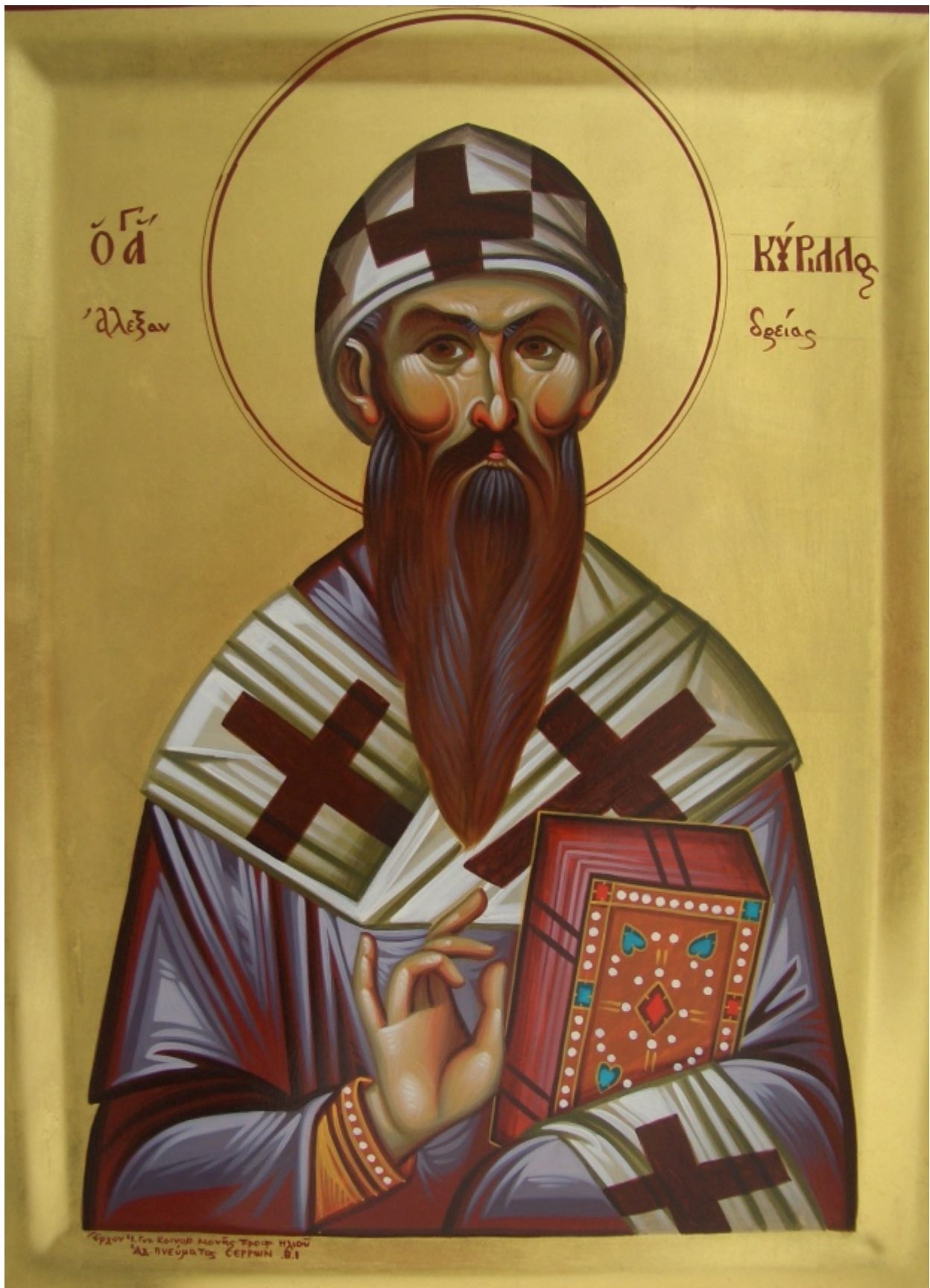
Ἅγιος Κύριλλος Πατριάρχης Ἀλεξανδρείας (Ι.Μ. Προφ. Ἡλίου Σερρών)