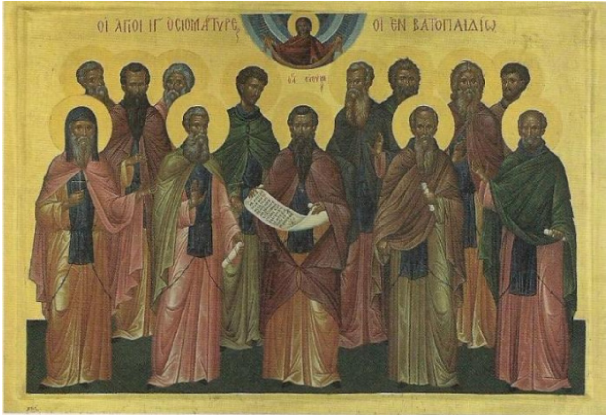
Οί 13 Όσιομάτρες Βατοπεδινοί. Σύγχρονη φορητή εικόνα Γ. Μ. Βατοπεδίου.

Ορθοδοξία και Ορθοπραξία / Συναξαριακές Μορφές