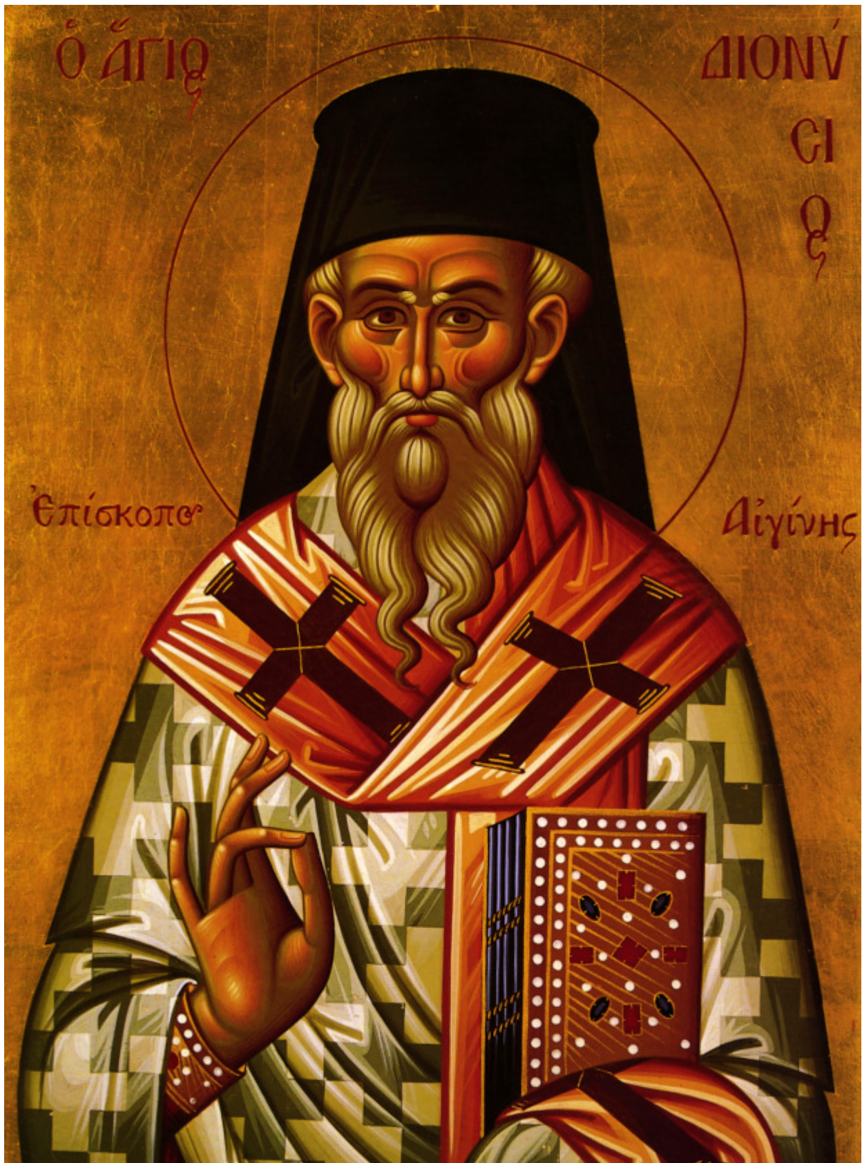
Άγιος Διονύσιος ο Νέος, ο Ζακυνθινός Αρχιεπίσκοπος Αιγίνης

Εορτάζει στις 17 Δεκεμβρίου εκάστου έτους.