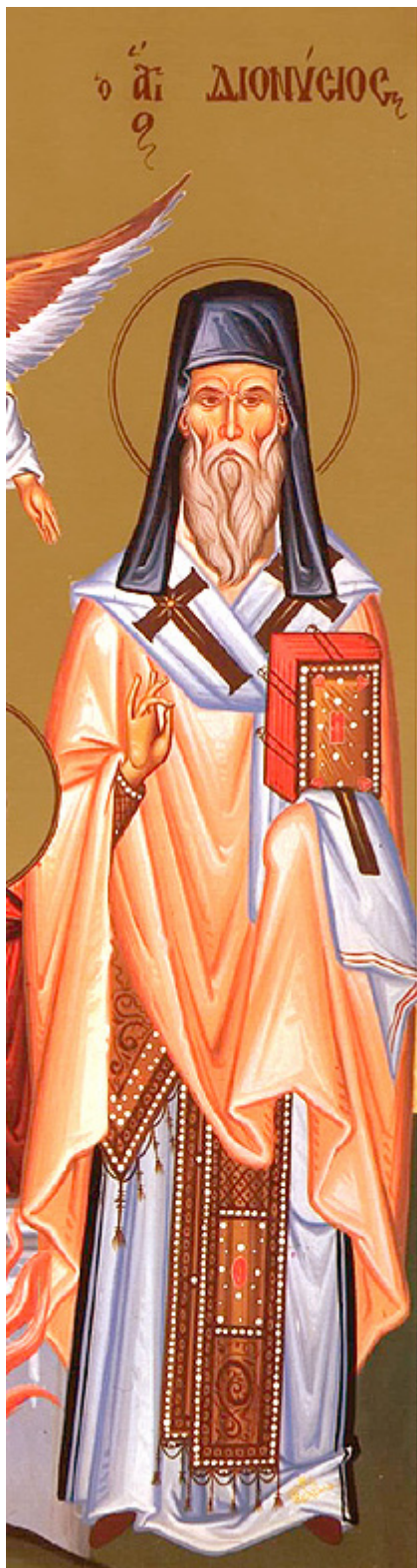
Άγιος Διονύσιος ο Νέος, ο Ζακυνθινός Αρχιεπίσκοπος Αιγίνης