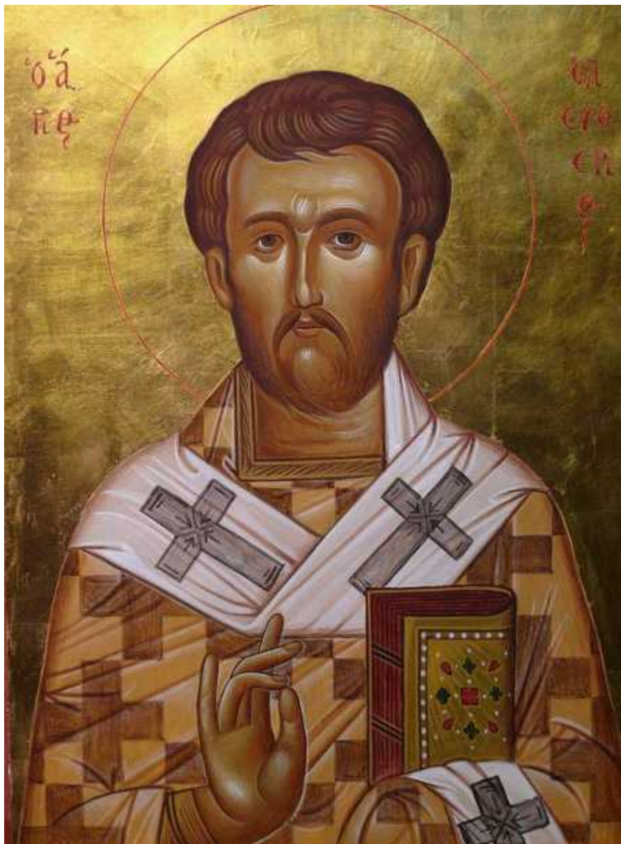
Άγιος Ελευθέριος ο Ιερομάρτυρας - Αυγοτέμπερα επί ξύλου - Βρίσκεται στο Ίδρυμα του Ευαγγελιστού Μάρκου στην Θέρμη Θεσσαλονίκης - Γιώργος Χατζής© ( hatzis-art.blogspot.com )

Εορτάζει στις 15 Δεκεμβρίου εκάστου έτους.