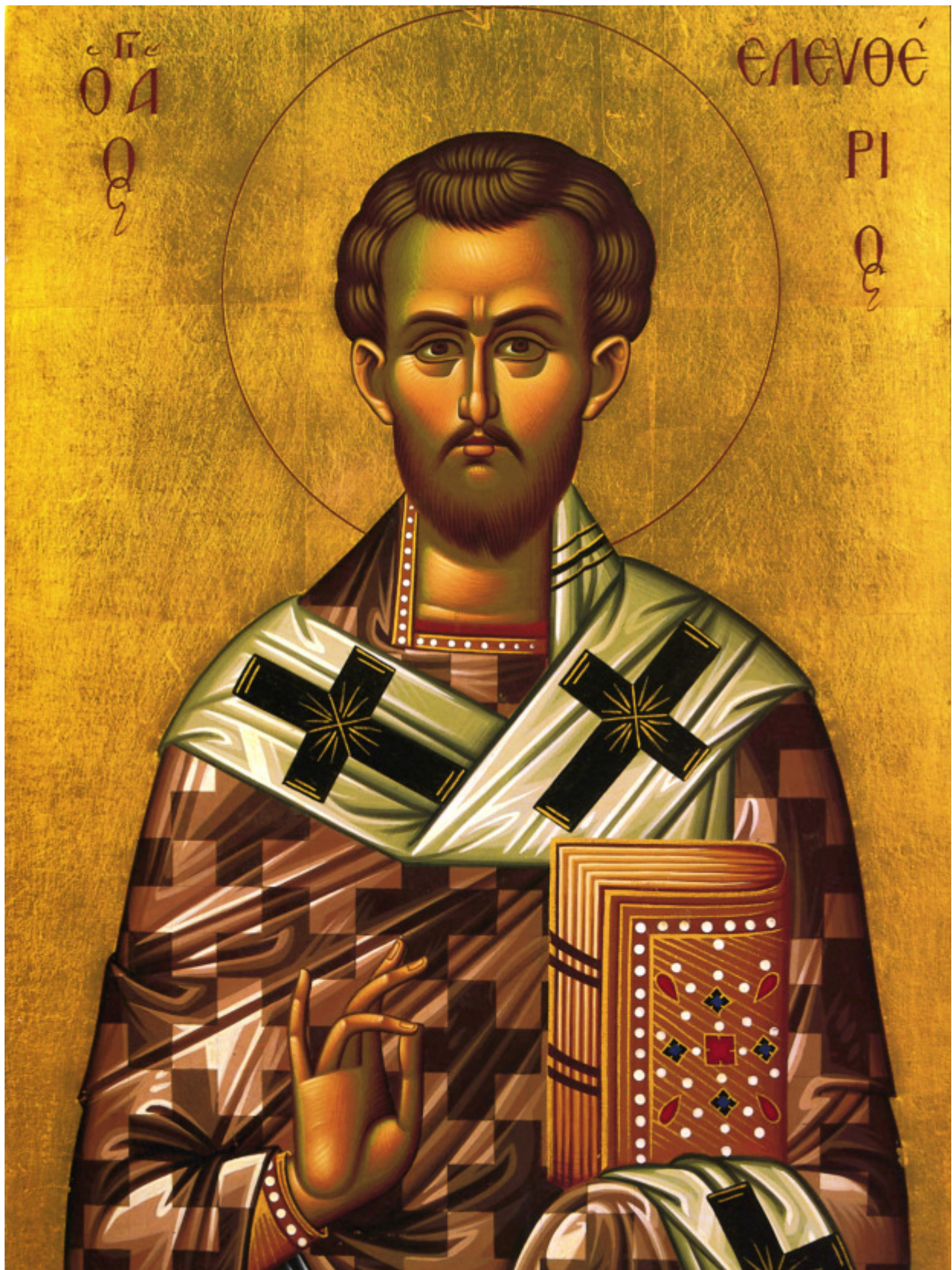
Άγιος Ελευθέριος ο Ιερομάρτυρας