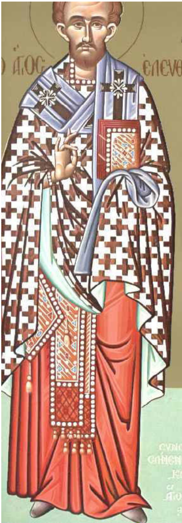
Άγιος Ελευθέριος ο Ιερομάρτυρας