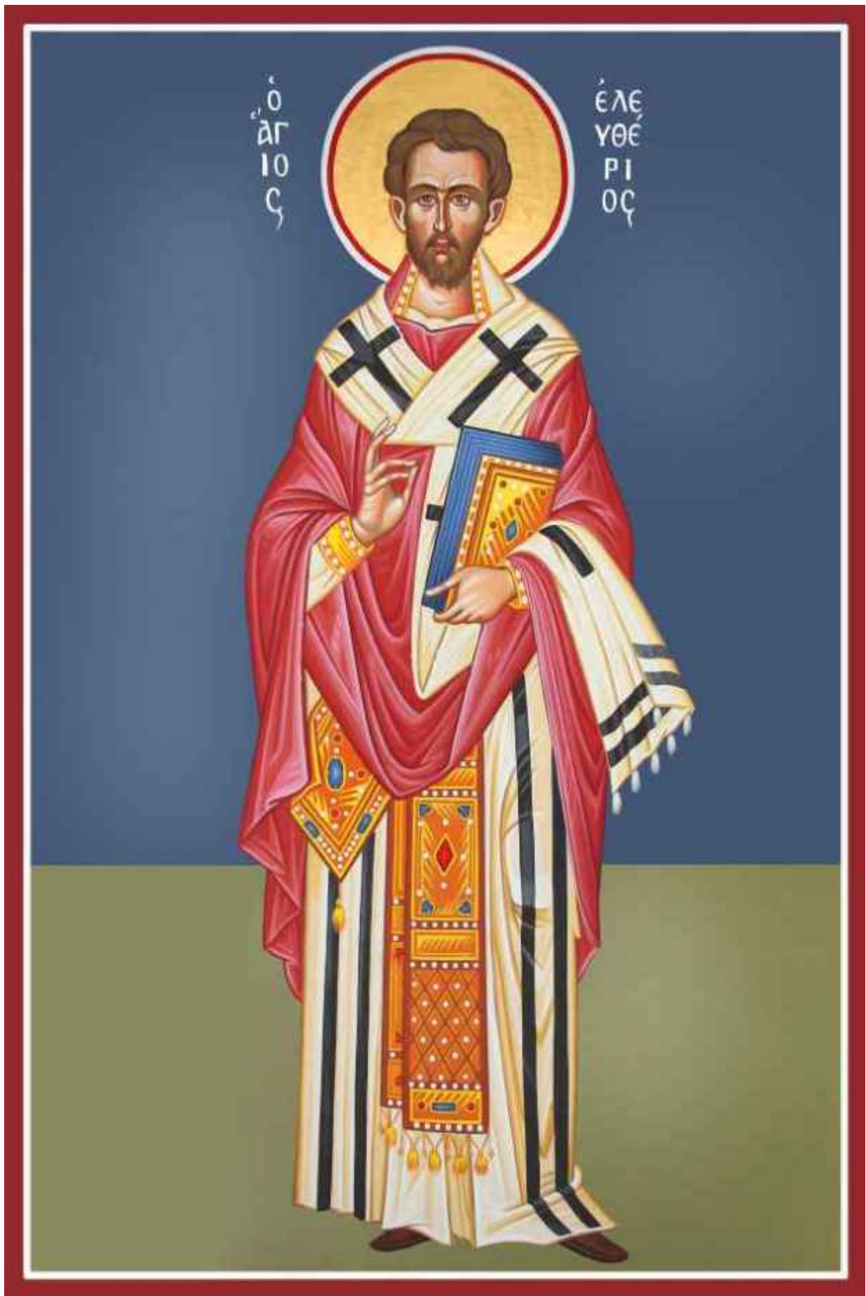
Άγιος Ελευθέριος ο Ιερομάρτυρας - Καζακίδου Μαρία© (byzantineartkazakidou.blogspot.com)