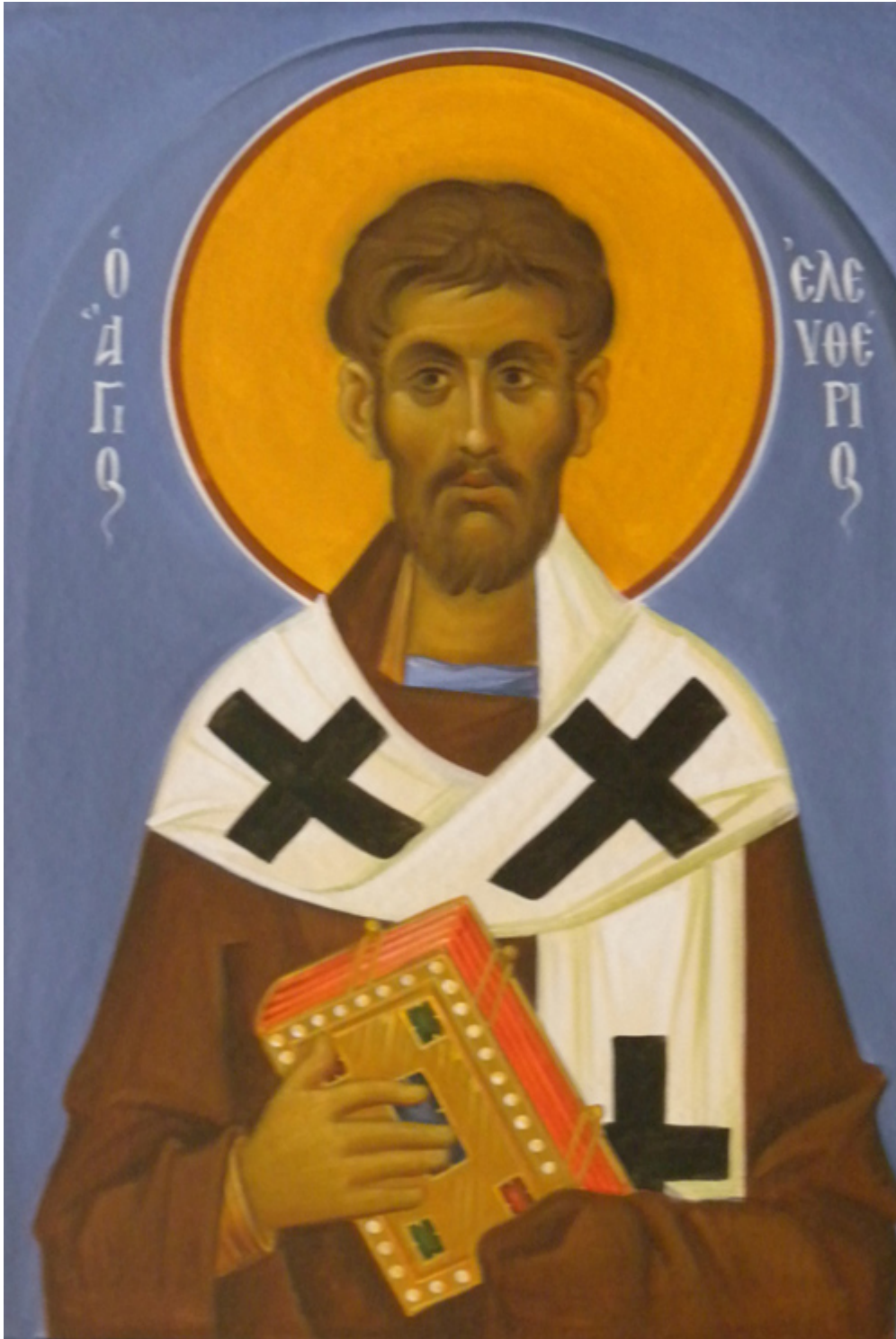
Άγιος Ελευθέριος ο Ιερομάρτυρας - Ι. Ν. Οσίων Παρθενίου και Ευμενίου των εν Κουδουμά, δια χειρός Παναγιώτη Μόσχου (2006 μ.Χ.)