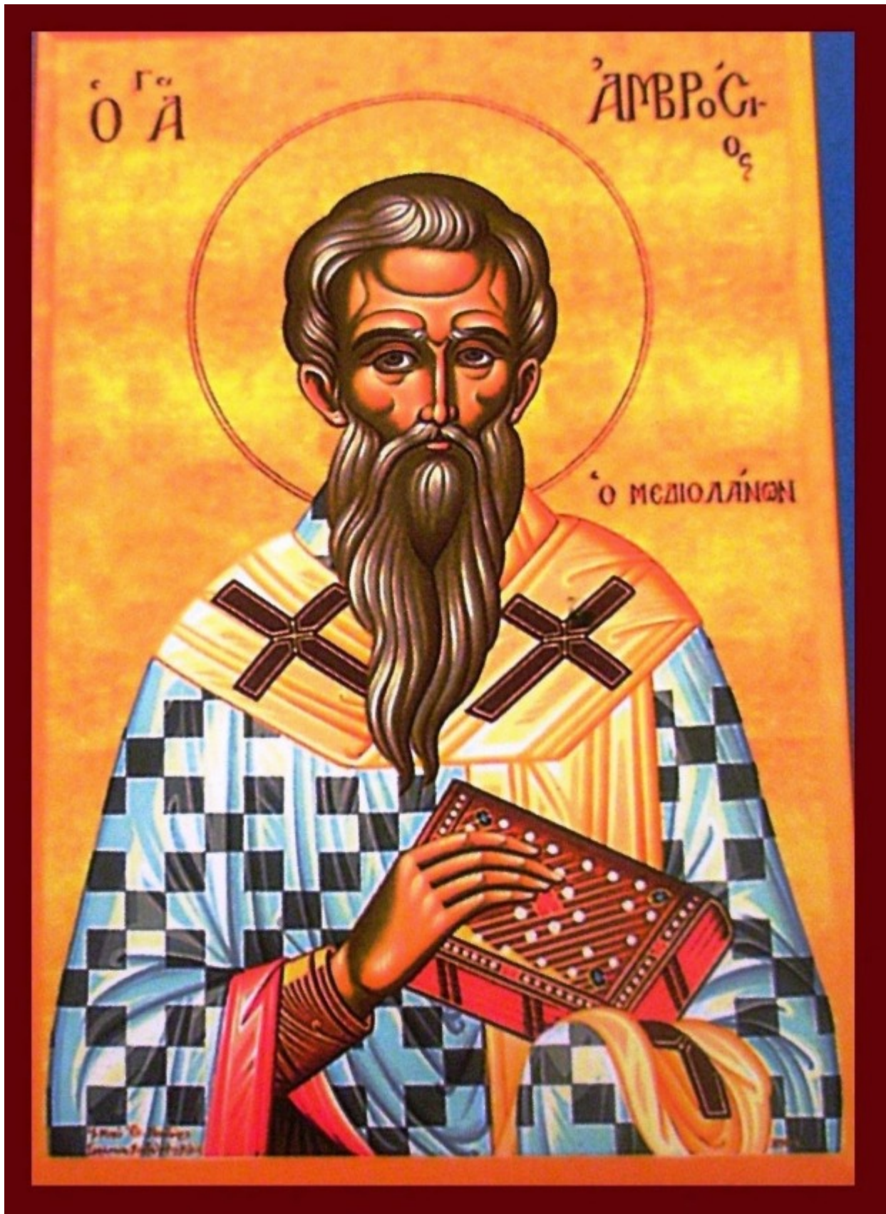
Άγιος Αμβρόσιος Μεδιολάνων

Ο Άγιος Αμβρόσιος γεννήθηκε το 440 μ.Χ. στη μεγάλη πόλη της Ιταλίας, τα Μεδιόλανα. Το σημερινό Μιλάνο. Γεννήθηκε από γονείς ευσεβείς και πολύ ευγενείς. Όταν δε ο Αμβρόσιος έφθασε σε νόμιμη ηλικία, γνώριζε πολλές επιστήμες περισσότερο όμως επιδόθηκε στη ρητορική. Όλοι τον θαύμαζαν, γιατί έμαθε σε