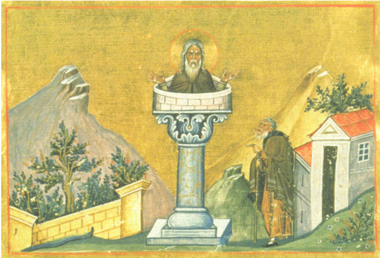
Όσιος Δανιήλ ο Στυλίτης

Εορτάζει στις 11 Δεκεμβρίου εκάστου έτους.