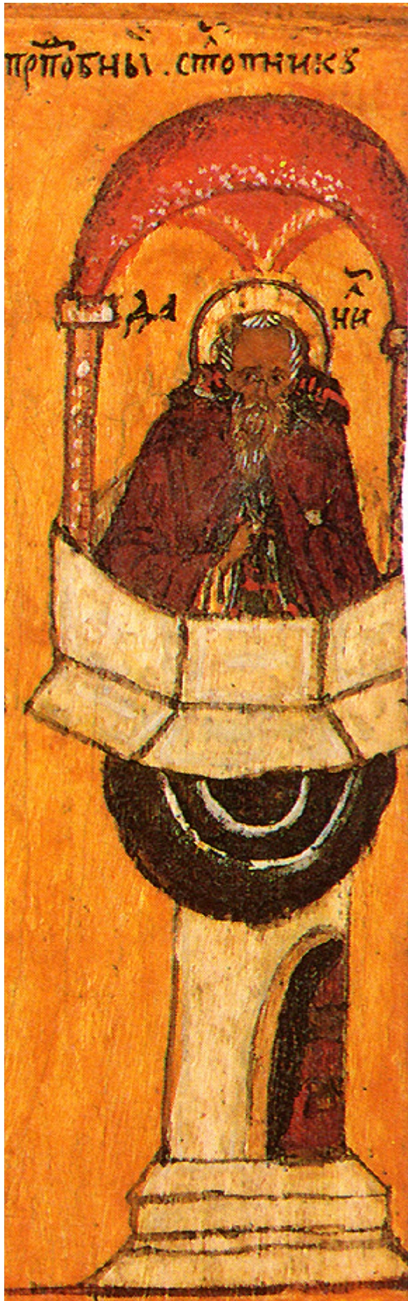
Όσιος Δανιήλ ο Στυλίτης