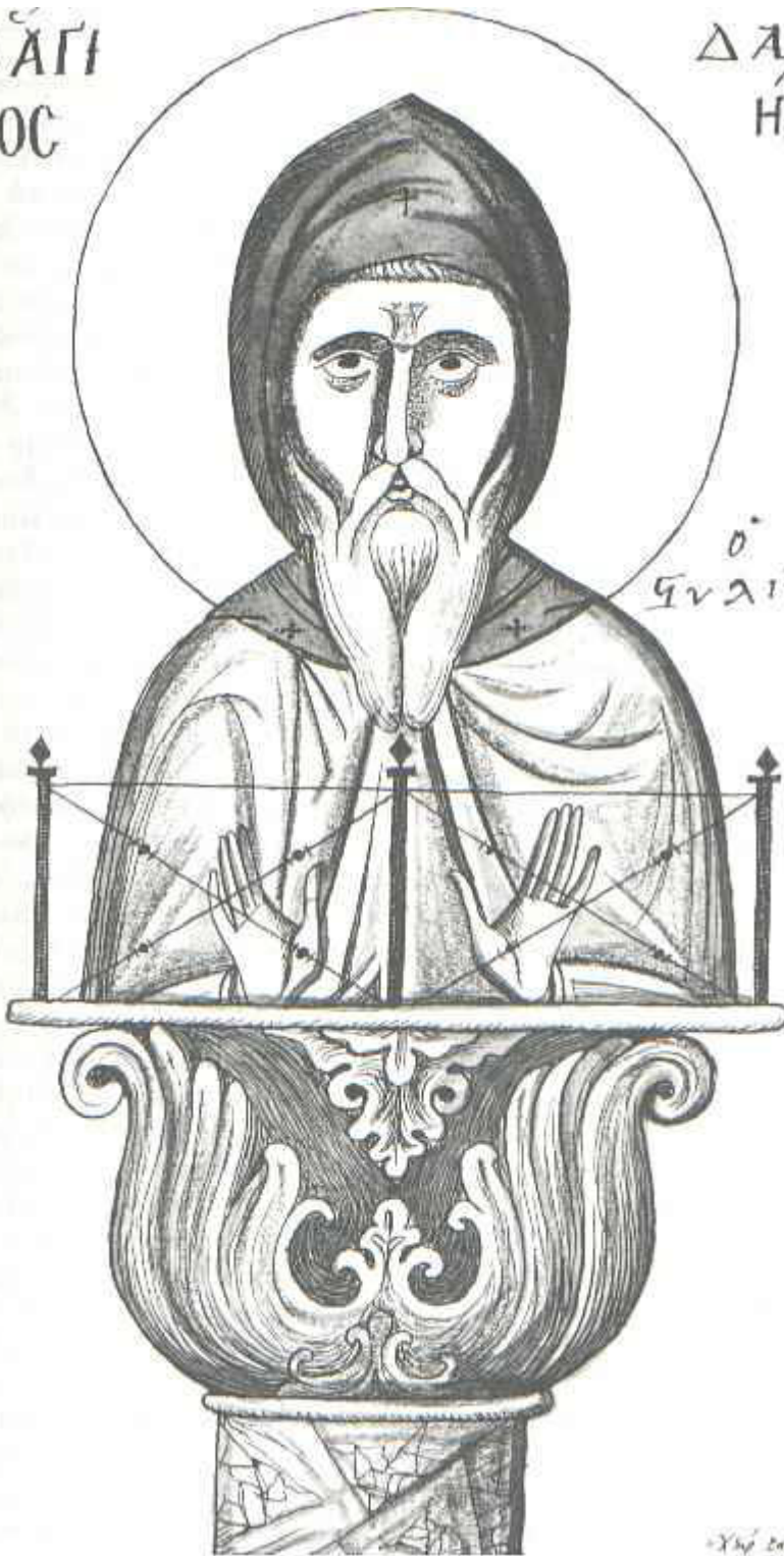
Όσιος Δανιήλ ο Στυλίτης