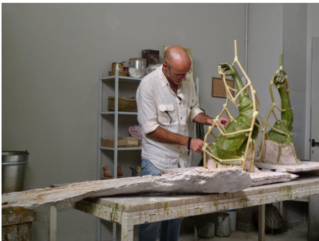
Οι τελικές λεπτομέρειες στο κερύ και οι αγωγοί χύτευσης