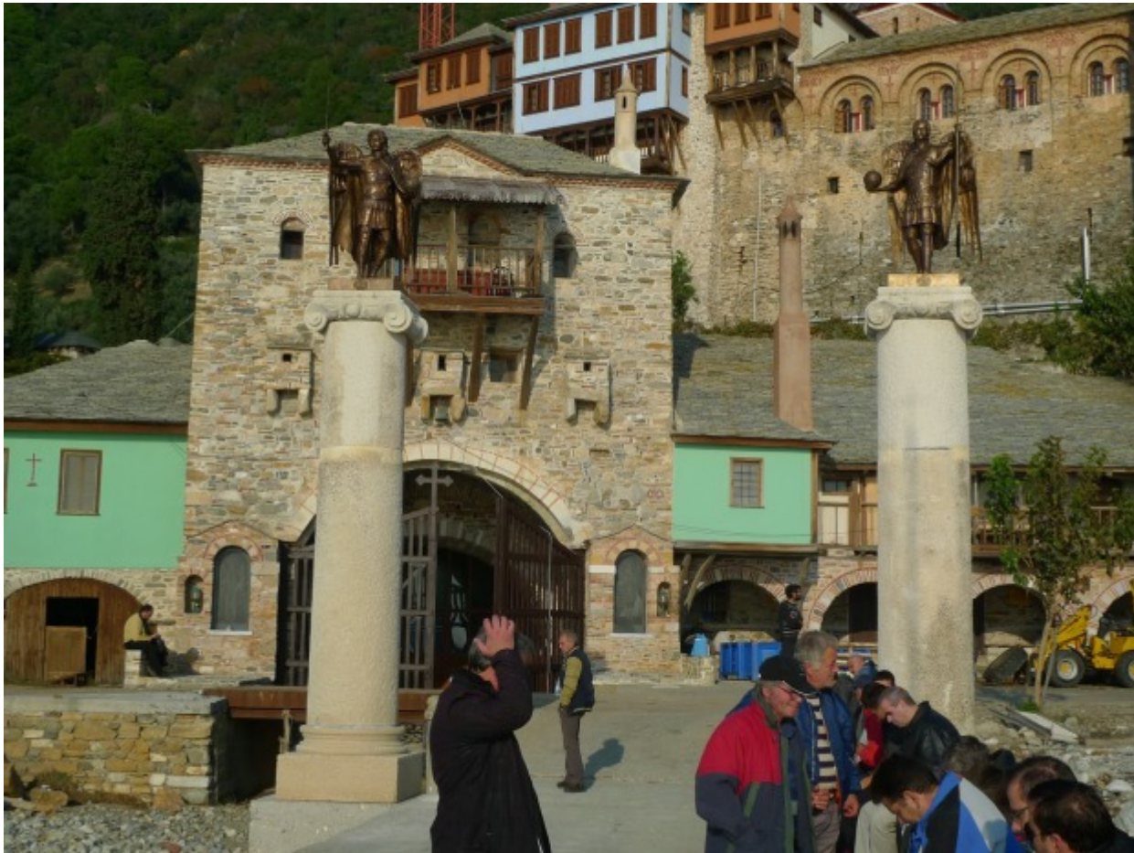
Οι Φύλακες του Άβατου στην Ιερά Μονή Δοχειαρίου

Με τις ευλογίες του πολυαγαπημένου μου Γέροντα Γρηγορίου, καθηγουμένου της Ιεράς Μονής Δοχειαρίου Αγίου Όρους, τους τελευταίους οκτώ μήνες, έφτιαχνα δύο Αρχαγγέλους για το μοναστήρι.