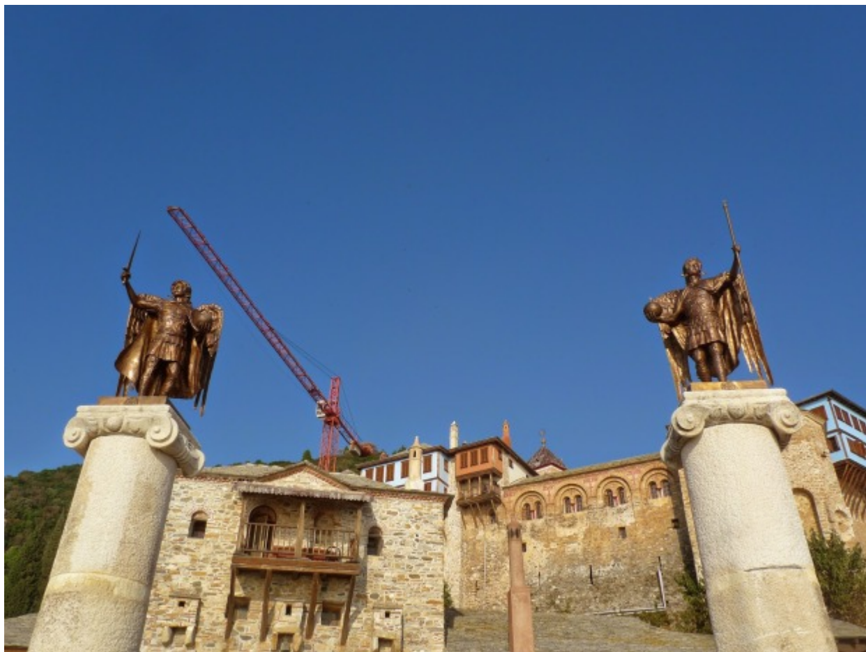
Αρχάγγελοι στην Ιερά Μονή Δοχειαρίου

Βέβαιο είναι πάντως ότι είμαι αναρμόδιος για να γράψω πνευματικά κείμενα και τώρα δεν νιώθω ότι μπορώ ν'αναλύσω αυτά τα έργα περισσότερο.