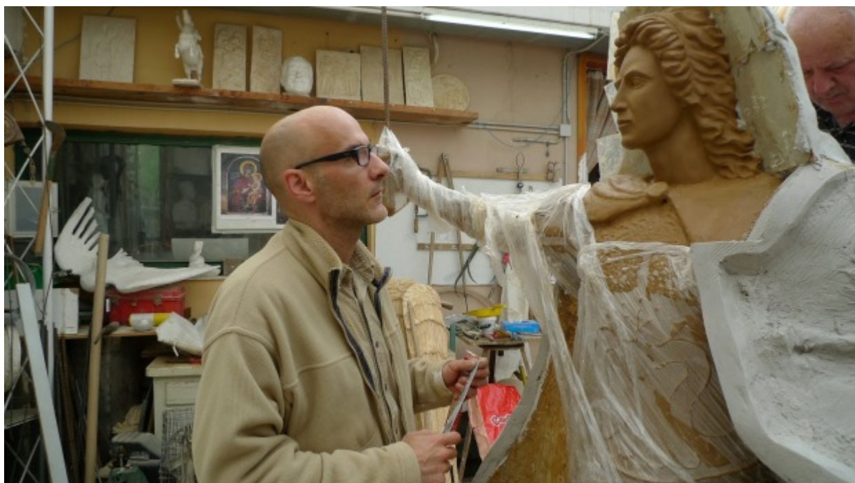
Καλούπια του Αρχαγγέλου