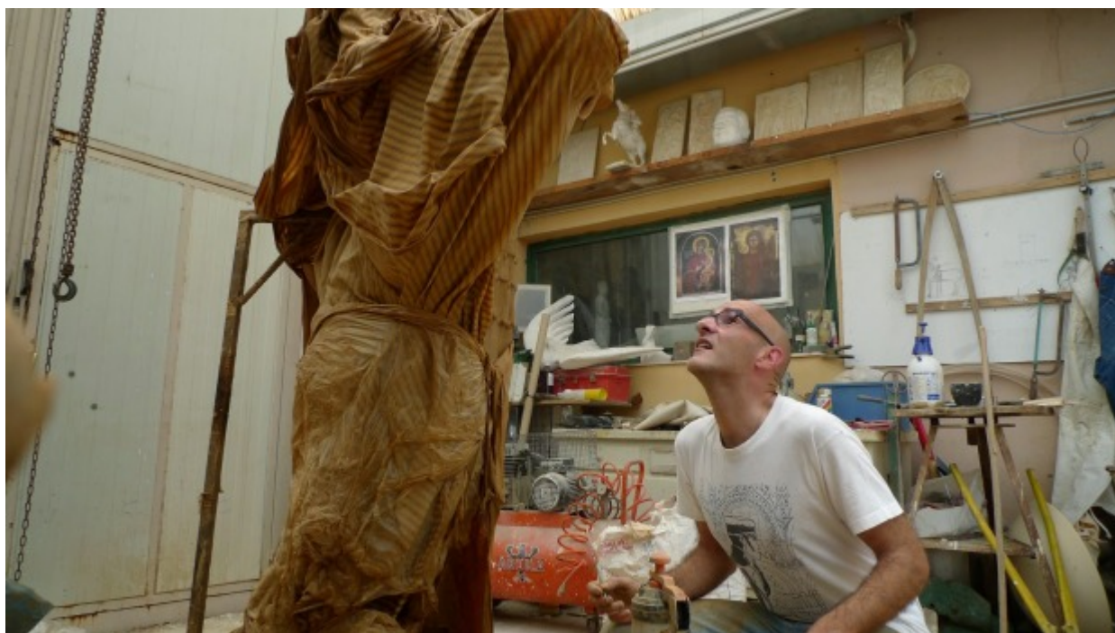
Μπροστά στο πρόπλασμα του έργου

Το έργο χυτεύτηκε και ολοκληρώθηκε την 25.10.2014.