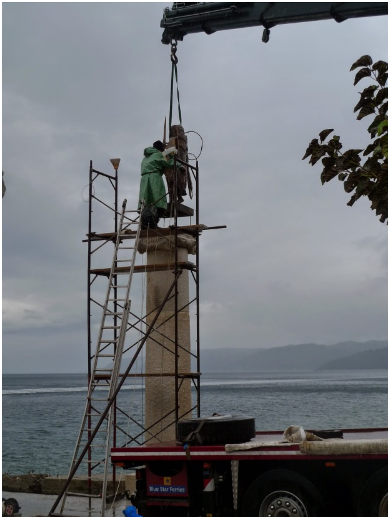
Τοποθέτηση του έργου από τον Γιάννη Μπάρδη

Την Κυριακή 2.11.2014 έγινε δοξολογία και αγιασμός.