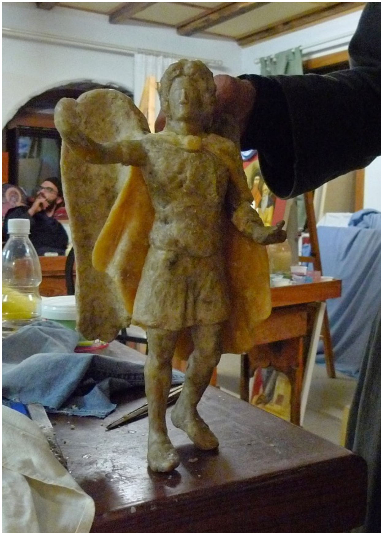
Η μακέτα στο αγιογραφείο της Μονής

Η μακέτα του έργου έγινε στο αγιογραφείο της Μονής το Φεβρουάριο του 2014.