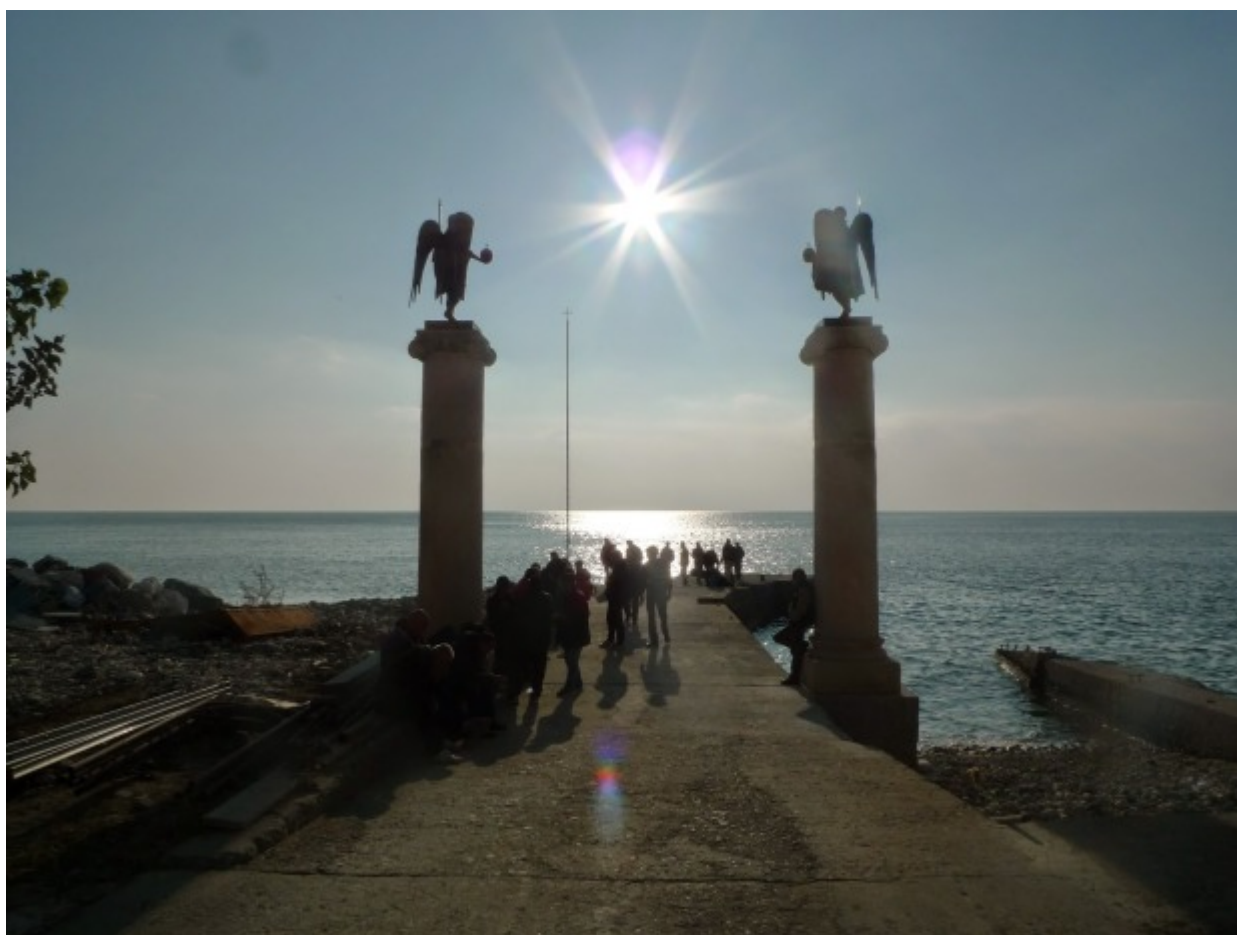
Αρχάγγελοι στην Ιερά Μονή Δοχειαρίου

Δυστυχώς όμως, δεν μπορώ ν' απεικονίσω αυτά που 'ζησα στο λόγο, τα 'νωθα όμως σαν την μετάνοιά μου, να παίρνει μορφή στην ύλη.