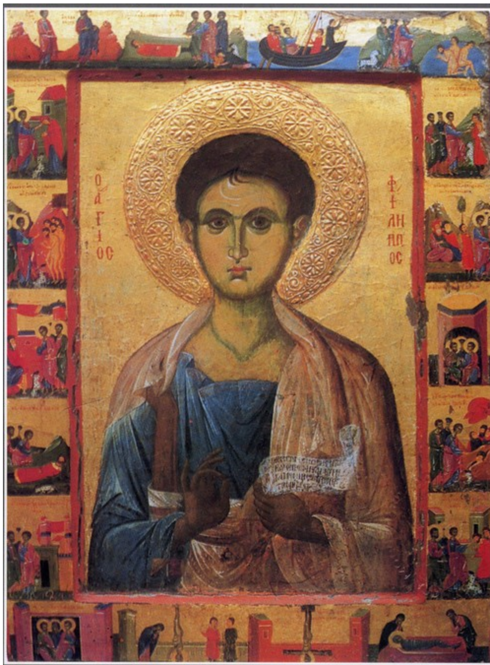
Άγιος Φίλιππος ο Απόστολος