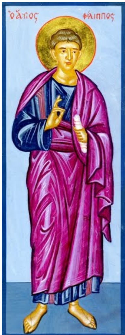
Άγιος Φίλιππος ο Απόστολος