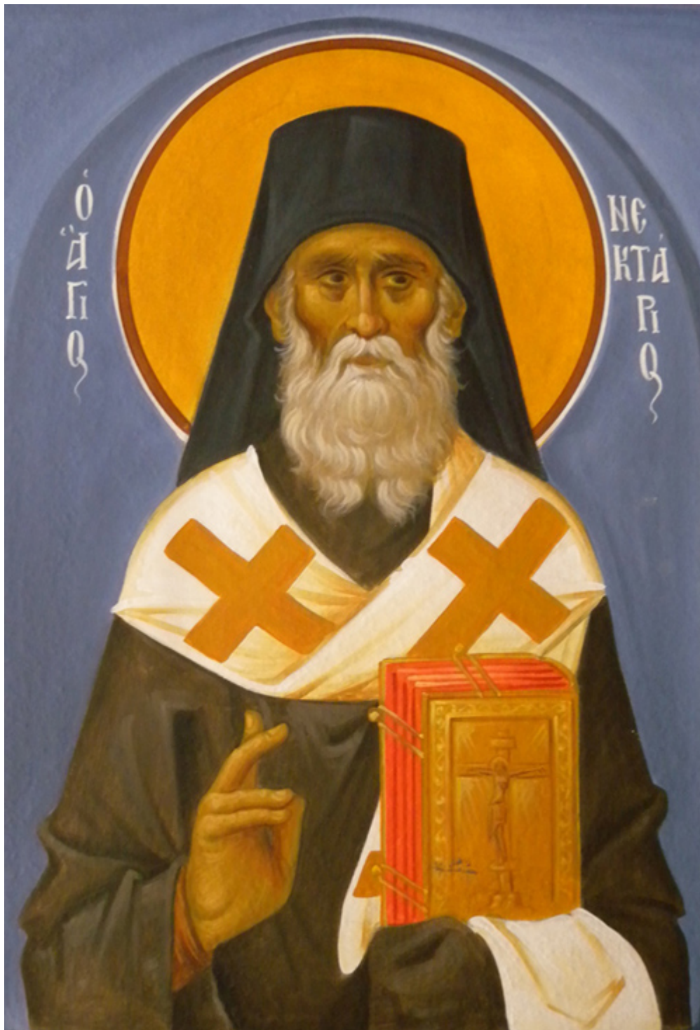
Άγιος Νεκτάριος Μητροπολίτης Πενταπόλεως Αιγύπτου - Ι. Ν. Οσίων Παρθενίου και Ευμενίου των εν Κουδουμά, δια χειρός Παναγιώτη Μόσχου (2006 μ.Χ.)