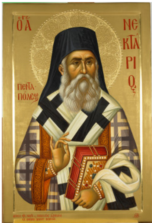
Άγιος Νεκτάριος Μητροπολίτης Πενταπόλεως Αιγύπτου - Εικόνα από το Αγιογραφείο της Μονής Βατοπαιδίου