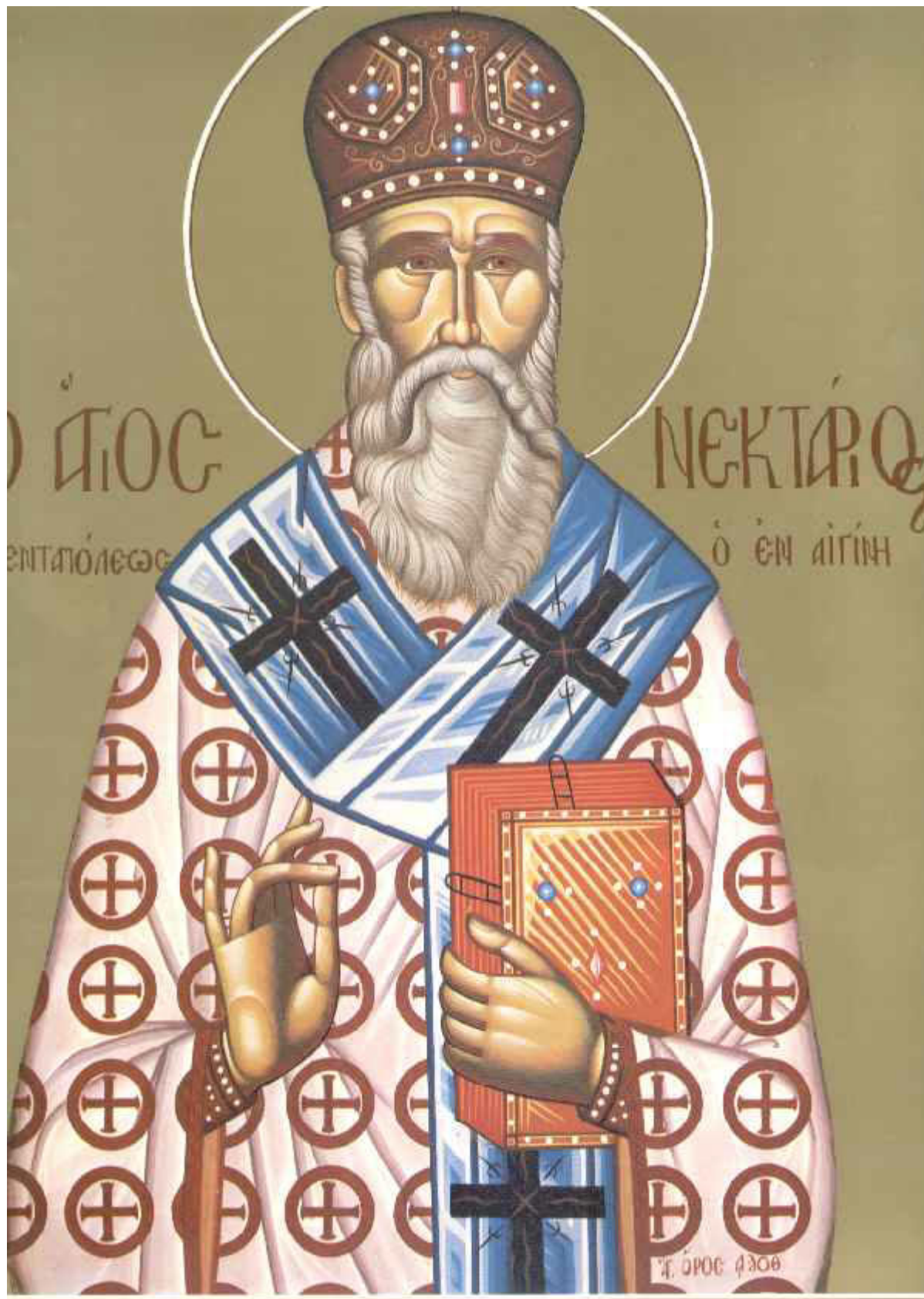
Άγιος Νεκτάριος Μητροπολίτης Πενταπόλεως Αιγύπτου