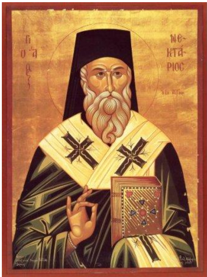
Άγιος Νεκτάριος Μητροπολίτης Πενταπόλεως Αιγύπτου