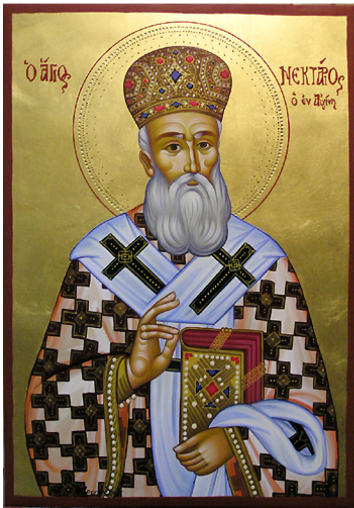
Άγιος Νεκτάριος Μητροπολίτης Πενταπόλεως Αιγύπτου

Εορτάζει στις 9 Νοεμβρίου εκάστου έτους.