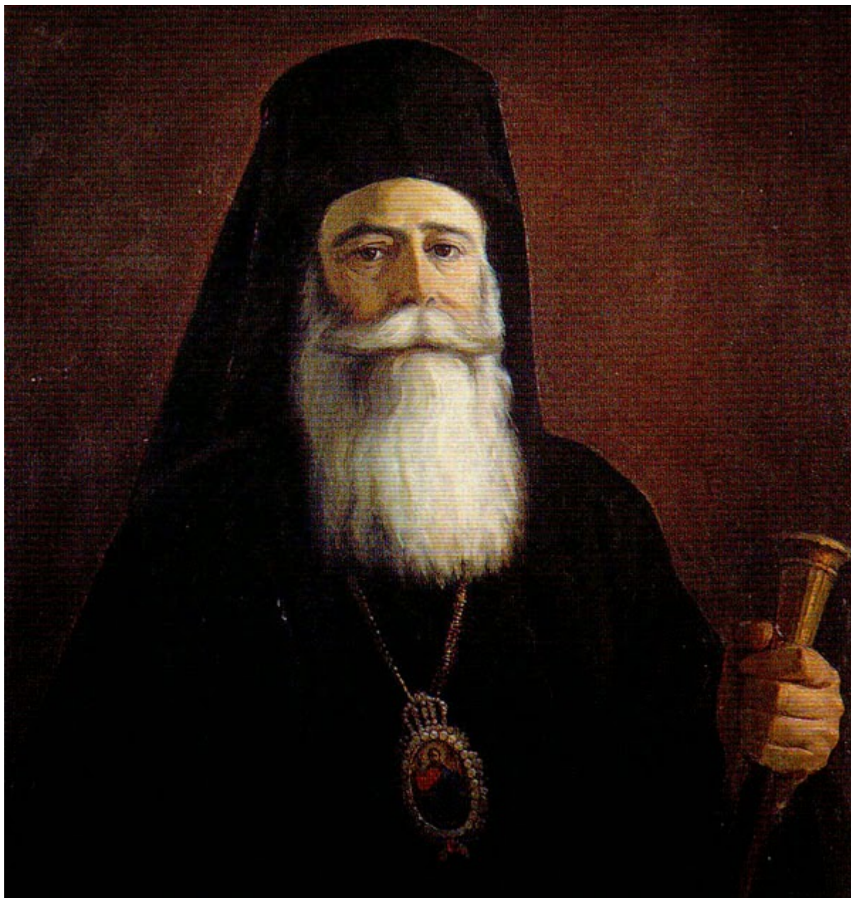
Ο Αρχιεπίσκοπος Αθηνών Χρυσάνθος (κατά κόσμον Χαρίλαος Φιλιππίδης, Γρατινή Ροδόπης, 1881 – Αθήνα, 28 Σεπτεμβρίου 1949) ήταν Έλληνας θεολόγος και ακαδημαϊκός (1940) και μία από τις μεγάλες μορφές της Ορθοδόξου Εκκλησίας των νεοτέρων χρόνων, Μητροπολίτης Τραπεζούντας (1913-1938) και Αρχιεπίσκοπος Αθηνών (1938-1940).

Κι όταν τον Άπρίλιο του 1941 οι Γερμανοί μπήκαν νικητές στην Ελλάδα, πάλι η Έκκλησία έπωμίσθηκε τό μεγάλο βάρος για τή διάσωση του λαού. Πρῶτος σήκωσε τή σημαία τῆς Ἀντίστασης ὁ «ὑπέρτατος πνευματικός ἡγέτης» ὁ ἀρχιεπίσκοπος Ἀθηνῶν Χρυσάνθος . Ἀρνήθηκε νά συμμετάσχει στήν ἐπιτροπή παράδοσης τῆς πόλης τῶν Ἀθηνῶν ἀρνήθηκε νά τελέσει Δοξολογία στόν μητροπολιτικό ναό τῶν Ἀθηνῶν ἀρνήθηκε νά ὀρκίσει τήν κατοχική Κυβέρνηση Τσολάκογλου, μέ τίμημα τήν ἀπομάκρυνση ἀπό τόν θρόνο του.