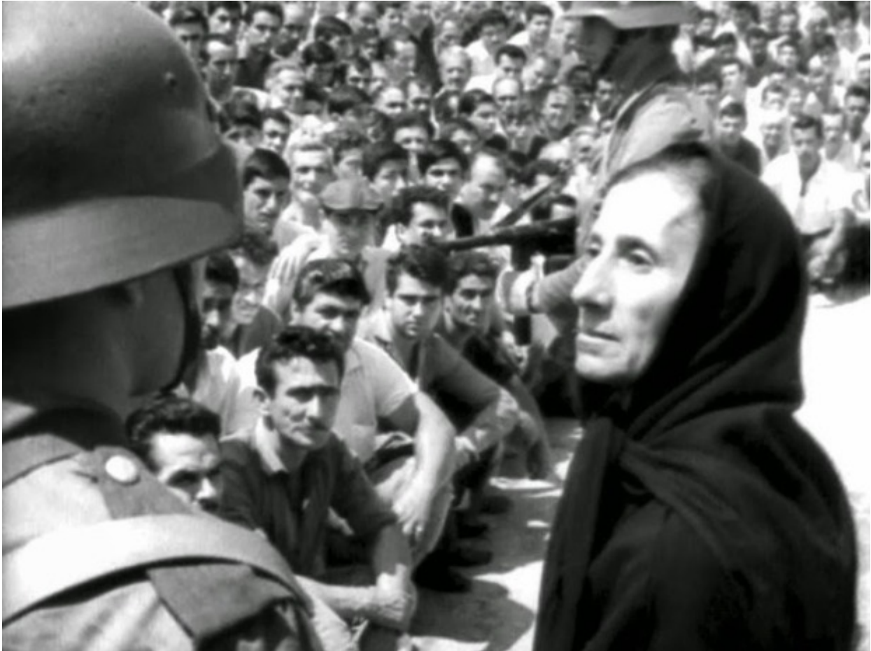
Το βλέμμα της εξοικείωσης με τον θάνατο...