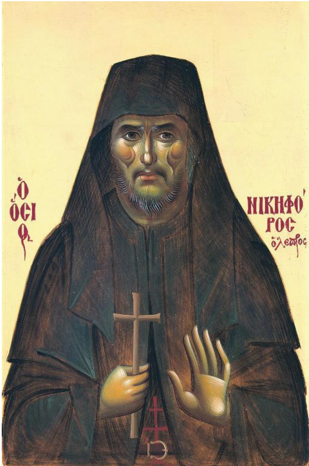
Όσιος Νικηφόρος ο Λεπρός