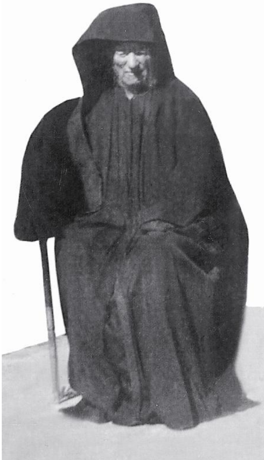
Όσιος Νικηφόρος ο Λεπρός