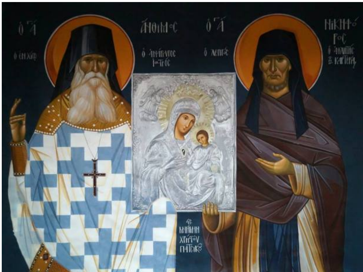
Ἅγιοι Ἄνθιμος-Χίου Νικηφόρος ὁ λεπρός καὶ ἡ θαυματουργή εἰκόνα (αἰγιογραφία Κωνσταντίνου Γιαννάκη)

Εορτάζει στις 4 Ιανουαρίου εκάστου έτους.