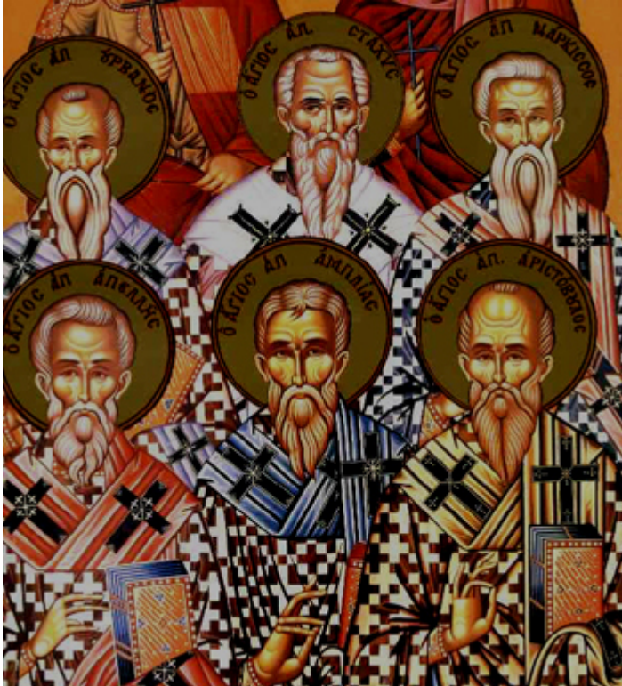
Άγιοι Στάχυς, Απελλής, Αμπλίας, Ουρβανός, Νάρκισσος και Αριστόβουλος οι Απόστολοι από τους Εβδομήκοντα

Ορθοδοξία και Ορθοπραξία / Συναξαριακές Μορφές