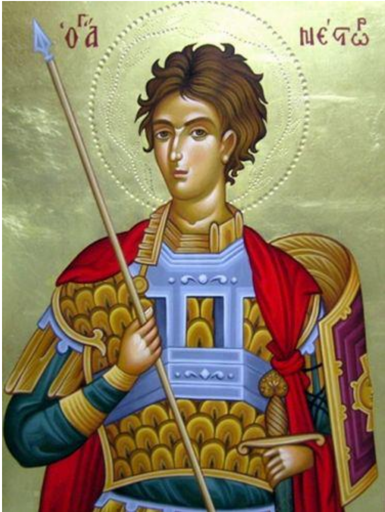
Άγιος Νέστωρ - Σάββας Παντζαρίδης©

Ορθοδοξία και Ορθοπραξία / Συναξαριακές Μορφές