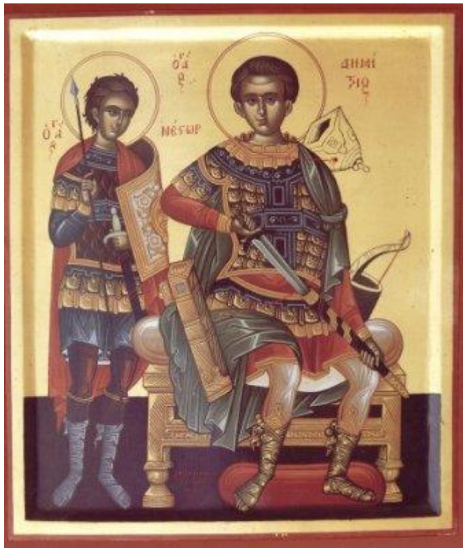
Ο Άγιος Δημήτριος μαζί με τον Άγιο Νέστωρ