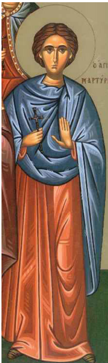
Ἅγιοι Μαρκιανός και Μαρτύριος οἱ νοτάριοι