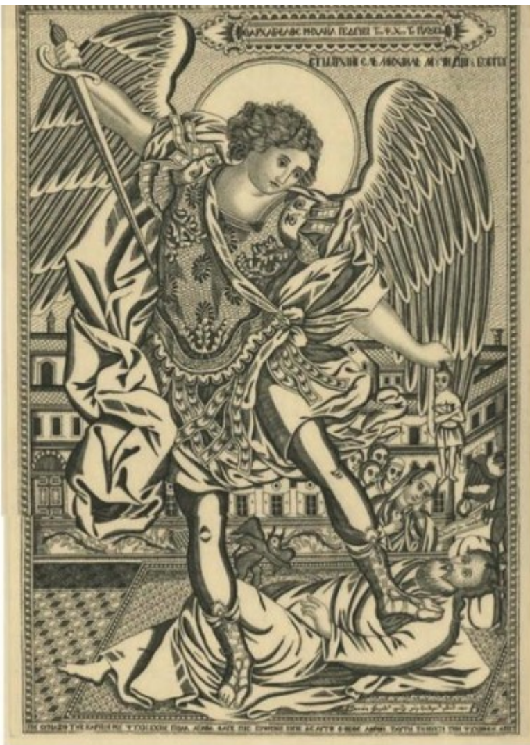
Ο αρχάγγελος Μιχαήλ παιδεύει την ψυχή του πλούσιου Χαλκογραφία, 58,4x41,8 εκ., 1858, (Άγιον Όρος) Χαράκτης: Ευθύμιος ιεροδιάκονος