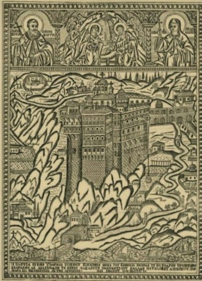
Η μονή Σίμωνος Πέτρας Χαλκογραφία, 43,2x33 εκ., 27 Μαρτίου 1870, (Άγιον Όρος) Χαράκτης: Ιωάννης (Καλόγος)