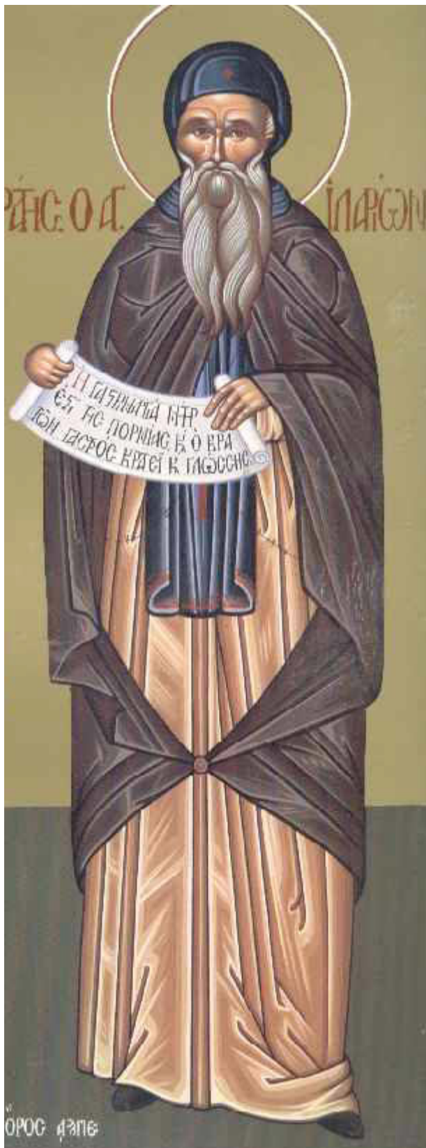
Όσιος Ιλαρίων ο Μέγας