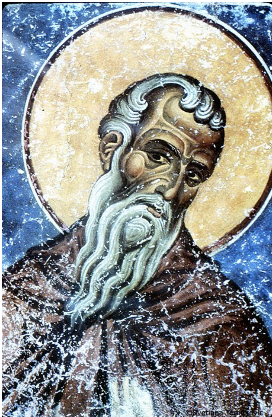
Όσιος Ιλαρίων ο Μέγας