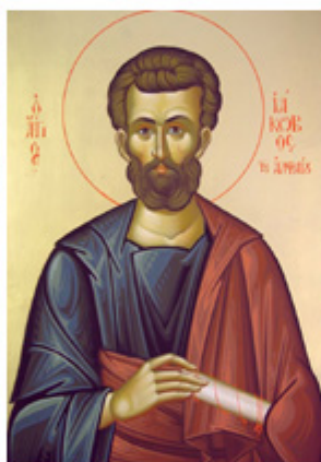
ΑΠ. ΙΑΚΩΒΟΣ ΑΛΑΦΙΟΥ 9 Οκτωβρίου