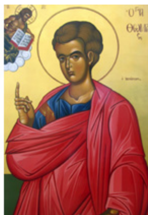
ΑΠΟΣΤΟΛΟΣ ΘΩΜΑΣ 6 Οκτωβρίου