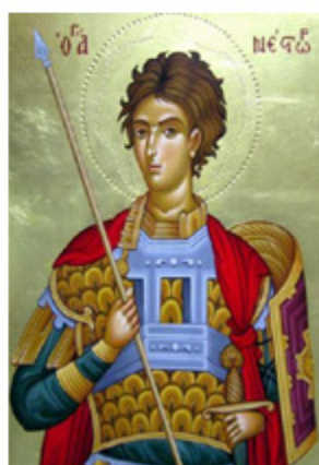
ΑΓΙΟΣ ΝΕΣΤΟΡΑΣ 27 Οκτωβρίου

Ο Οκτώβριος είναι ο μήνας της Θεσσαλονίκης. Κι αυτό, επειδή εκτός από τον πολιούχο Άγιο Δημήτριο, η πόλη γιορτάζει την απελευθέρωσή της από τον τουρκικό ζυγό. Αυτό συνέβη στις 26 Οκτωβρίου 1912, όταν ο ελληνικός στρατός