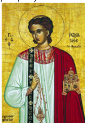
ΑΓ. ΡΩΜΑΝΟΣ Ο ΜΕΛΩΔΟΣ 1 Οκτωβρίου

Τον μήνα αυτόν γιορτάζουν και οι πολιούχοι των δύο μεγαλύτερων πόλεων της πατρίδας μας. Ο Άγιος Διονύσιος ο Αρεοπαγίτης για την Αθήνα και ο Άγιος Δημήτριος για τη Θεσσαλονίκη. Βέβαια έχουμε και τις γιορτές κι άλλων αγίων, που μπορείς να δεις παρακάτω.