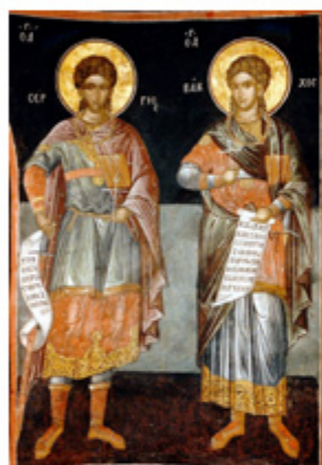
ΑΓ. ΣΕΡΓΙΟΣ & ΒΑΧΚΟΣ 7 Οκτωβρίου