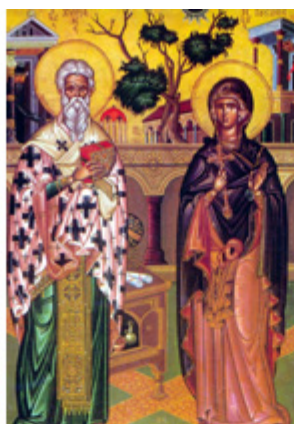
ΑΓ. ΚΥΡΙΑΝΟΣ & ΙΟΥΣΤΙΝΗ 2 Οκτωβρίου