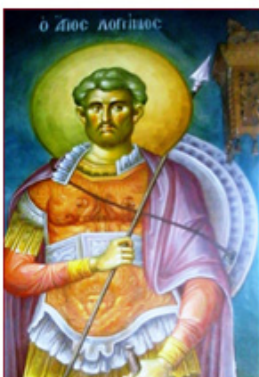
ΑΓΙΟΣ ΛΟΓΓΙΝΟΣ 16 Οκτωβρίου