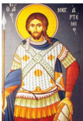
ΑΓΙΟΣ ΑΡΤΕΜΙΟΣ 20 Οκτωβρίου