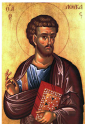
ΑΠΟΣΤΟΛΟΣ ΛΟΥΚΑΣ 18 Οκτωβρίου