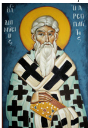
ΑΓ. ΔΙΟΝΥΣΙΟΣ Ο ΑΡΕΟΠΑΓΙΤΗΣ 3 Οκτωβρίου