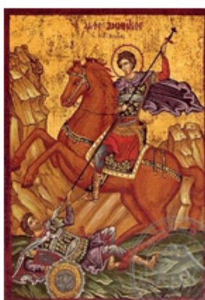
ΑΓΙΟΣ ΔΗΜΗΤΡΙΟΣ 26 Οκτωβρίου