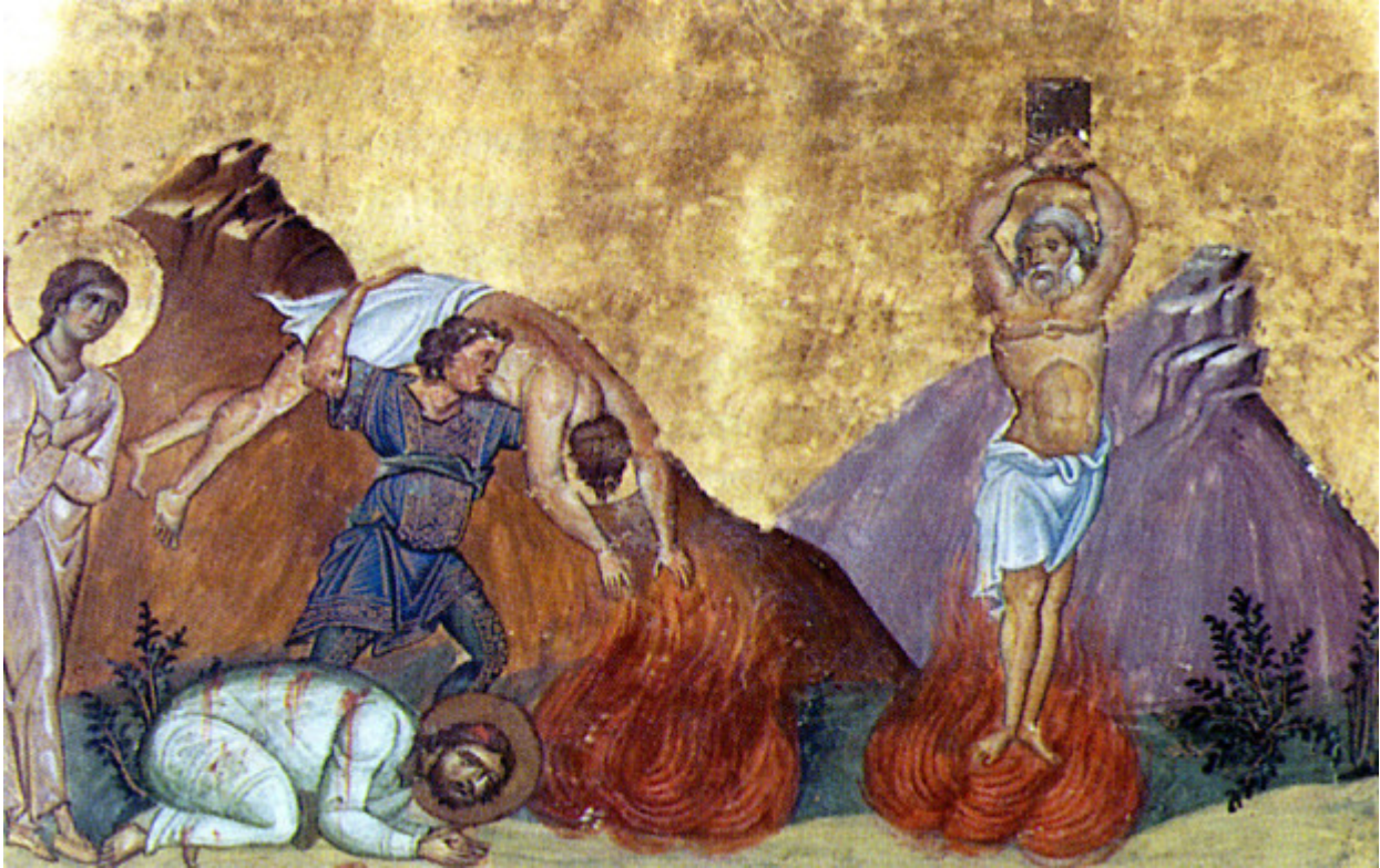
Άγιοι Κάρπος, Πάπυλος, Αγαθόδωρος και Αγαθονίκη

Ορθοδοξία και Ορθοπραξία / Συναξαριακές Μορφές