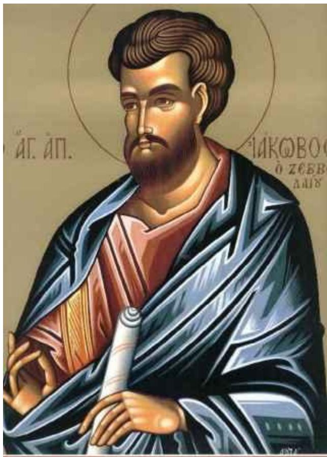
Άγιος Ιάκωβος του Αλφαίου, ο Απόστολος