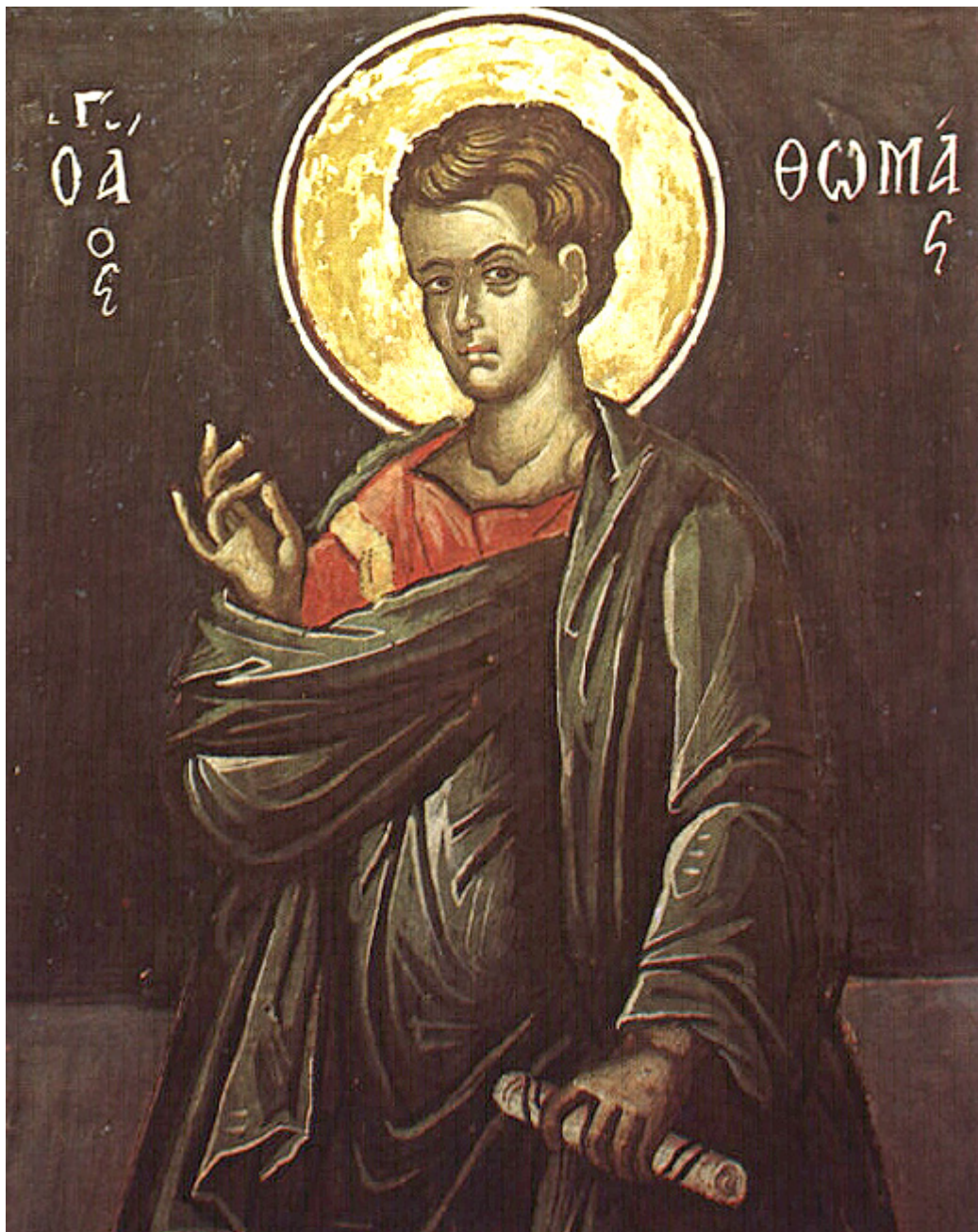
Άγιος Θωμάς ο Απόστολος