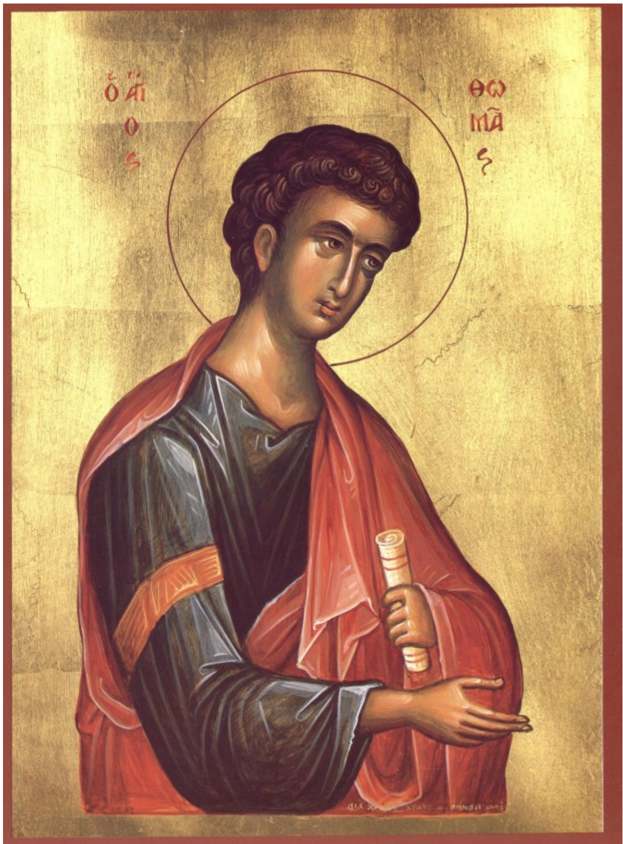
Άγιος Θωμάς ο Απόστολος