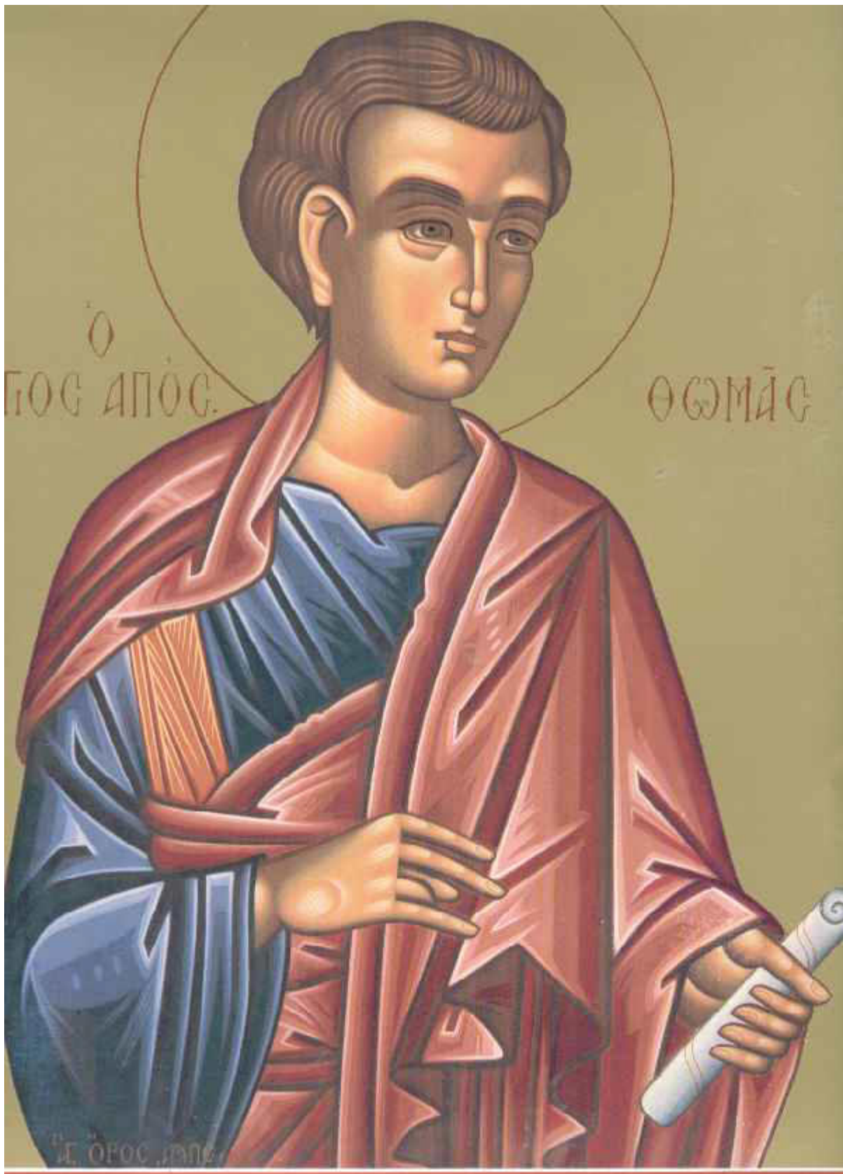
Άγιος Θωμάς ο Απόστολος