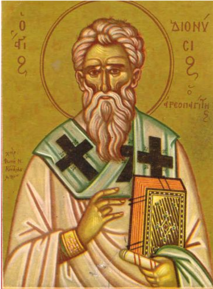
Άγιος Διονύσιος ο Αρεοπαγίτης

Ορθοδοξία και Ορθοπραξία / Συναξαριακές Μορφές