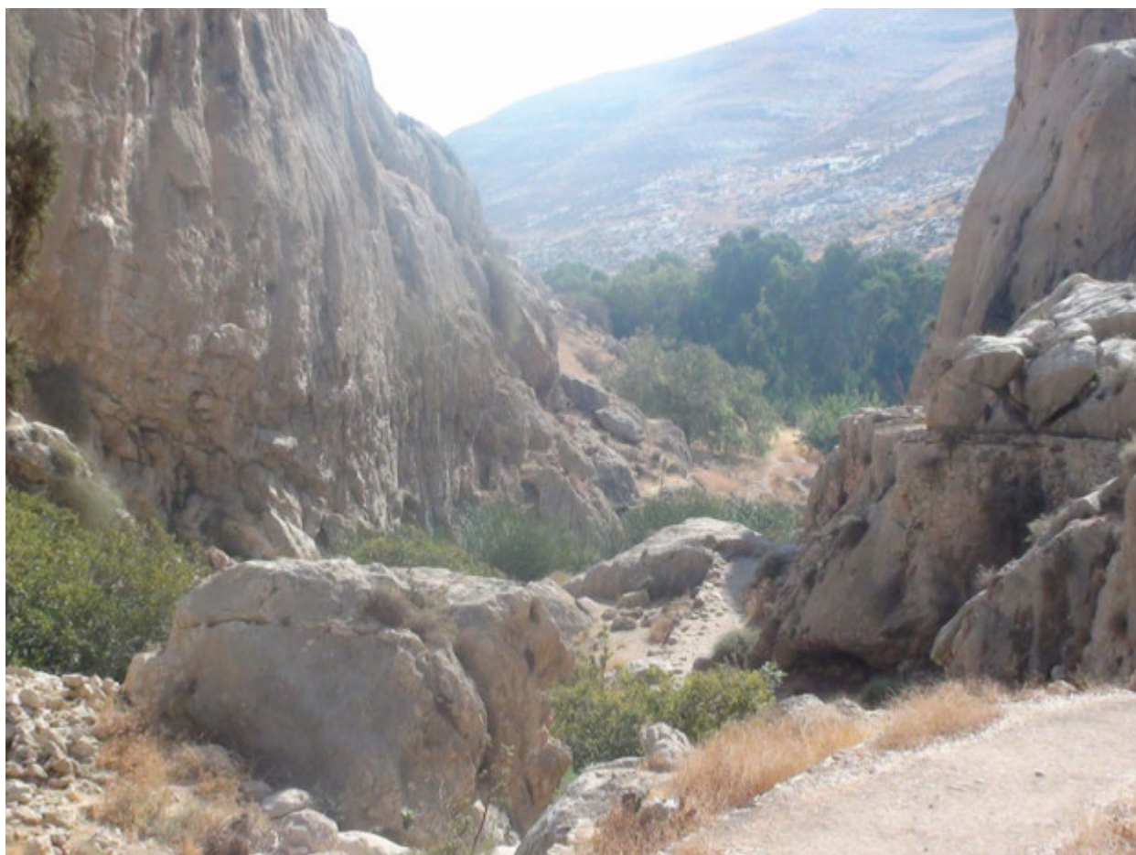
Ο τόπος ασκήσεως του Οσίου Χαρίτωνος