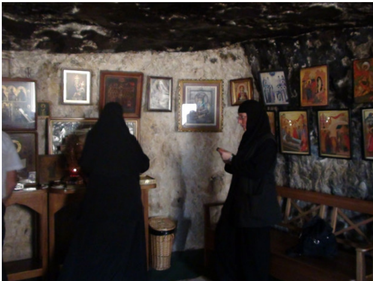
Στο σπήλαιο του Οσίου Χαρίτωνος