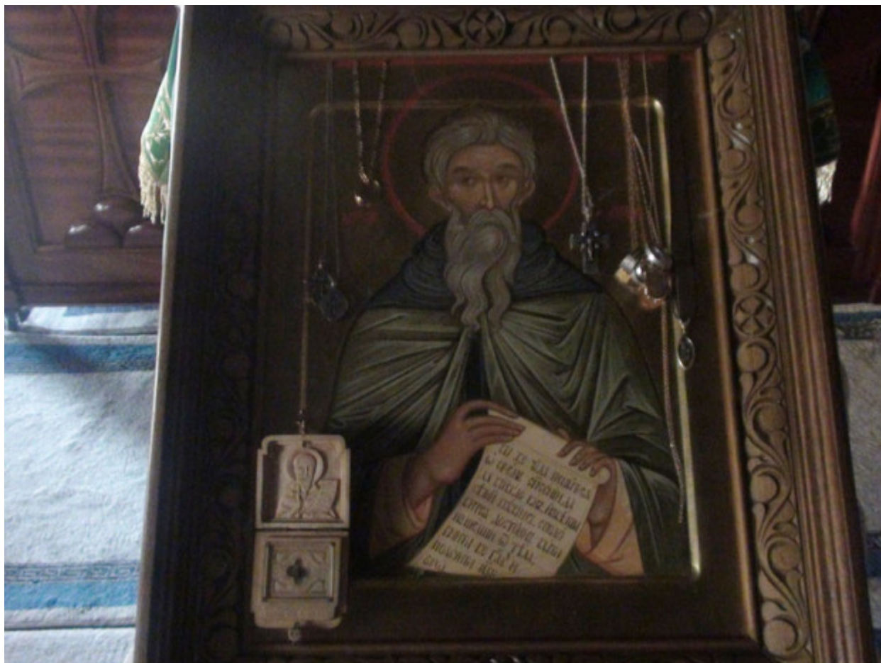
Όσιος Χαρίτων ο Ομολογητής