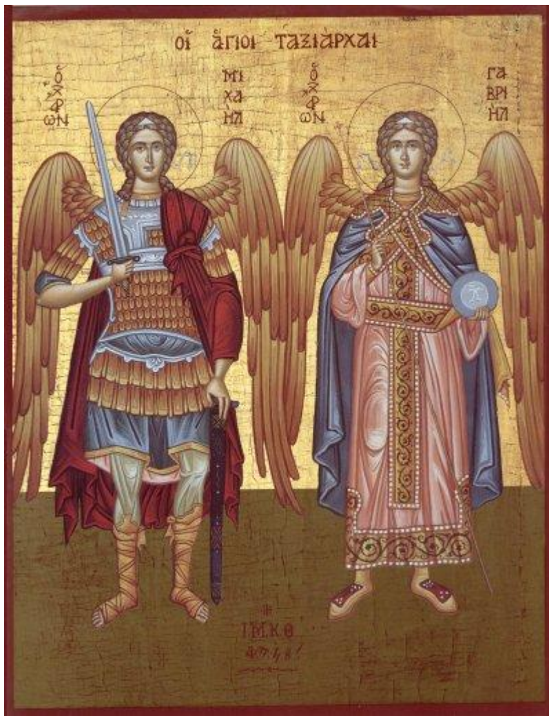
Οι Αρχάγγελοι Μιχαήλ και Γαβριήλ

Στην Αγία Γραφή συχνά γίνεται λόγος για τους αγγέλους. Κατά τον Πρόκλο Κωνσταντινουπόλεως, το όνομα Μιχαήλ ερμηνεύεται ως «Δύναμις Θεού» και Γαβριήλ σημαίνει «άνθρωπος Θεού». Για το λόγο αυτό και ο Αρχάγγελος Γαβριήλ υπηρέτησε με μοναδικό τρόπο την ενσάρκωση του Θεανθρώπου.