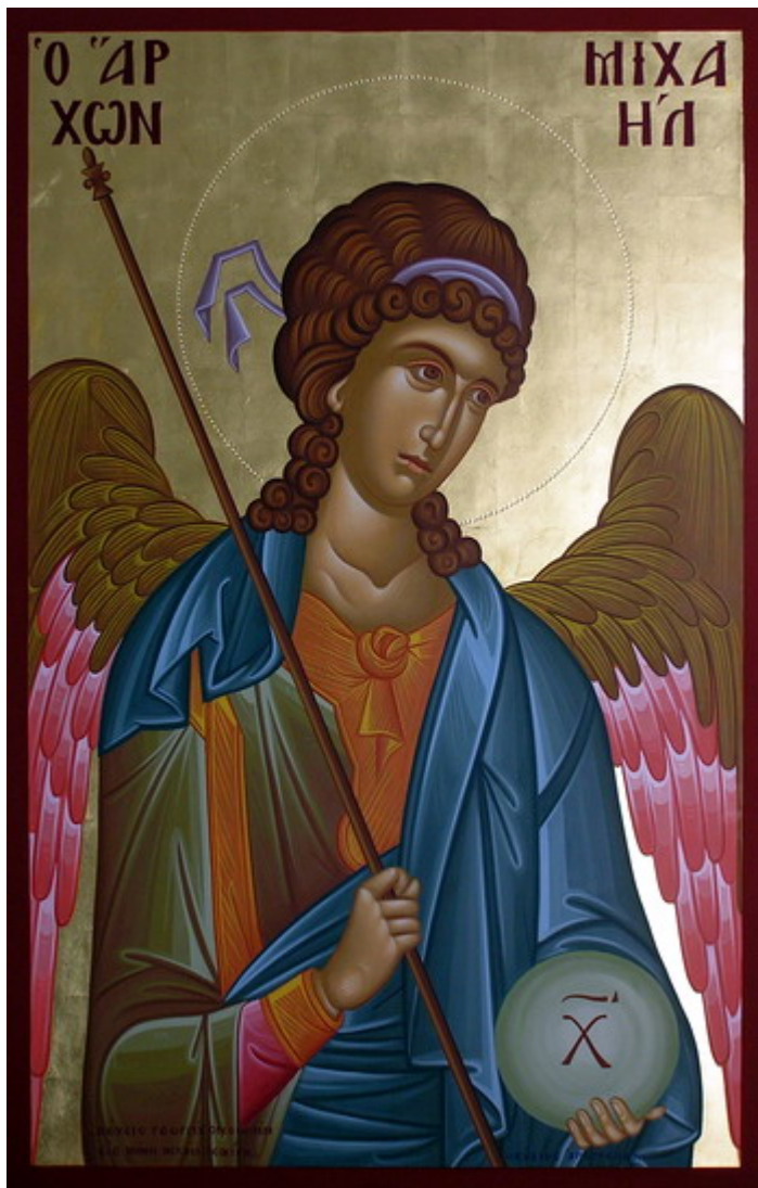
Ο Αρχάγγελος Μιχαήλ

Ο Μιχαήλ είναι ο πιο ένδοξος και λαμπρός ταξιάρχης των ασωμάτων Δυνάμεων. Πολλές είναι οι επεμβάσεις και οι ευεργεσίες του τόσο στην Παλαιά Διαθήκη, όσο και στη Καινή Διαθήκη. Ο Αρχάγγελος Μιχαήλ εμφανίστηκε στον Πατριάρχη Αβραάμ κατά τη θυσία του Ισαάκ. Έπειτα στον Λωτ, όταν τον λύτρωσε μαζί με την οικογένειά του από την καταστροφή των Σοδόμων. Μετά παρουσιάστηκε στον Πατριάρχη Ιακώβ, όταν τον λύτρωσε από τα φονικά χέρια του αδερφού του Ησαύ. Αυτός προπορεύονταν μπροστά από τους Ισραηλίτες όταν ελευθερώθηκαν από την σκλαβιά των Αιγυπτίων, με τη μορφή νεφέλης την ημέρα και φωτιάς τη νύχτα, τους έδειχνε το δρόμο προς τη γη της Επαγγελίας. Αυτός παρουσιάστηκε στον μάντη Βαλαάμ, όταν εκείνος ήθελε να καταραστεί τον Ισραηλιτικό λαό για να μη συνεχίσει το δρόμο προς τη Χαναάν. Αυτός παρουσιάστηκε και στον Ιησού του Ναυή απαντώντας του «Εγώ αρχιστράτηγος Κυρίου νυνί παραγέγονα».