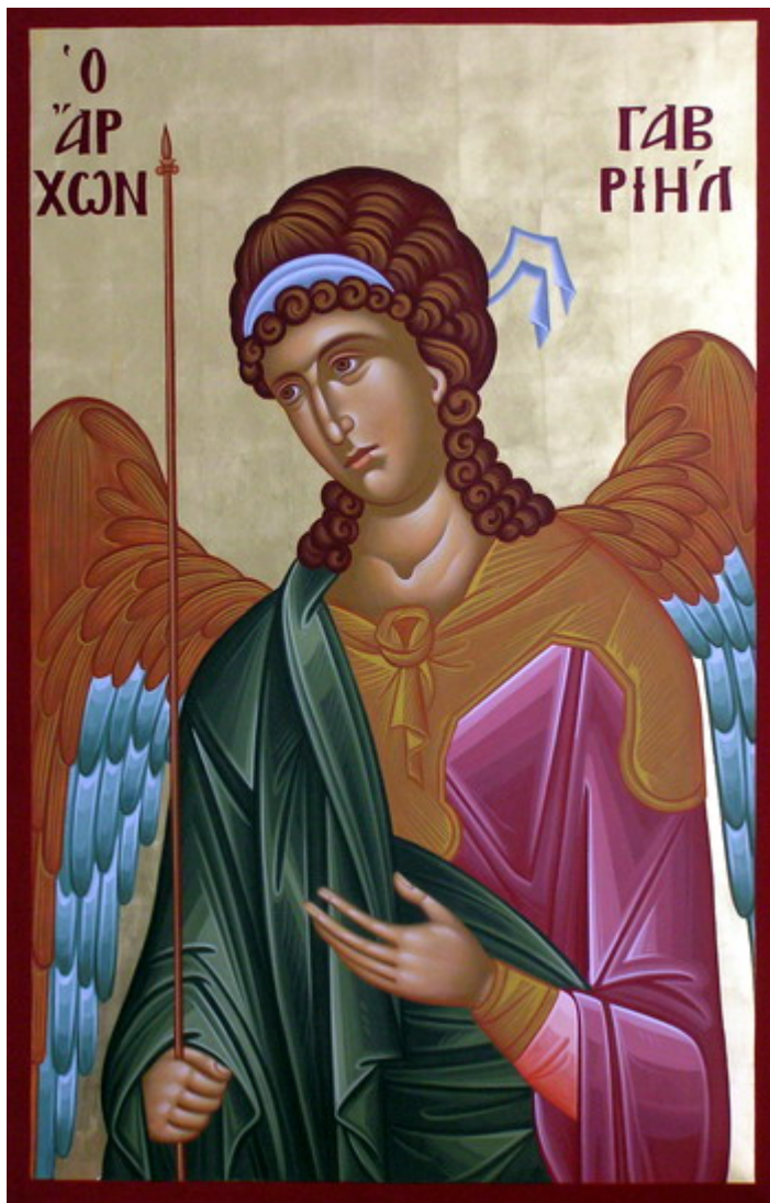
Ο Αρχάγγελος Γαβριήλ

Μαζί με τον Αρχάγγελο Μιχαήλ εορτάζεται και ο Αρχάγγελος Γαβριήλ. Πολλές είναι οι επεμβάσεις και οι ευεργεσίες του τόσο στην Παλαιά Διαθήκη, όσο και στη Καινή Διαθήκη. Ο Αρχάγγελος Γαβριήλ ήταν αυτός που παρουσιάστηκε στον Δανιήλ και εξήγησε το όραμα που είδε περί των βασιλέων Μήδων, Περσών και Ελλήνων (Δαν. 8,16). Και πάλιν ο Γαβριήλ φανέρωσε στον Δανιήλ, ότι μετά από εβδομήντα χρόνια θα κρατήσει η αιχμαλωσία των Ισραηλιτών, και μετά από τετρακόσια ενενήντα επτά χρόνια θα έρθει ο Χριστός (Δαν. 9,21-25). Ο Γαβριήλ ήταν αυτός που έφερε την είδηση στην γυναίκα του Μανωέ, ότι θα γεννήσει τον Σαμψών.