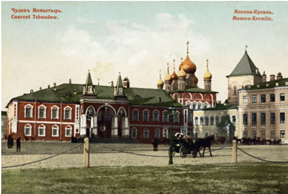
Το μοναστήρι του Θαύματος κατεδαφίστηκε το 1929 κατά την περίοδο των διώξεων εναντίον της θρησκείας.

Θεοτόκου του Καζάν στην Κόκκινη πλατεία, ο οποίος κατεδαφίστηκε το 1936 και κατασκευάστηκε εκ νέου το διάστημα 1990-1993, δίνει μια άλλη διάσταση στο θέμα.