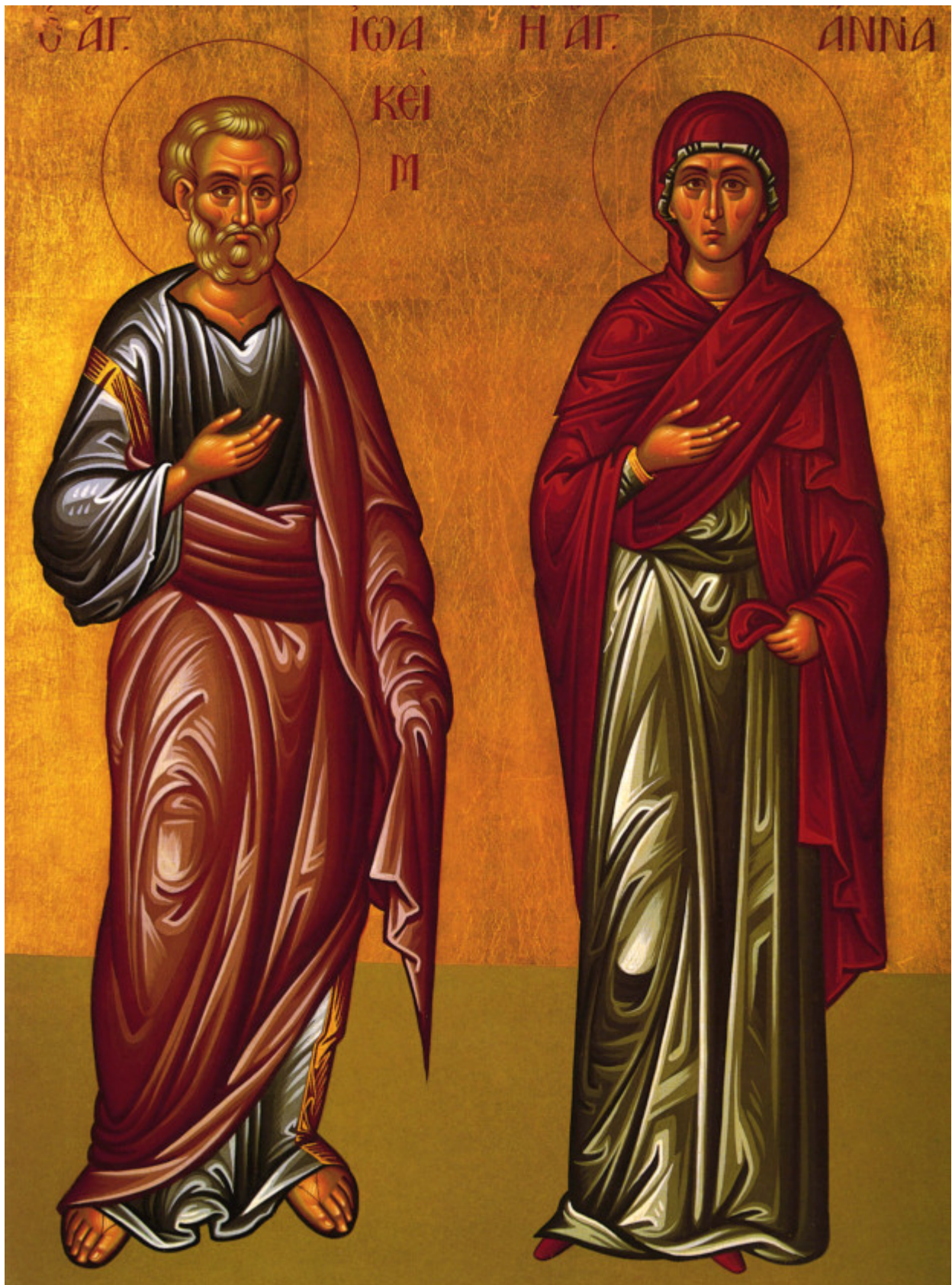
Μνήμη των Δικαίων Θεοπατόρων Ιωακείμ και Άννης